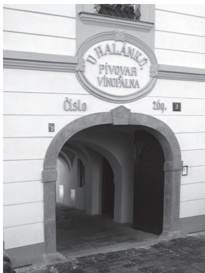
Budova Náprstkova muzea na Betlémském náměstí je němým svědkem komikových začátků.