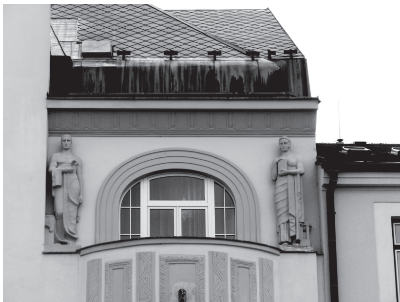
Sokly z Ferencovy dílny jsou dodnes umístěny na secesní humpolecké radnici.

se jedná částečně o autobusty, do nichž Ferenc zapracoval nejen rysy své, ale i svého bratra Emany. Patrně právem. Bohužel není možné dnes přesně určit z žádného hodnověrného pramene, kdy je Ferenc vytvořil ani kdy byly na fasádu divadla umístěny. Jsou však hmatatelným důkazem Ferencovy vskutku profesionální sochařské práce, která nepostrádala invenci. 6