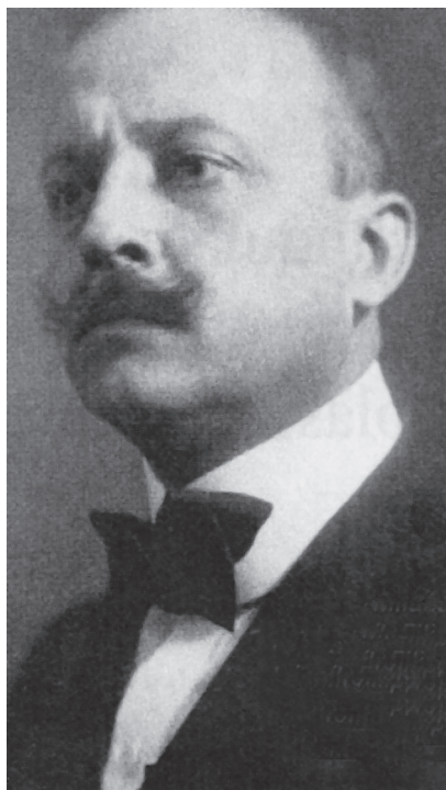
Filippo Tommaso Marinetti. Básník, dramatik a zakladatel originálního uměleckého směru – futurismu.