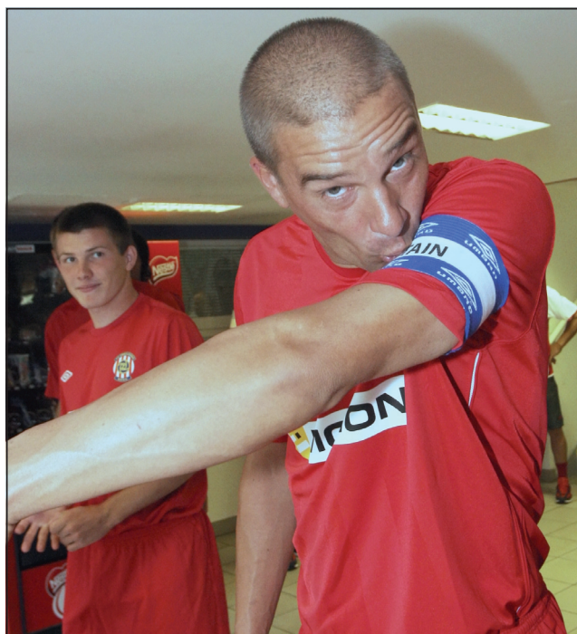
Angažmá v Brně pro mě ale nakonec skončilo smutně.