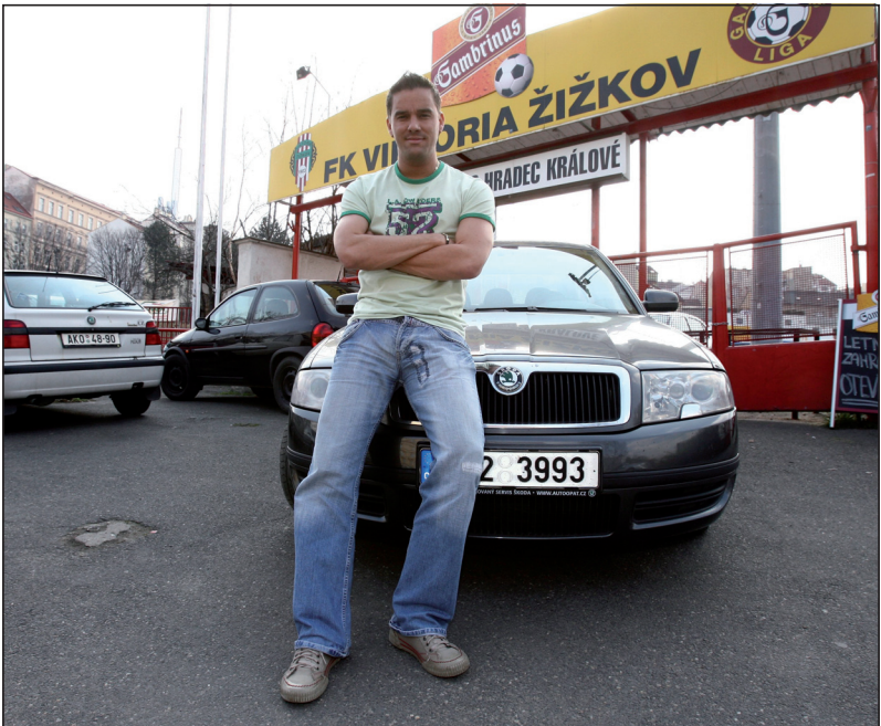
Rok 2007 a návrat do Prahy