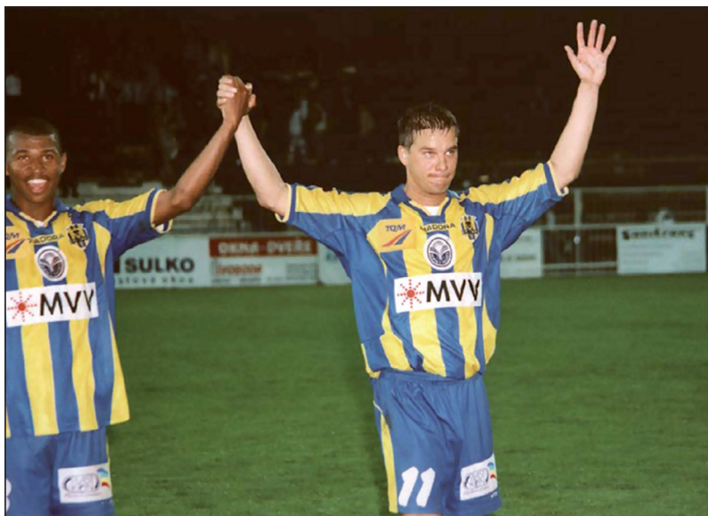
V Opavě jsem za sezónu nastřílel 20 gólů.