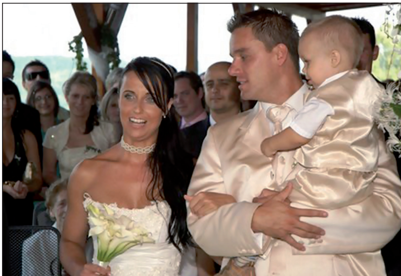
S Luckou jsme měli svatbu 6. června 2008 na Brněnské přehradě. Daneček už byl na světě.