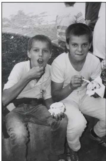
Chutnalo mi odmalička.