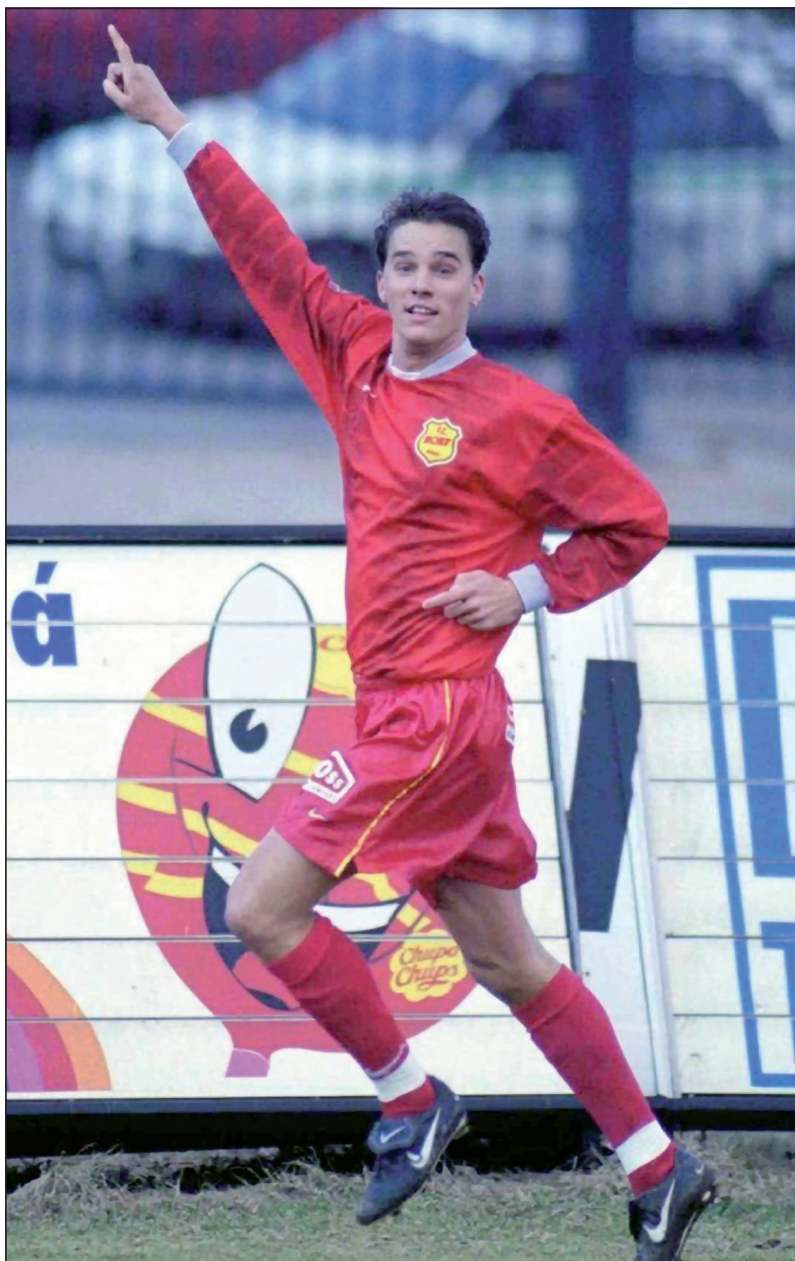
V brněnském dresu slavím gól proti Slavii Praha.