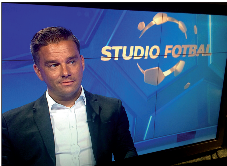
Jako fotbalový expert ve studiu ČT Sport