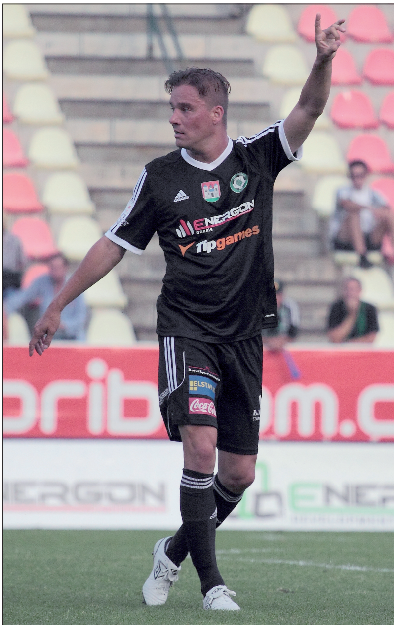
V příbramském dresu jsem v roce 2014 ukončil profesionální kariéru.