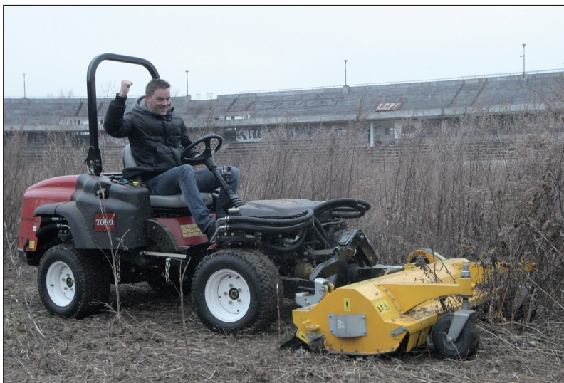
Dalo nám to hodně práce...