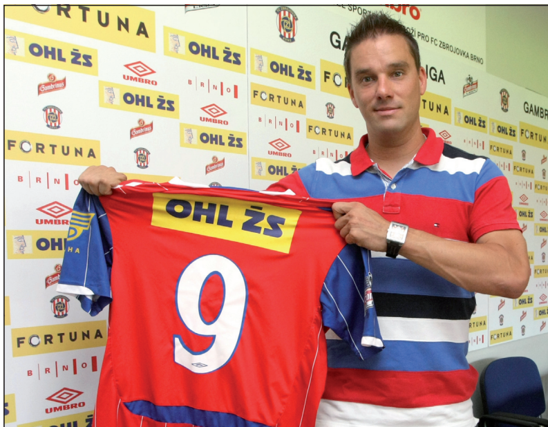
Léto 2011 a další návrat do Brna