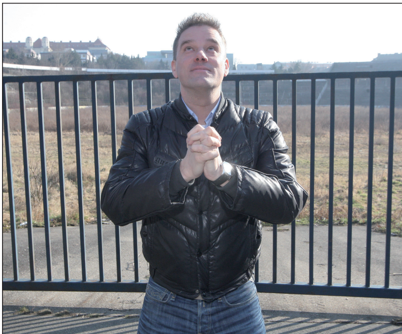
Modlení za rozlučku s kariérou na zchátralém stadionu za Lužánkami