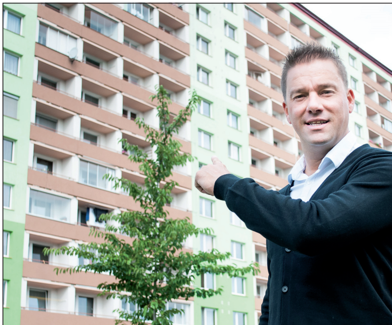
Tady jsem vyrůstal.