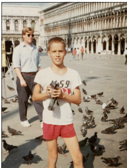
Během fotbalového turnaje v Itálii