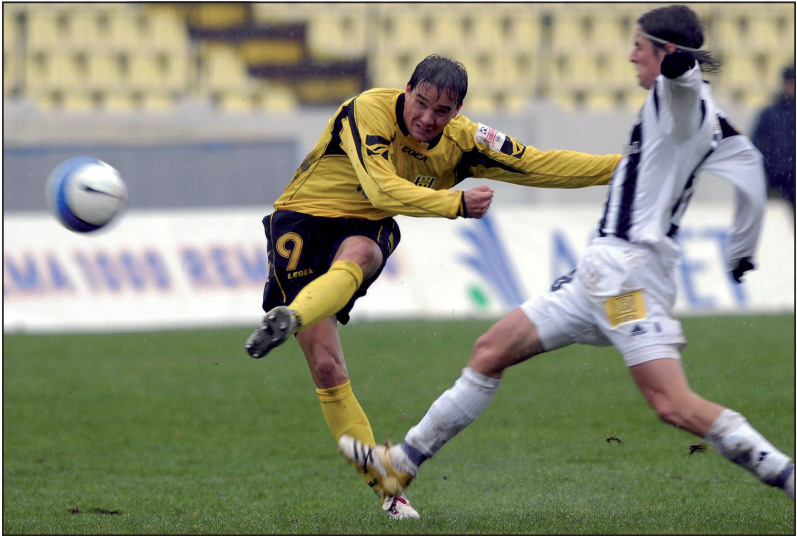
Na Slovensku jsem vydržel jen půl roku.