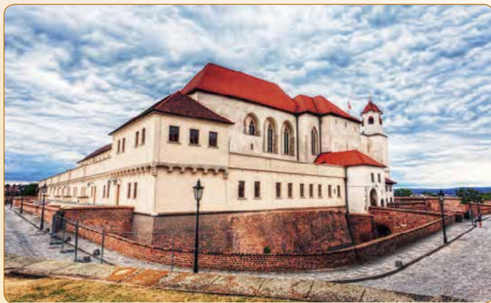
▲ Brněnský hrad Špilberk