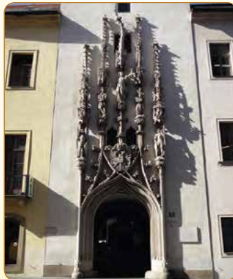
▲ Portál Staré radnice se zakřivenou věžičkou