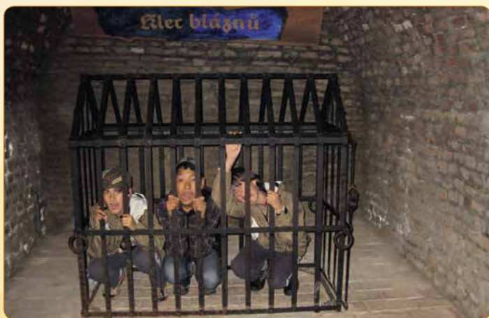
▲ Brněnské podzemí si užijí i děti. Foto: Věnceslava Schenková