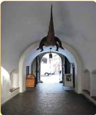
▲ Proslulý brněnský drak

Na radnici sídlí turistické informační centrum a galerie. V letní sezoně jsou k vidění historické sály a také 63 metrů vysoká věž s vyhlídkovým ochozem. Vstupenky seženete v informačním centru a po jeho uzavření v pokladně v prvním patře vyhlídkové věže.