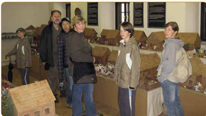
▲ Moravskou vesničku si užijete s celou rodinou.