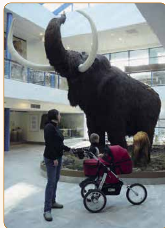
▲ Děti jistě zaujme oblíbená rekonstrukce mamuta