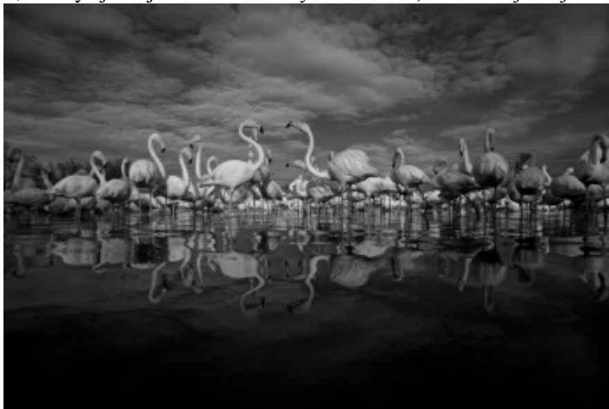
Plameňáci, 18. 4. 2014

Protože chtěla vyfotit námluvy a páření plameňáků. Výsledkem bylo několik fotek. Tak krásných, že když jsem jednu z nich na výstavě uviděl, okamžitě jsem ji koupil.