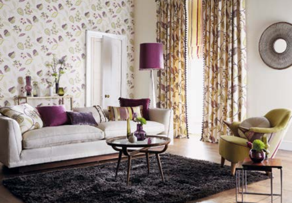
121 Stavebně má interiér téměř „zámecké“ parametry, je však vybaven směsicí retro prvků, moderních dekorací a originálních kombinovaných textiliemi a tapetou.

Častým požadavkem zadavatele bývá „útulnost“. Co si pod tímto pojmem představit? Položenou otázkou se dostáváme k dalšímu kontextu, který designér při tvorbě interiéru zohledňuje, a to je kontext psychologický . Designér by měl vždy posoudit, jak klient žije, jaký styl upřednostňuje, v čem je mu dobře, co mu dělá radost, na co by se chtěl v interiéru dívat. Překvapivě je, že většina klientů se nad touto otázkou vlastně příliš nezamýšlí a často slepě opakuje styl sousedů, přátel nebo to, co se nejčastěji nabízí v časopisech o bydlení jako trend. Tady se právě otevírá široký prostor pro schopnost designéra dobře poznat klienta a ušít mu interiér na míru. Naše práce nám dává obrovskou šanci zlepšit kvalitu bydlení, a tím i života našich klientů. Člověka totiž nejvíce ovlivňuje to, čím se obklopuje – ať už jsou to věci nebo lidé.