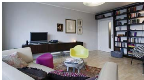
Interiér je vybaven zařizovacími předměty v moderním i retro stylu, neutrální barevný základ je akcentován výraznými barvami na menších kusech sedacího nábytku a na textiliích. Dekorování je úsporné a vkusné, celek působí útulně.

v pravém slova smyslu přece nemusí znamenat nevkus a zahlcenost prostoru. Jde o to cítit se v místnosti dobře a bezpečně. A toho můžeme dosáhnout i jinými prostředky než přemírou věcí – vhodnou kombinací barev, dokonalou dispozicí a měřítkem, dobře zvoleným sedacím nábytkem, vkusnými dekoracemi nebo textilem.