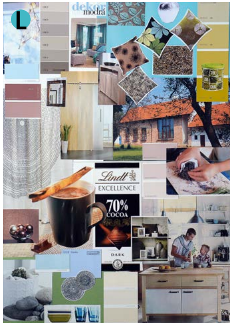
Moderní venkovský styl s vůní čokolády.

Nesnažte se vytvořit z panelového bytu chalupářský interiér. Bytu to nebude slušet a může jít o hodně nevkusnou záležitost. Městský byt má jiná pravidla než venkovské bydlení. V takovém případě se vytrácí jakákoli autenticita a pravdivost. Pokud někdo touží po venkovském stylu, ať se tam raději přestěhuje.