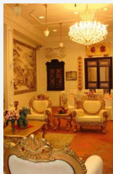
Okázalý zámecký interiér.