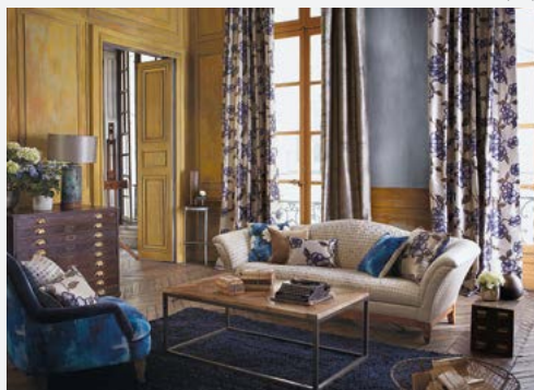
Zámecký interiér je zařízen kombinací současného i historického nábytku.

Styl, který kopíruje život šlechty a reprezentuje majitele ukázkou bohatství a úcty k tradicím. Může sestávat z kusů zrestaurovaného historického nábytku, případně z jeho replik. Sedací nábytek bývá nově ocalouněn, používají se textilní tapety s historizujícími vzory. Nejsme však restaurátoři a naší úlohou v soukromých interiérech není vytvořit iluzi divadelní nebo filmové kulisy. Tvořivé uchopení tohoto stylu lze pojmout například použitím nových čalounických tkanin s tradičními vzory, ale v neobvyklé velikosti nebo barevnosti. Se zámeckým stylem se často setkáváme v hotelích nebo zámcích, které byly restituovány či získaly nové majitele a slouží jako restaurace nebo penziony. Pozornost bývá věnována bohatému textilnímu dekorování oken formou těžkých závěsů a římských nebo vídeňských rolet. Nábytek bývá z tmavého dřeva s intarzií. Využívá se zlacení – na kovech i dřevě. Podmínkou důstojného použití tohoto stylu jsou tomu odpovídající prostory – vysoké stropy, vysoká okna, rozlehlé místnosti.