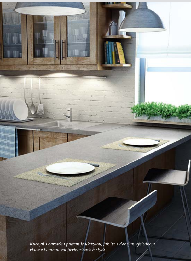
Kuchyň s barovým pultem je ukázkou, jak lze s dobrým výsledkem vkusně kombinovat prvky různých stylů.