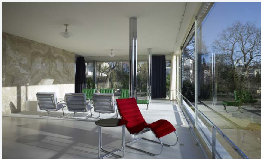
Brněnská vila rodiny Tugendhat.

je brněnská vila Tugendhat, na níž lze charakteristické rysy stylu dokonale rozeznat – geometrická čistota tvarů, nulová dekorativní zdobnost – prostor „zdobí“ jen prvky, které v něm mají přesnou funkci, barevnost je neutrální s minimem akcentů. Tvůrci ve stylu funkcionalismu kladli důraz také na kvalitní a výrazné materiály.