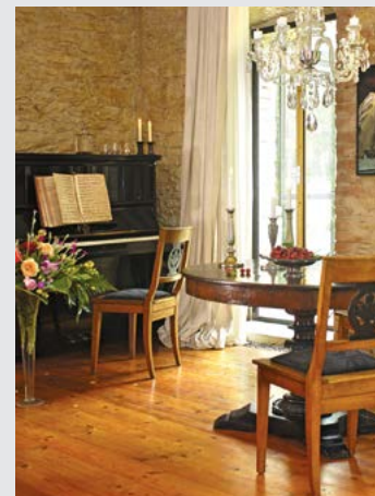
| 11 |

Pod tímto názvem se skrývá dekorativní styl, který je v našich končinách oblíbený zejména u starší generace nebo obecně u staromilců. Jedná se o útulné, elegantní interiéry, ve kterých jsou používány tradiční materiály, jako dřevo, zdivo, kámen, keramika. Pod tento styl lze zařadit i interiéry, které se odkazují k prvkům typickým pro bydlení v určitém regionu nebo státě (například anglický venkovský styl). Mezi charakteristické rysy tohoto stylu patří používání mohutnějších nábytkových solitérů či čalouněný sedací nábytek – pohovky, křesílka, lenošky. Nábytek bývá zpravidla z tmavého dřeva, náročně vyřezávaný s puncem ruční práce. V kuchyních se můžeme setkat s nábytkem z běleného nebo bíle natřeného dřeva, s výraznými vestavbami digestoří. V tomto stylu se nešetří textilem, typická jsou okna dekorovaná několika druhy textilií,