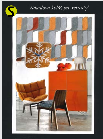
Náladová koláž pro retrostyl.

nejen na venkovských chalupách, ale často se v různých podobách a s různým úspěchem stěhuje i do městských bytů nebo domů. Charakteristickým rysem je použití masivního dřeva na nábytku a výrazných nábytkových solitérů, jako jsou příborníky, kredence nebo dřevěné lavice. Nesmí chybět velký dřevěný stůl. V interiérech se objevuje kámen, výhradně však z místních zdrojů a v přírodní podobě, případně lícová cihla. Podlahy jsou prkenné nebo dlážděné z půdovek nebo se setkáme s dlažbou v barvě terakota. Tmavé přiznané trámy dřevěných stropů tento styl výborně podtrhují. Okna jsou dekorována zpravidla krátkými záclonkami a závěsy z plátna s drobnými vzory – proužky, kostkami, lučnými květy. Dekoracemi jsou předměty denní potřeby venkovana – různé nádoby (džbány, talíře, hrnce, ošatky), zemědělské náčiní, vystavené sušené plodiny (věnce z obilných klasů, cibule, česnek apod.). Co se týče osvětlení, setkáme se s lucernami a svítidly zpravidla v černém kovu, mohou být použita textilní stínidla sladěná s ostatním textilem. Zdroj tepla dodá tu správnou atmosféru – ideálně v podobě pece nebo kachlových kamen. S úspěchem se dá využít výrobků z kovu, ať už původních nebo od současných uměleckých kovářů, a to nejen na drobné předměty a dveřní kování, ale třeba i na rámy postelí.