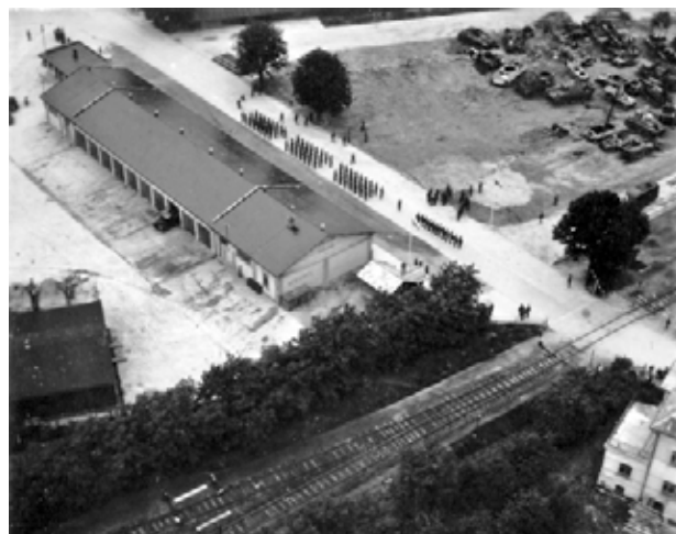
Letecké záběry místa soustředění kořistní techniky v posádce Milovice, pořízené 2. června 1946 při příležitosti oslavy opětovného zahájení činnosti ve Vojenském výcvikovém táboře Mladá [2]