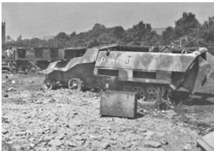
Fotografie z jednoho z míst soustředění kořistní techniky ve středních Čechách, zřízených vojsky Rudé armády (vozidla označena kombinacemi písmen azbuky a čísel). Na snímku vlevo dole Sd.Kfz. 251 Ausf. D označený 6A 3044 [2]