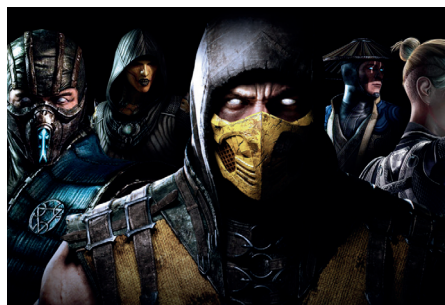
Mortal Kombat X

Zdá se, že ani druhou hru v našem seznamu netřeba nijak extra představovat. Je to prostě starý dobrý Mortal Kombat, který se nebojí létajících vnitřností, zlámaných kostí a dekapitací. Zároveň je to ale zosobnění her pro gaučový multiplayer. Tímto zástupcem jsme chtěli dát