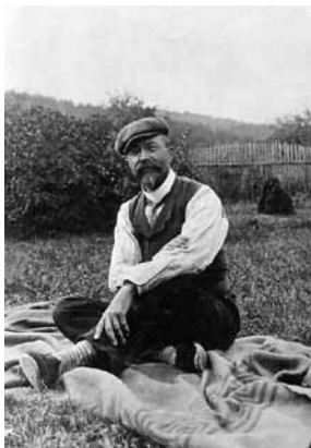
TGM během letního pobytu Na Žabárně u Valašského Meziříčí 1906