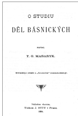
Titulní list zvláštního otisku Masarykovy přednášky O studiu děl básnických (1884)

Jenže ovšem, Masarykovi jako nic na světě, tak ani vznešenost poslání uměleckého nebyla pouhou třpytnou, okázalou frází, kterou se opojuje dětinská ješitnost, aby mohla tím jistěji provozovat svoji povrchní, polovičatou hru. Pojem, jež vyslovil o umění a zejména literatuře jakožto umění nejrozsáhlejších prostředků, ten pojem zahrnoval u Masaryka také umělecké povinnosti, a to povinnosti, na něž naši tvořící lidé zhusta nepamatují. Masaryk je nastínil hned v té své estetické knížečce. Umělec měl být nadán „větší silou, mohutností a jistou ohromností citů i vůlí“ (platonovskou „božskou mánií“ z Ióna), jeho cit měl být zdravý, čistý, pravdivý, vážný, vlastnosti, které dávno nejsou tak snadny, za jaké se pokládají, a především umělec měl horlivě dbát důkladného vzdělání. Masaryk vystavil za příklad tvůrce, jako byli Lessing, Goethe, Schiller, Dante, Leonardo da