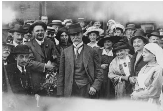
TGM v Kyjevě 1917

Masaryk je u nás první filozof krásného individualismu, první individualista činu, činu, jenž má všechny příznivé vlastnosti socializovat se a umožnit nový vývoj. Vybojoval sebe sám proti všem, svojí filozofií přivedenou v úzký vztah k životu, učí vybojovat nové české já, novou českou rodinu, nový český národní život. Vypracoval v sobě a pro všechny české já po všech jeho