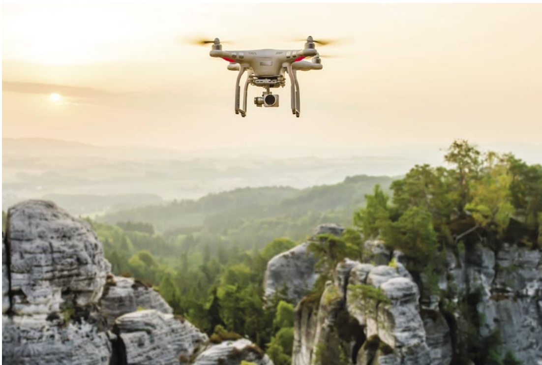
Malá komerční kvadroptéra (DJI Phantom 3 Advanced). [PJJ]

ností a nekvalitních záznamů z kamery. Doporučujeme jim věnovat zvláště velkou péči. V předletové přípravě se vždy ujistěte, že jsou všechny v pořádku.