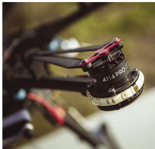
Motor se skládací vrtulí. [AC]

Motorů obsahuje běžná multikoptéra tolik, kolik má vrtulí. Dnes se používají výhradně motory bez komutátoru, tzv. BLDC (Brushless DC) motory. Je to velmi jednoduchý a spolehlivý typ motoru, který nevyžaduje speciální údržbu. Skládají se ze statoru, na kterém je vinutí z měděných vodičů, a z rotoru s neodymovými magnety. Právě drobnými změnami v otáčkách každého motoru se mění tah jednotlivých vrtu-