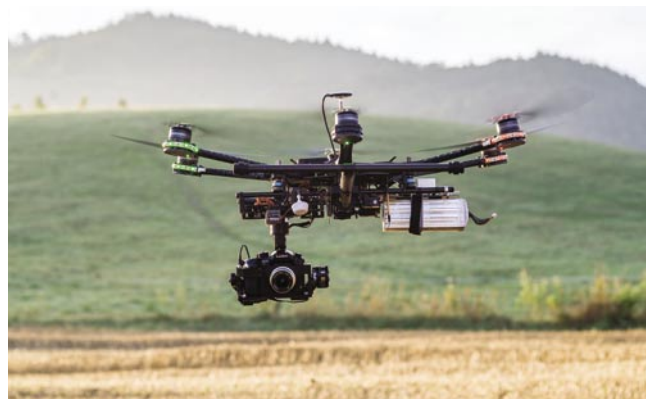
Velká filmová hexakoptéra s šesti rameny a gimbalem umožňujícím nekonečnou horizontální rotaci kamery (360 stupňů). [PJJ]

Jako příklad si uvedme označení 11×4,5, které náleží průměru 11 palců a stoupání 4,5 palců (po jednom otočení se v ideální kapalině posune o 4,5 palců). Přestože je to možné, nedoporučujeme používat jiné rozměry rotorů, než jaké jsou doporučené výrobcem letounu či motoru, může to vést k poškození motoru, elektroniky či nestabilnímu letu.