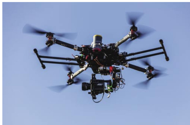
Velká filmová oktokoptéra o čtyřech ramenech se zavěšeným gimbalem MOVI a profesionální kamerou. Na straně je patrný padákový systém. [VI]