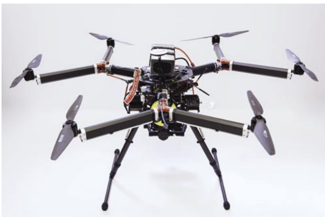
Velká filmová hexakoptéra na uhlíkovém rámu o třech ramenech se skládacím podvozkiem. [VI]

Pro správné fungování je podstatné, aby byly vrtule vyvážené. Proto se doporučuje udržovat je prosté nečistot a zásadně se vyvarovat používání vrtulí poškozených, obzvláště s ulomenými či naštíplými konci. Vrtule je hlavní zdroj vibrací, které se přes rám dostávají do řídicí jednotky a ke kameře. Vibrace bývají hlavním důvodem špatných letových vlast-