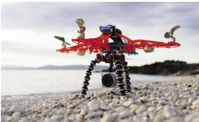
Malá nekomerční kvadroptéra - domácí výroba. [PJJ]