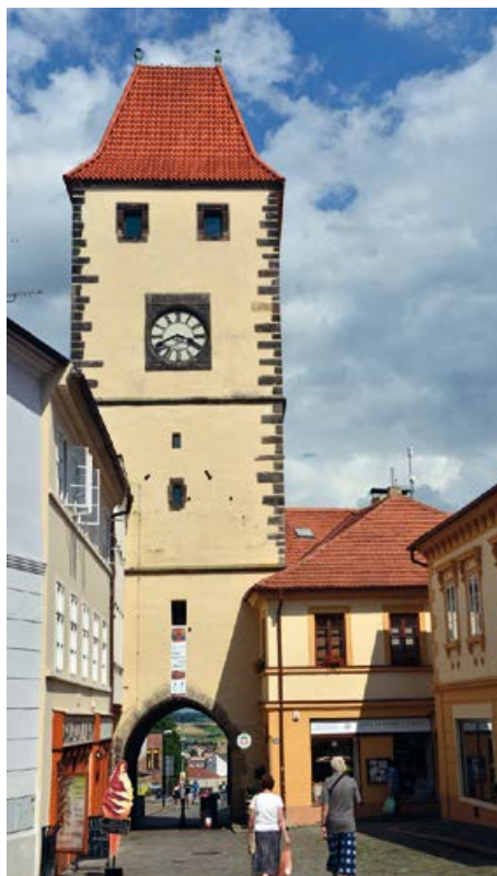
Pražská brána – součást bývalého městského opevnění