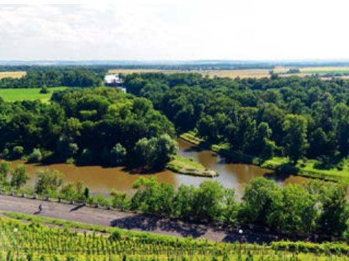
Soutok Labe s Vltavou

Vraňansko-Hořínský plavební kanál byl vybudován v letech 1903–1905. V době svého vzniku patřil k největším technickým dílům svého druhu v celé habsburské monarchii. Jeho hlavním účelem se stalo dokončení splavnosti úseku Vltavy mezi Prahou a Mělníkem. Zdyždadlo kanálu překonává spád 8,5 m a je nejvyšším plavebním stupněm v úseku Praha – Mělník.