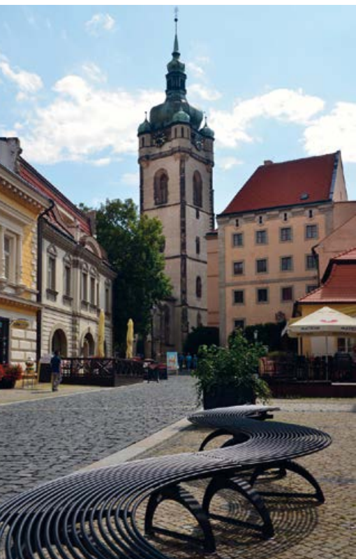
Svatováclavská ulice směrem ke Kostelu sv. Petra a Pavla a k zámku

městem až Karel IV., který sem dal přivést z Burgundska a Champagne vinnou révu a založil zde vinařství. Hospodářsky Mělník prosperoval za vlády Jiřího z Poděbrad, naopak stagnoval a upadal od konce 15. století. Vinařství doznalo největšího rozmachu v období od husitských válek do třicetileté války, kdy byly rozšiřovány vinice a bohatnoucí měšťané investovali do náboženských svatostánků. Dalšího markantního rozvoje se město dočkalo až v době po vzniku první republiky, kdy byly vybudovány přístav, okresní úřad, kulturní dům, pošta, kanalizace a provedena