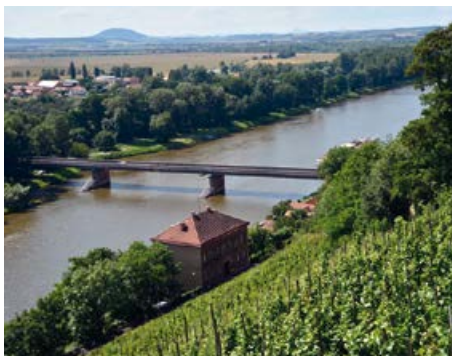
Vinice pod zámekem, mosty přes Labe, na obzoru Říp a České středohoří

otavským mostem a Zvíkovským vltavským mostem na silnici II/121, železničním mostem na trati Tábor – Ražice a Podolským mostem na silnici I/29. Vodní nádrž Orlík patří k nejvyhledávanějším turistickým a rekreačním oblastem. Většina rekreačních zařízení se nachází na pravém břehu. Vedle energetického a rekreačního využití je hlavním posláním přehrady funkce regulační, což se ověřilo při povodních v roce 2002 a 2006, kdy dokázala zadržet nepředstavitelné množství vody, a prodloužit tak čas pro realizaci protipovodňových opatření v Praze. Naopak při extrémním suchu v létě 2015 byl díky upouštění vody z nádrže pokles hladiny Vltavy v Praze téměř nezatelný. Fenomémem vodní nádrže Orlík jsou rybáři, jejichž loďky, sezení a přístřešky potkáte „na každém kroku“. Mezi nejhojněji se vyskytující a chytané ryby druhy patří kapr, štika, sumec, lín a okoun. Orlická přehrada neblaze proslula i díky tzv. orlickým vraždám. Chlubit se jistě nemůže ani skutečností, že kvůli ní bylo zatopeno deset obcí a osad s celkovým počtem 650 obytných a hospodářských staveb, se 14 mlýny a s velkým množstvím pil.