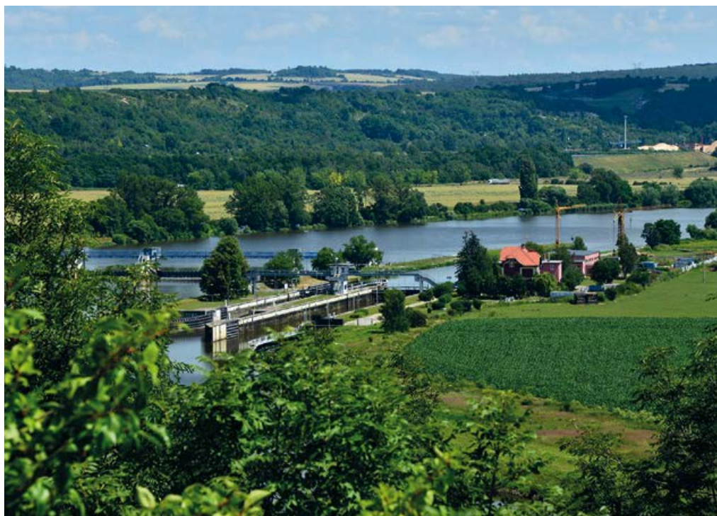
Pohled proti proudu a na zdymadlo Štětí

působí řada menších firem. V době „největší slávy“ zaměstnávaly papírny 3 600 zaměstnanců, tedy téměř polovinu obyvatel města. Nejvýznamnějšími kulturními pamětihodnostmi města jsou kostel sv. Šimona a Judy, socha sv. Jana Nepomuckého, farní budova, sousoší T. G. Masaryka a Eduarda Beneše. Nesmím zapomenout na příznivce vodáckého sportu, pro které je pojmem veslařský a vodácký areál v Račicích. Jeho dráha vznikla na místě bývalé pískovny v roce 1986. Celková délka vodního kanálu je 2 350 m, šířka hlavního kanálu 130 m. Kanál umožňuje pořádání závodů až na 200 m. Kromě hlavního kanálu disponuje areál o celkové rozloze 73 ha ještě kanálem