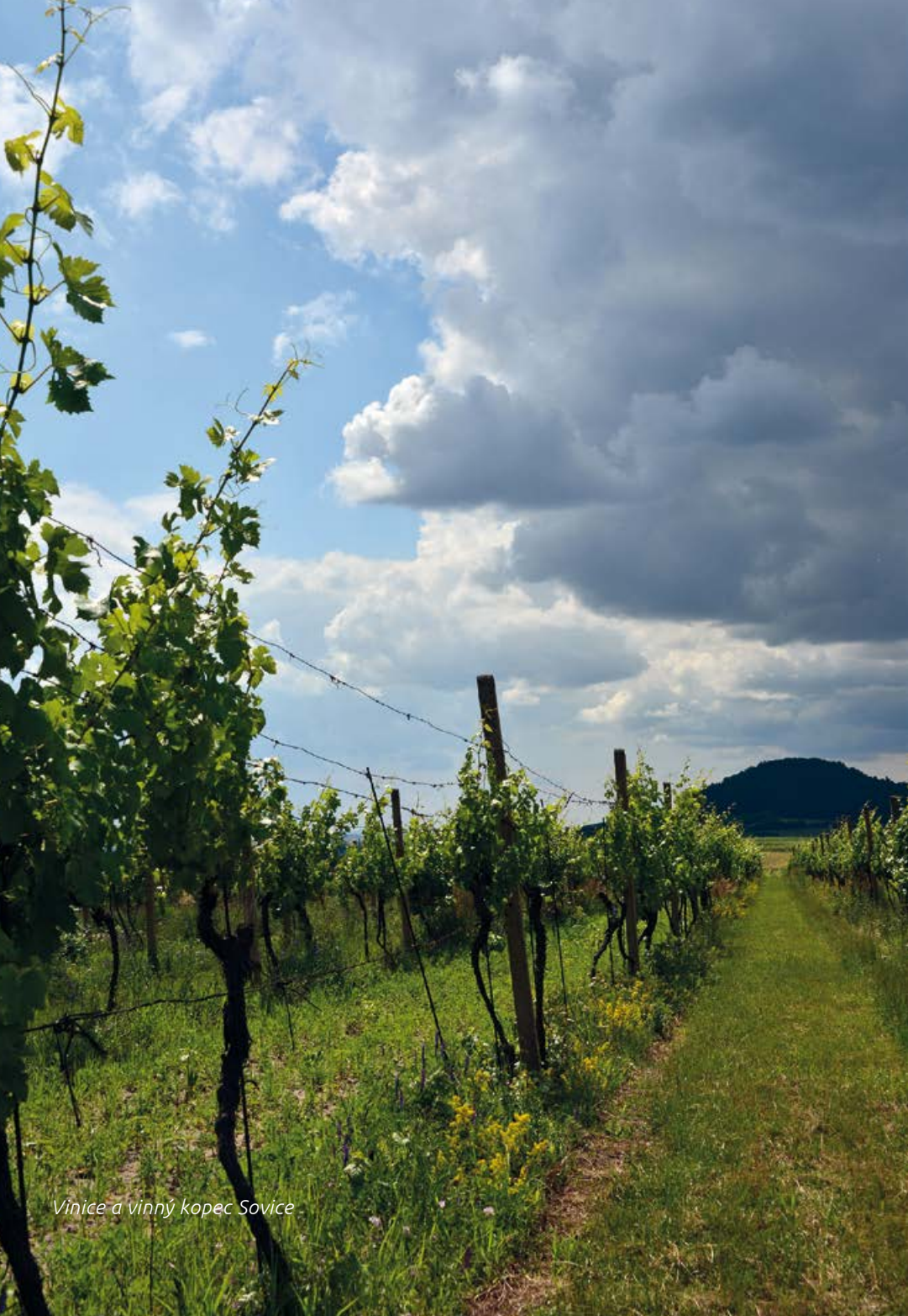
Vinice a vinný kopec Sovice