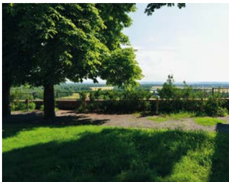
Vyhlídková plošina před Kostelem sv. Petra a Pavla