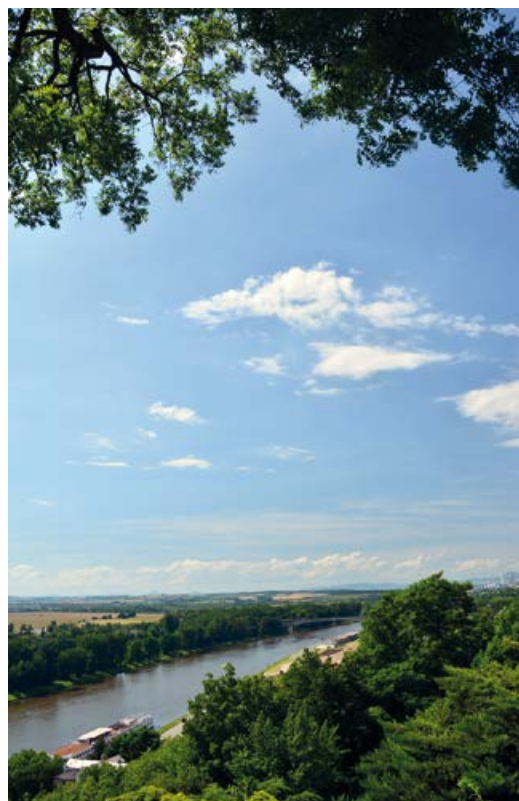
Tok Labe ze zámeckých vyhlídek směrem ke Štětí