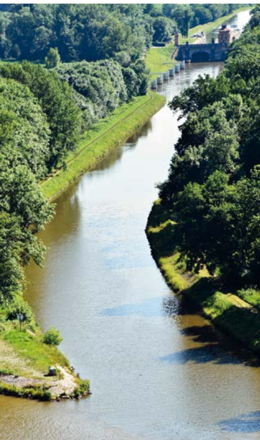
Kousek proti proudu Vltavy před soutokem s Labem