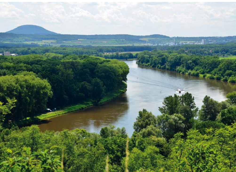
Pohled po proudu Labe a na horu Říp

Město Štětí, které leží na silnici I/9 a II/261 mezi Mělníkem a Litoměřicemi, 50 km severně od Prahy a 16 km od Mělníka, je známé největšími papírnami v České republice. Na město, papírnu a Labe se nabízí ještě jedna vyhlídka, kterou však podrobněji zmiňovat nebudu – je jí 281 metr vysoký kopec Špičák. Název města pochází s největší pravděpodobností od slova štít, resp. zástita, a je uváděn v historických