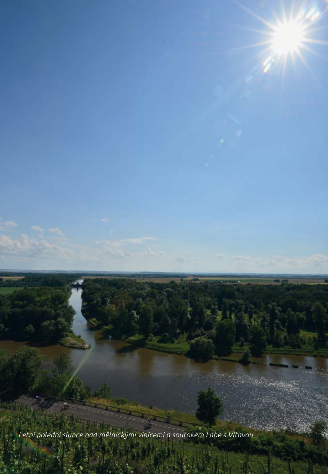
Letní polední slunce nad mělnickými vinicemi a soutokem Labe s Vltavou