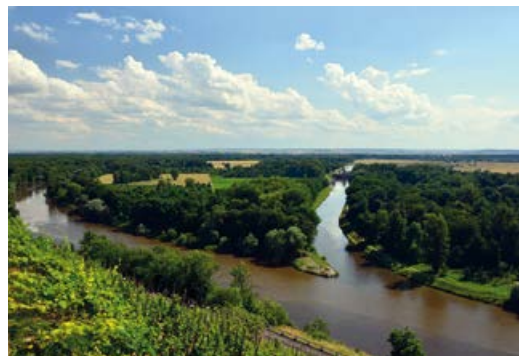
Přírodní rezervace Úpor-Černínovsko mezi Vltavou a Labem