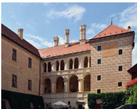
Severní křídlo mělnického zámku

Přírodní rezervace Úpor-Černínovsko je s rozlohou 877 ha od roku 2014 chráněným územím. Předmětem ochrany jsou evropsky významné lokality s výskytem zachovalých lužních lesů, slepých labských ramen a vlhkých nivních luk s výskytem chráněných druhů rostlin a živočichů.