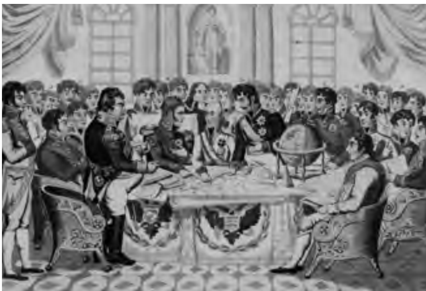
Soudobá karikatura kongresových jednání ve Vídni.

V průběhu dalších jednání ustoupilo Prusko nakonec od svého maximalistického požadavku. Na rozhodujícím zasedání zástupců velmocí 28. ledna přistoupila pruská delegace na zachování saského království s tím, že Prusko získá jen asi třetinu Saska a obdrží další územní kompenzace na levém břehu Rýna. Na kompromis v polské záležitosti přistoupil i car Alexandr. Dosáhl toho, že mu Prusové postoupili Varšavu s kusem polského území, kde žilo přes tři miliony Poláků. Rusko se tak zmocnilo celého území někdejšího Varšavského knížectví v rozloze 101 tisíc čtverečních kilometrů, které roku 1807 založil Napoleon. Když k tomu převzal od Prusů další kus polského teritoria, vytvořil obnovené Království polské pod ruskou suverenitou o celkové rozloze 127 tisíc kilometrů čtverečních. Prušákům zůstalo pouze Poznaňsko a západní Prusy s důležitými městy Gdaňsk