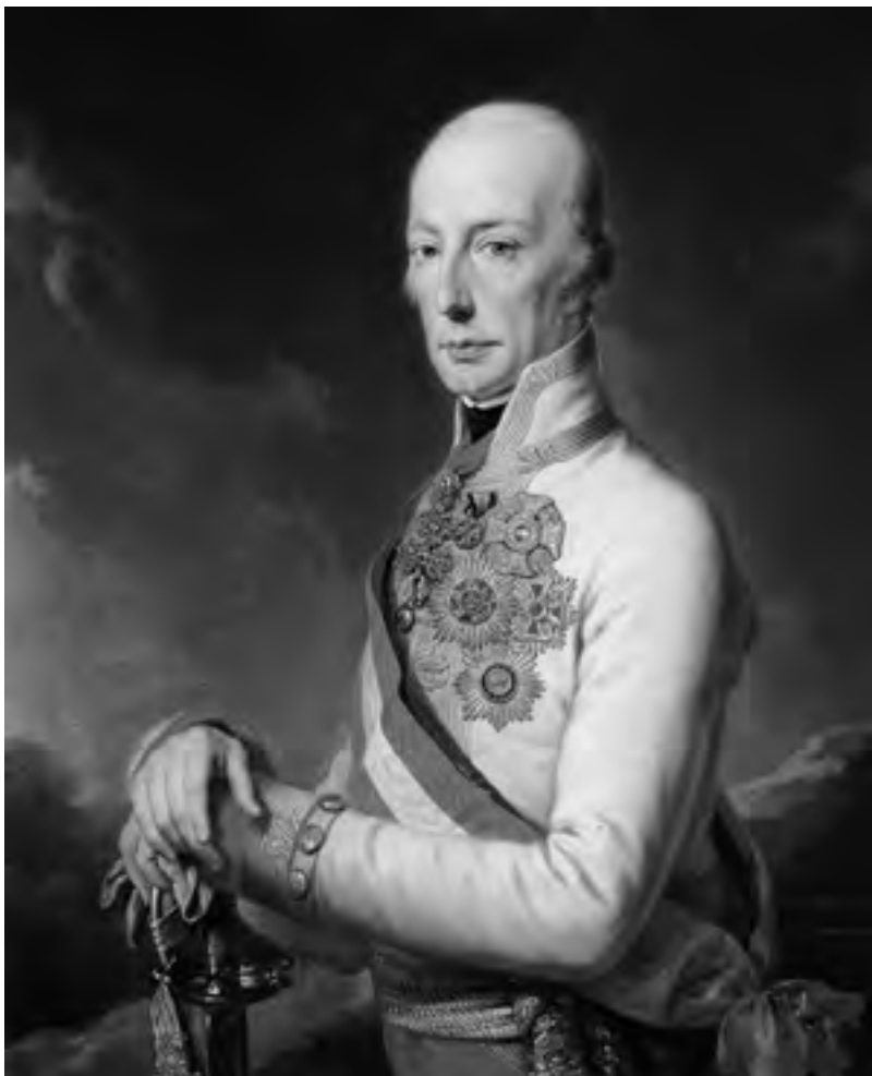
Rakouský císař František I. (1768–1835).

kníže Karl August Hardenberg provázený ministrem kultu a vyučování Wilhelmem von Humboldtem. Ruskou delegaci zastupovali dva carovi zplnomocněnci, Němec Karl Robert hrabě Nesselrode a Řek hrabě Joannis Kapodistrias, mezi něž car rozdělil záležitosti ruské zahraniční politiky. Zájmy své země zde ale nakonec hájil energicky osobně sám car Alexandr I. Dal tak jasně najevo, že na kongresu je rozhodnut hrát roli svého vlastního ministra zahraničí. Generálním