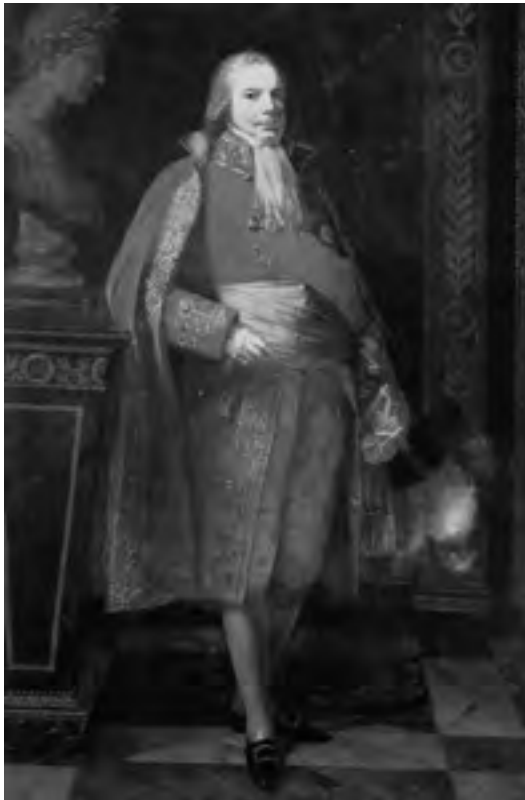
Kníže Charles Maurice de Talleyrand, zástupce Francie na kongresu (1754–1838).

mocnosti, pak jsem tu zbytečný.“ Nastalého ohromení přítomných diplomatů využil a rázem obrátil situaci poraženého v rovnocenného partnera. Vzápětí pokračoval z pozic síly: „Ostatně, kdybych zde nebyl, jistě bych vám chyběl. Jsem asi jediný, který nic nežádá... Úcta a uznání to je to jediné, co chci pro Francii. Opakuji, nechci nic a