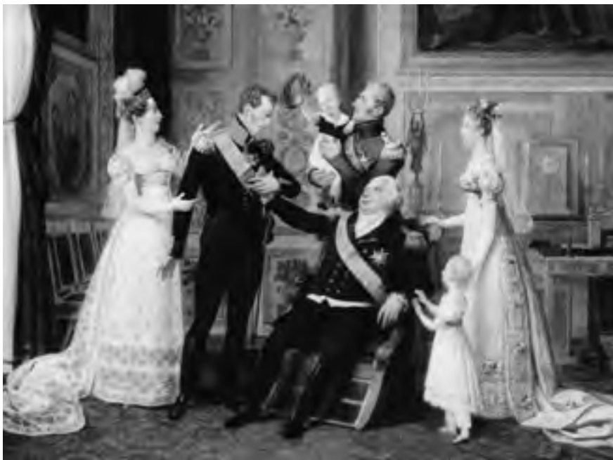
Král Ludvík XVIII. (1755–1824) uprostřed své bourbonské rodiny.

Napoleon přešel do protiofenzívy ve snaze předběhnout své protivníky dříve, než budou schopni nasadit do boje všechny síly. Doslova vydupal ze země novou armádu a vstoupil s ní na území Belgie. Tady se střetl s britsko-nizozemskou armádou pod velením maršála Wellingtona a pruskou armádou maršála Blüchera. Dne 18. června 1815 skončilo Napoleonovo poslední velké dobrodružství jeho porážkou na pláních u Waterloo. Padlo jeho „Stodenní císařství“ a bitva u Waterloo, svedená před branami Bruselu, se stala poslední krvavou tečkou napoleonských válek. Poražený Napoleon byl zajat a dopraven do nuceného exilu na Ostrov svaté Heleny uprostřed Atlantického