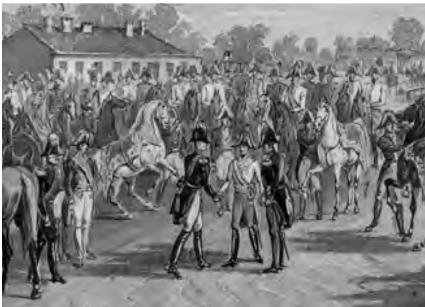
Příjezd a uvítání spojeneckých panovníků rakouským císařem před Vídní.

hlav. Sami panovníci přijížděli v následujících dnech. Dánský král spolu s králem württemberským se zde objevili 24. září a bavorský král o den později. Slavnostní vjezd ruského cara a pruského krále se konal odpoledne 25. září. Každému z panovníků vyjel vstříc na půlhodiny cesty před město osobně sám rakouský císař František. Vlastní jednání sice začalo probíhat v kuloárech i v komisích téměř