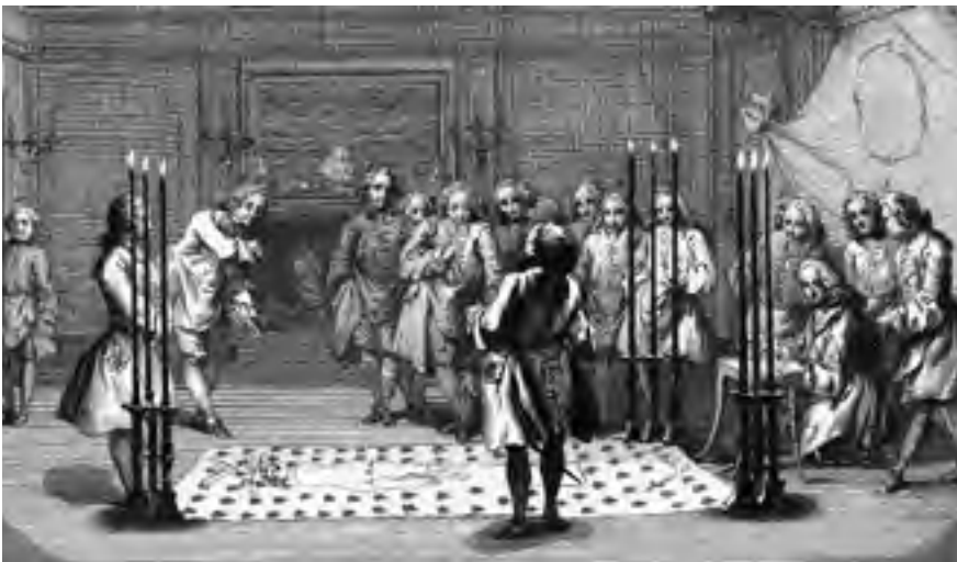
Výjev z práce zednářských lóží na konci 18. století.

světoobčanství a ušlechtilé myšlení. Zednářství bylo produktem osvícenského myšlení a stalo se také jedním z instrumentů, které uváděly osvícenské myšlenky do praxe. Tento kosmopolitní řád filozofické a filantropické povahy se vyznačoval úctou k svobodě jednotlivce, k vzdělání jako prostředku šíření pokroku a v prosazování náboženské tolerance. Věřil v lidskou vzájemnost, v morální zdokonalování člověka, s nímž musel začít každý z členů sám u sebe a působit v tomto směru na své okolí. Své humanitární poslání plnil budováním špitálů, sirotčinců, starobinců a jiných charitativních organizací, podporou školství, zakládáním vědeckých akademií, debatických salonů a jím podobných institucí. Plnil v zásadě úkoly morální a výchovné povahy. Bojoval proti nesvobodě v jakékoli formě, a proto si vysloužil nepřátelský postoj ze strany katolické církve i většiny panovnických dvorů. Byl také z jejich strany pronásledován. Přesto se zednářství šířilo a stalo se v druhé polovině 18. století velkou módou mezi vzdělanci z řad měšťanstva a šlechty. V zednářských lóžích praktikovali náboženskou toleranci. Scházeli se tu bez rozdílu katolíci i protestanti, mezi nimi přes papežské zákazy četné osoby duchovního stavu, v pozdějších letech přijímali mezi sebe i Židy. V zednářství se sice objevovaly různé směry, některé dokonce se sklonem k okultním a