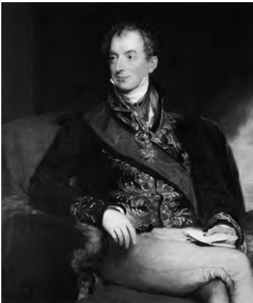
Kníže Klemens Václav Lotar Metternich, rakouský ministr a od roku 1821 státní kancléř (1773–1859).

přistoupit na bezpodmínečnou kapitulaci a podat demisi. Rezignoval ve prospěch svého syna Napoleona II. Dne 20. dubna se na nádvoří zámku ve Fontainebleau rozloučil s vojáky své staré gardy. Oslovil je: „Mé děti! Rád bych vás všechny přitiskl k srdci, dovolte, abych objal alespoň váš prapor.“ Byla to chvíle plná emocí. Z očí nejednoho