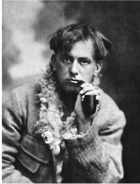
Obr. 1.3. Aleister Crowley, průzkumník

(tedy je svobodomyšlný, volnomyšlenkář, umělec a estét). Názory lidí na tohoto muže se různí. Některé fascinuje, jiné odpuzuje. Některé fascinuje i odpuzuje zároveň. Je umělcem „z vášně“, působivý pro básníky a dámy, revolucionáře i kavářenské povaleče. Radí. Chce druhým pomoci k úspěchu. Píše knihy. Zná svět a umí se v něm pohybovat. Vypadá neohroženě. Je ho však možné brát vážně? Mohl by to jen hrát. Je v něm kus revolucionáře, ale o jakou revoluci jde?