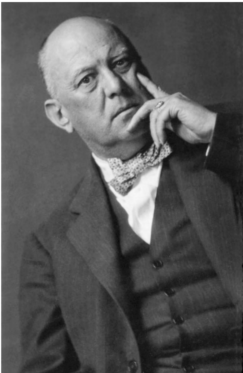
Obr. 1.1. Aleister Crowley, 1929.