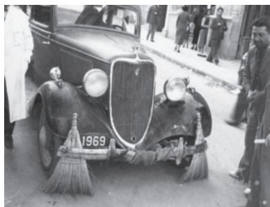
Pronásledující auto, které při pronásledování couvá, přičemž za sebou zametá stopy.

Zatímco Roman Janoušek má luxusní výjezdní doložku (pro ty, kteří to nezažili: to byl téměř nedosažitelný papír dovolující majiteli na tři týdny opustit socialistický ráj a podívat se do prohnilé ciziny), další Roman je na útěku a téměř jde po něm už Interpol, protože byl právoplatně odsouzen Langerovou rodinou. Doufám, že ho URNA dopadne a že opět uvidíme ve zprávách stokrát opakované záběry, jak umí rozmlátit dveře.