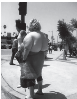
Výsledek úspěšné plastické operace: transpozice věhlasného zadečku