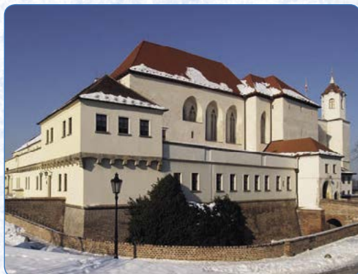
▲ Brněnský Špilberk