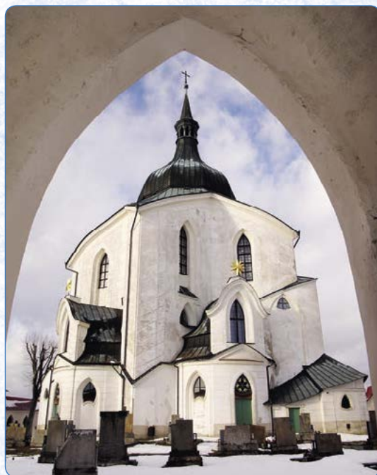
▲ Poutní kostel sv. Jana Nepomuckého na Zelené hoře