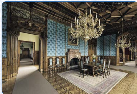
▲ Jeden z reprezentačních sálů na zámku Lednice