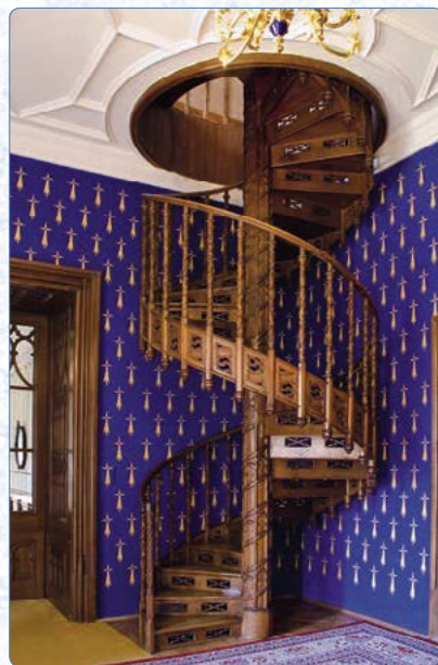
▲ Unikátní schodiště na zámku Sychrov

Když se zima vydaří, můžete si na slepých ramenech řeky Dyje v zámeckém parku zabruslit, od listopadu do března se také můžete zahřát při vyhlídkových plavbách se svařeným vínem. Lodě vyplouvají od přístaviště pod zámek o víkendech a svátcích od 10 do 15 hodin v půlhodinových intervalech, podrobnější informace najdete v kapitole Zimní plavby, mikulášské vlaky a jízdy s čerty .