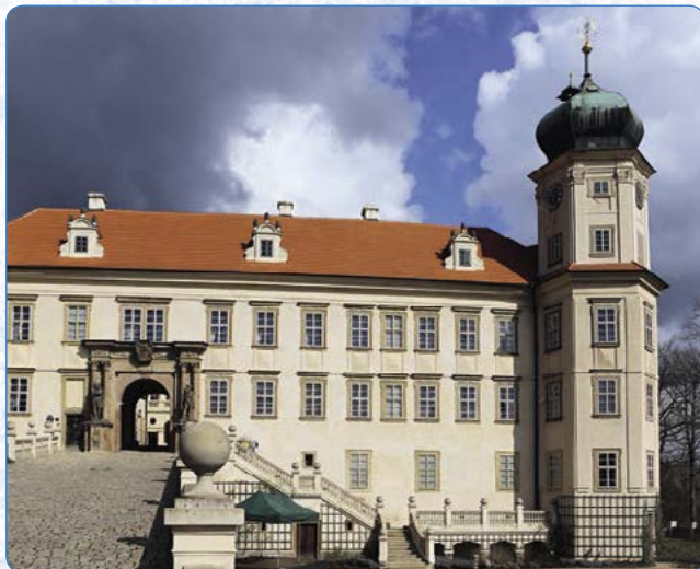
▲ Mníšek pod Brdy