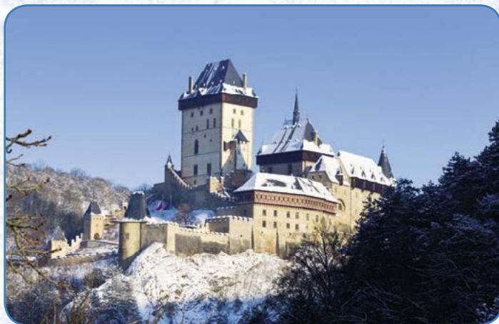
▲ I v zimě si můžete prohlédnout na Karlštejně kopii svatováclavské koruny

Zimní otevírací doba platí od poloviny listopadu, otevřeno bývá každý víkend až do Vánoc. Koncem prosince a začátkem ledna hrad nabízí speciální adventní a vánoční prohlídky. Po zbytek ledna bývá zavřeno, v únoru se tam můžete opět přijet podívat o víkendech a od začátku března pak začíná běžný sezonní provoz. Rezervace na zimní prohlídky není nutná.