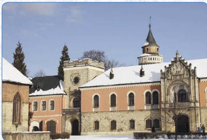
▲ Zámek Sychrov znají děti z filmových pohádek