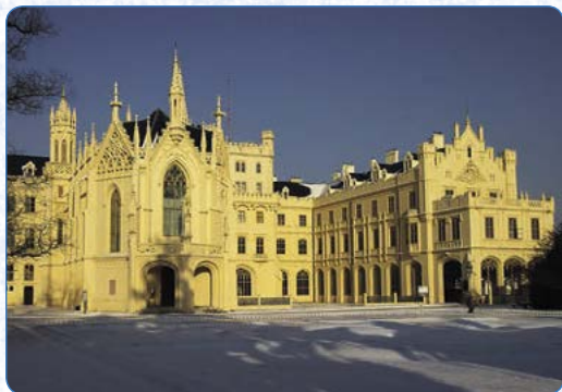
▲ Kromě zámku si prohlédnete i Lednicko-valtický areál, který je zapsán na seznam UNESCO