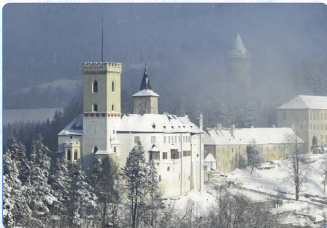
▲ Třeba na Rožmberku potkáte bílou paní...

Hrad je otevřený od listopadu do března denně kromě pondělí, ve všedních dnech vždy v 11 a ve 13 hodin, o víkendech prohlídky začínají v 10 hodin, poslední skupina vychází v 15 hodin. Část zimy bývá hrad zavřený, a to zhruba od poloviny prosince do začátku ledna.