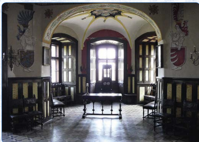
▲ Na zámku Radim se dochovalo mnoho dobových detailů

Zámek v Radimi je přesně takový, jaký byste od renesančního zámku čekali: bílý, půvabný a plný zajímavostí. Ačkoli v roce 2010 oslavil čtyři sta let existence, prohlídka se nese v duchu, jako by právě včera zedníci rozebrali lešení a hradní pán převzal klíče od zbrusu nového sídla. Zámek měl veliké štěstí: nikdy nevyhořel a nikdy nebyl přebudován