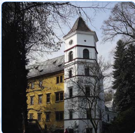
▲ Zámek Radim

v jiném slohu, takže v interiérech například můžete obdivovat původní malované trámové stropy s listy, květinami a pestrými paletami kompozic. V Radimi se dochovalo překvapivě množství dobových detailů, navíc současní majitelé se snaží interiéry vybavit renesančními a barokními kousky, takže tady opravdu budete stát tváří v tvář venkovskému sídlu drobné šlechty – přesně takovému, jak mohlo vypadat na začátku 17. století, s unikátní atmosférou a řadou tajemných koutků. Reprezentační sály a místnosti určené k bydlení panstva doplňuje technické zázemí, sklepení a přízemí s černou a bílou kuchyní. Prohlédnete si také strážnici, místnosti pro čeládku a vězení.