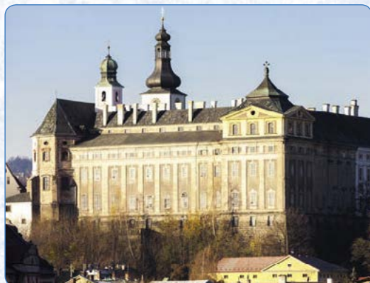
▲ Benediktinský klášter v Broumově