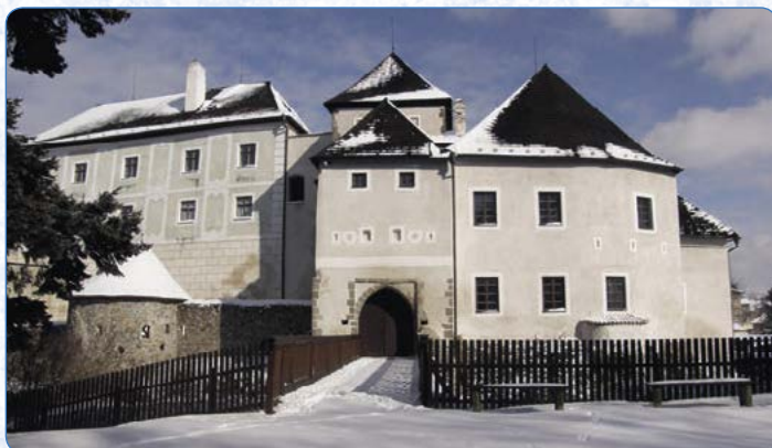
▲ Zimní pohled na Nové Hradky.

historických skleněných předmětů včetně výrobků z černého skla, takzvaného hyalitu, a do paláce, který byl v 19. století adaptován na byty pro panské zaměstnance. Nahlédnete tu do bytu „pana správce“, lépe řečeno do měšťanské domácnosti na počátku 20. století. Zimní prohlídky se konají v předem určených termínech.