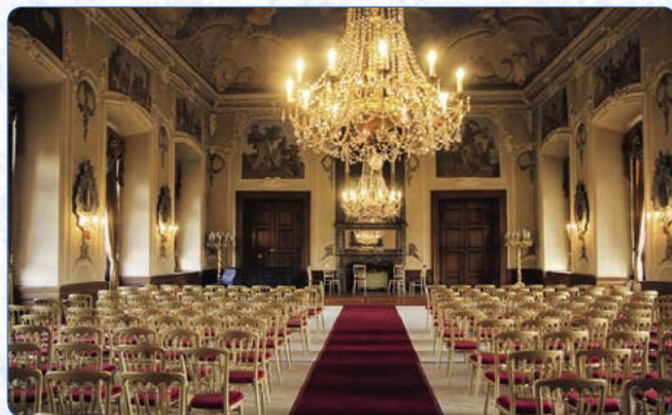
▲ Jeden z překrásných sálů na zámku Dobříš

Rokokový zámek s mansardovými střechami a výraznou barevnou fasádou patří Colloredo-Mansfeldům a otevřeno je tu celý rok, v zimních měsících denně kromě pondělí. Prohlídkový okruh je v létě i v zimě stejný a nabízí přehlídku pokojů ve stylu rokoka a klasicismu. Zámeckou