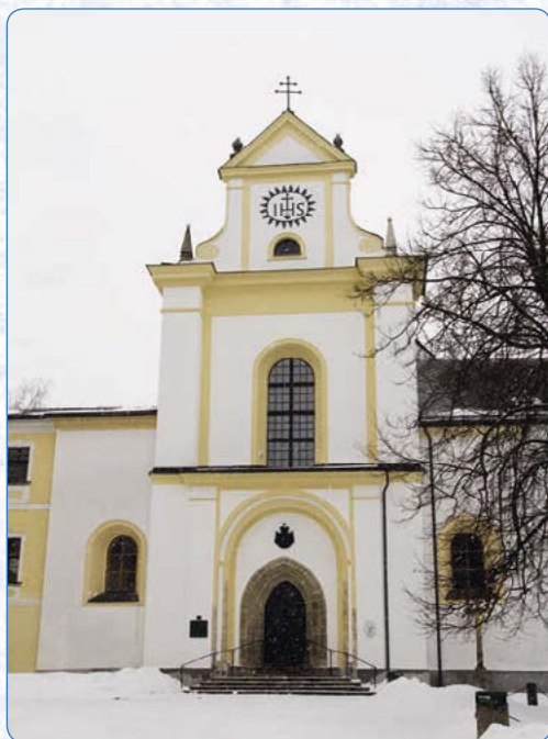
▲ V prostorách zámku naleznete i kostel Nanebevzetí Panny Marie a sv. Mikuláše