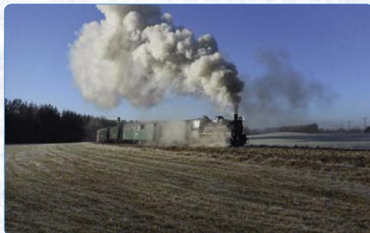
▲ K zimním lákadlům jindřichohradeckých úzkokolejek patří mikulášská jízda parním vlakem.