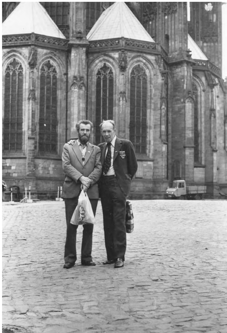
Se Sergejem Baruzdinem v Praze, 1978