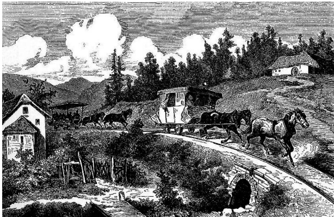
Obrázek 1.1: Osobní doprava na koněspřežné železnici

Počátky koněspřežné železnice sahají na počátek 19. století. Předcházely jí úvahy o stavbě plavebního kanálu spojením řek Vltavy a Dunaje, pomocí kterého by se dopravovala vytěžená sůl z Horních Rakous do Českých zemí. Vodnímu spojení mezi Dunajem a Vltavou však bránily pohraniční hory. Stavba plavebního kanálu byla po důkladném prozkoumání terénu zavržena, následně byl předložen koncept možného spojení koněspřežnou železnici (Schreier, 2009). V roce 1824 získala privilegium na stavbu firma C.k. první privilegovaná železniční společnost, v níž zastával pozici stavbyvedoucího František Antonín Gerstner, syn Františka Josefa Gerstnera, otce myšlenky koněspřežné železnice. Samotná výstavba železnice byla zahájena v roce 1825. V roce 1832 byla dokončena a zprovozněna celá trať z Českých Budějovic do Lince. Konešpřežná železnice byla ryze komerční tratí, určenou zejména pro přepravu soli a zboží. Od roku 1836 začal na trati i provoz osobních vlaků, přičemž nákladní vlaky jezdily celoročně a osobní pouze od dubna do října (viz obrázek 1.1). Jízda z Českých Budějovic do Lince tehdy trvala čtrnáct hodin (Bubeník, 2012).