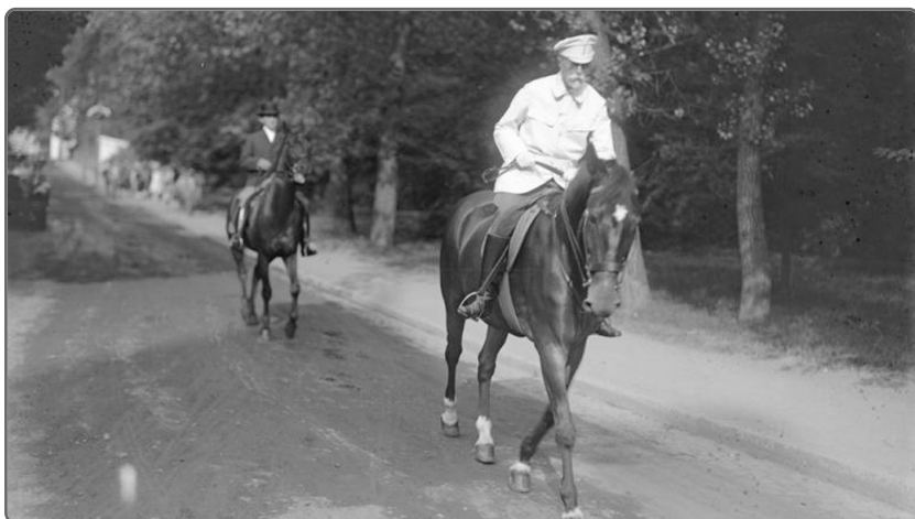
T. G. Masaryk s oblibou jezdil na koni. Projížďky byly pro něj nejen sportovním vyžitím, ale i jedním ze způsobů relaxace.

cítil obrovskou odpovědnost a byl k sobě i svým spolupracovníkům dost náročný. Jako intelektuál měl rád lidi se samostatným kritickým myšlením a uvažováním, poklonkování, papouškování cizích názorů a zbytečné a plané řeči „o ničem“ nesnášel. Povahovým založením byl spíše introvert, často mlčel, a než vyslovil vlastní úsudek, raději naslouchal jiným.