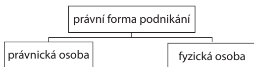
Obrázek 1.1 Právní formy podnikání

Ze začátku byste se měli rozhodnout, jakým způsobem budete svoji podnikatelskou činnost evidovat a jakým způsobem budete vystupovat při jednání s úřady i se svým okolím. Z hlediska právní formy podnikání máte dvě možnosti: stát se fyzickou nebo právnickou osobou. Oba termíny se hodně vyskytují v zákonech ČR, které souvisí s podnikáním.