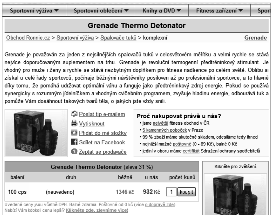
Obrázek 1.8 Popisek zboží na e-shopu