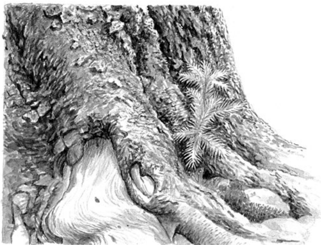
Semenáčky jedlí, smrků nebo buků se drží máminy sukně. Potřebují ochranu a výchovu svých rodičů.

Stromy jsou tedy bytosti s velmi rozváznou povahou, kterým je každý spěch cizí.