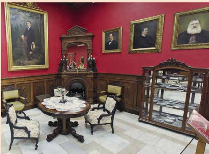
▲ K cenným výstavám zámockého múzea patrí výstava nábytku mešťanov a nižšej šľachty z podtatranského regiónu