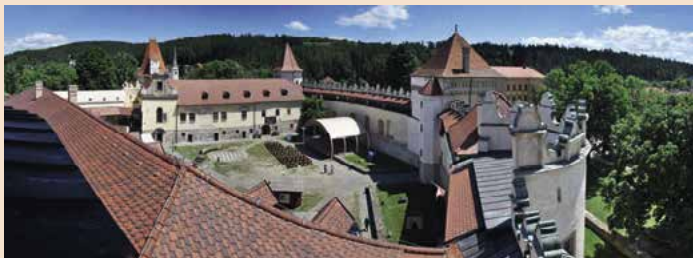
▲ Výstavné sieni mestského hradu v Kežmarku sú umiestnené vo vežiach, po ktorých sa prechádza po vnútornej pavlačí.

dospelí: 3 €; deti do 15 rokov 1 €; študenti nad 15 rokov 1,50 €; dôchodcovia: 2,00 €