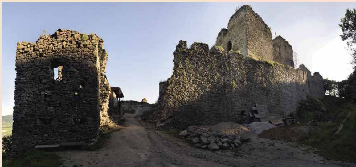
▲ Aj tento hrad bude čoskoro krajšie vyzerať, keď na ňom postúpia konzervačné práce.