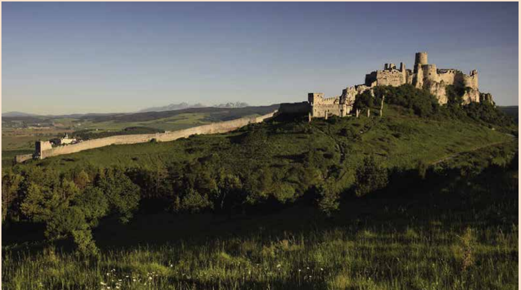
▲ Najväčší slovenský hrad je dobre vidieť už z ďaleka.