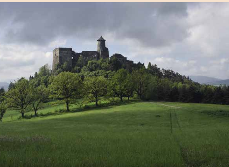
▲ Ľubovniansky hrad.

Súčasný výzor hradu a jeho poloha je veľmi atraktívna, preto je veľmi vyhľadávaným miestom aj pre turistov z blízkeho Poľska. Pri vstupe na hrad sa môžete