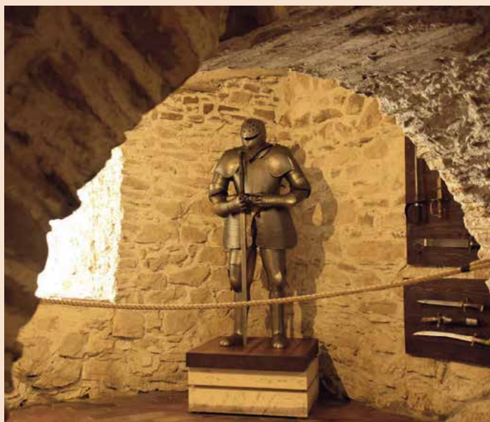
▲ Spišský hrad okrem svojej mohutnosti prekvapí návštevníkov výstavami rytierskeho brnenia, stredovekej bylinkárne a mučiacich nástrojov.