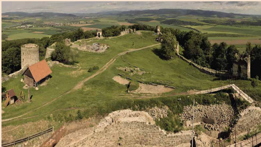
▲ Stredoveké sídlo župy je stále dobre obklopené zachovanými vežami.

zrúcanina hradu dobre zachovala. Podobne, ako aj na iných hradoch v tomto kraji prebieha jeho záchrana. Keď už budete na hrade, nezapudnite navštíviť donjon – hlavnú vežu v strede nádvorja, z ktorej sa vám naskytne výhľad do širokého okolia.