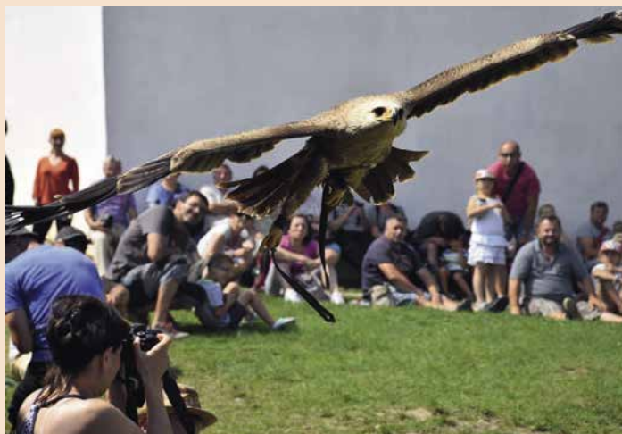
▲ Na Ľubovnianskom hrade sa pravidelne uskutočňujú sokoliarske vystúpenia, ktoré sú v cene vstupenky.

Prvá písomná zmienka gotického hradu sa datuje do prvej polovice 14. storočia. Jeho vlastníkom bol kráľ, ale v správe ho mali mocní páni východného Slovenska, Omodejovci. Vyše sto rokov pohraničný hrad strážil obchodnú cestu do Poľska. Prelomový bol rok 1412. Práve vtedy sa tu stretol poľský kráľ Vladimír II. a uhorský kráľ Žigmund Luxemburský, aby podpísali medzi krajinami mier. Ešte v ten rok však Žigmund chcel viesť vojnu proti inej krajine, no jeho pokladnica bola prázdna. Požičal si zlato od poľského kráľa, za čo mu Žigmund založil trinásť spišských miest spolu s panstvom