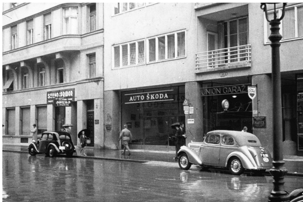
Union Garaža: prodejna automobilů Škoda v chorvatském Záhřebu