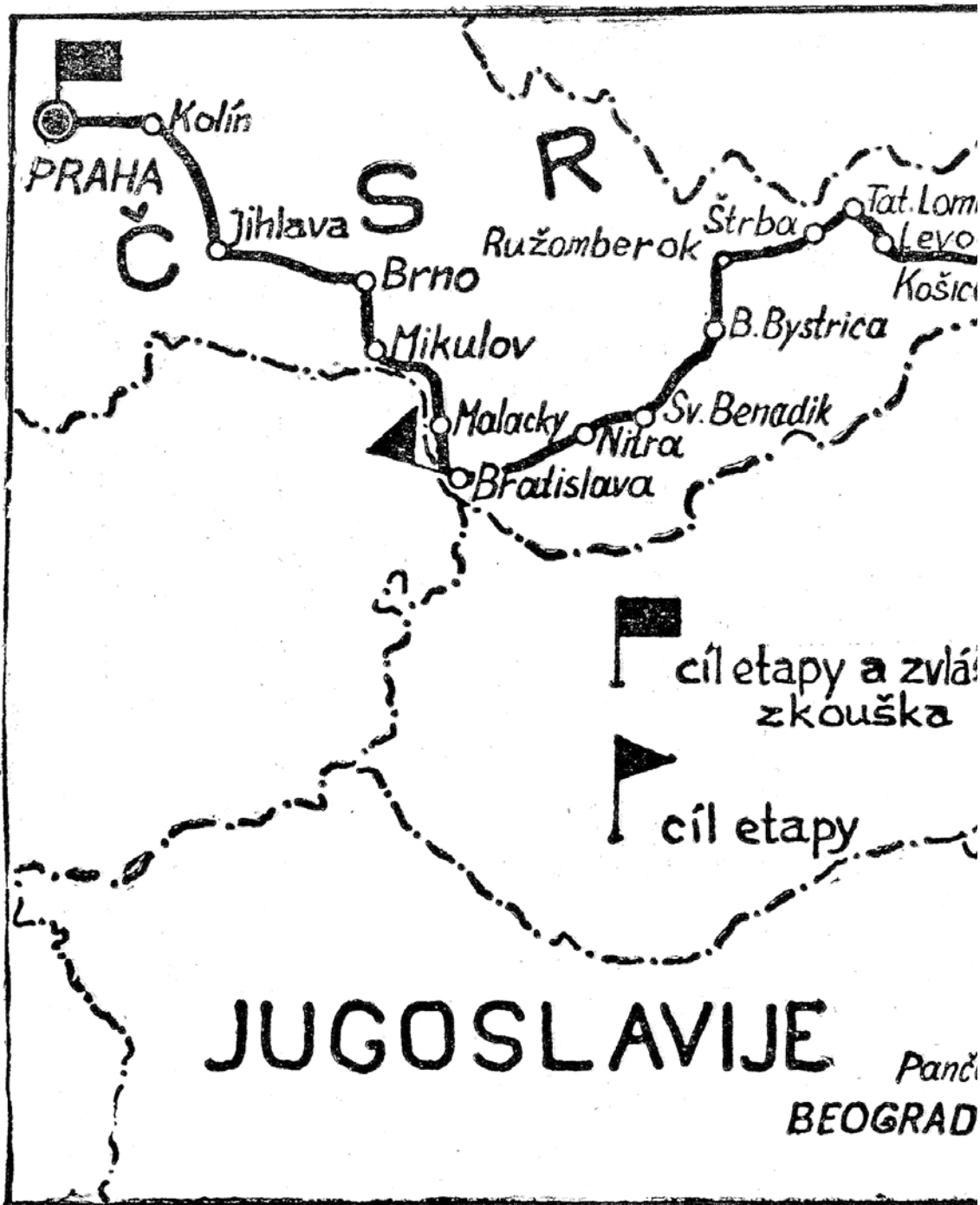
Trasa přes 2400 km dlouhé soutěže vedla přes Podkarpatskou Rus