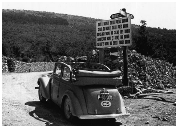
Elstnerův polokabriolet Rapid na cestě od chorvatského pobřeží do hor