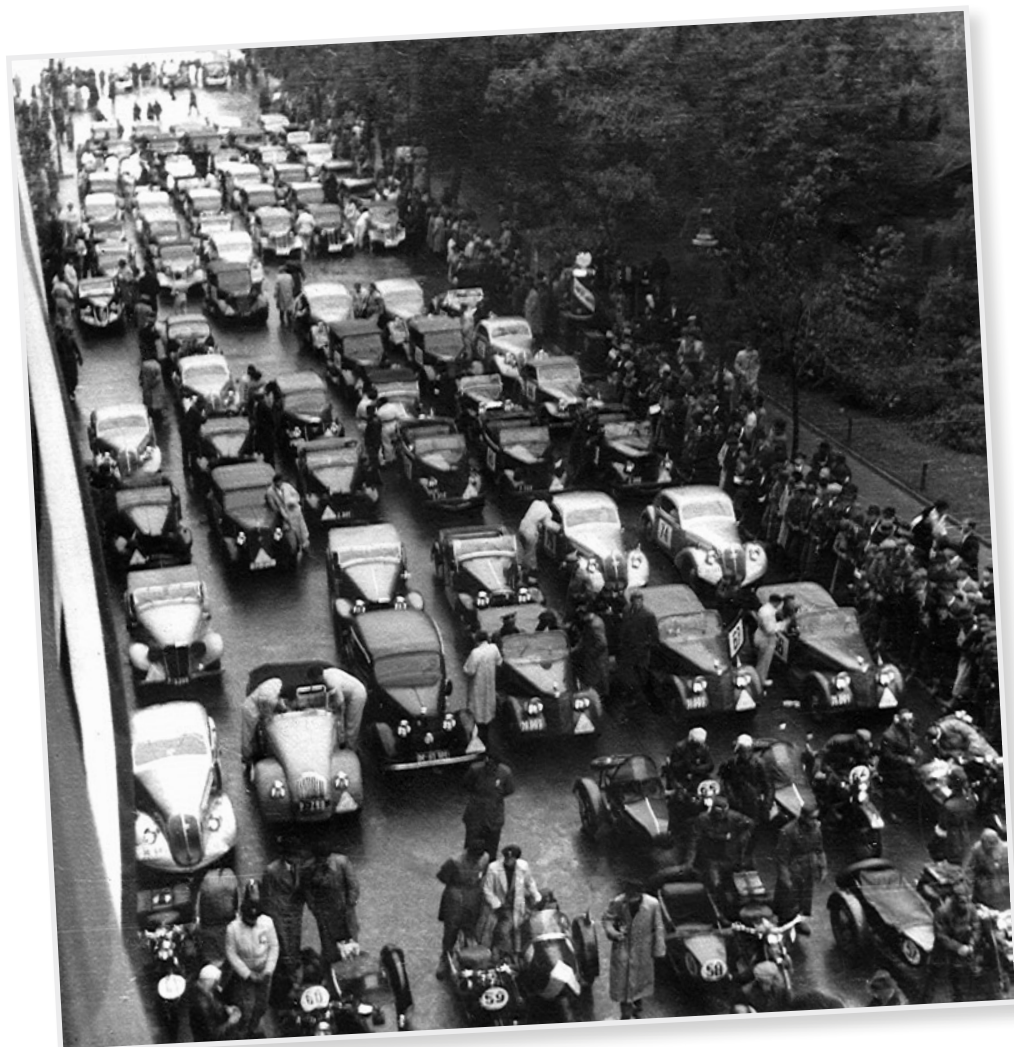
Tlačeničky před startem soutěže před pražským sídlem Autoklubu RČs.