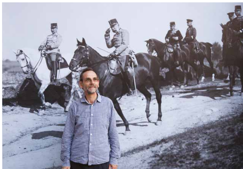
Stylizovaný portrét autora vytvořený jako humorná nadsázka