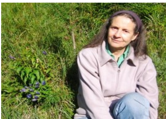
Posezení u hořce tolitovitého