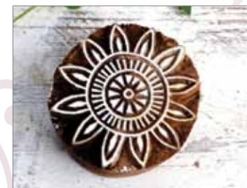
Ručně vyřezávaná razítka z indických manufaktur pro scrapbooking, tisk na textil, do keramické hlíny, sladkého těsta / www.fler.cz/drevena-razitka