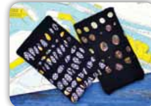
PRAKTICKÝ OBAL NA VÁŠ TABLET ZE DVOU PONOŽEK