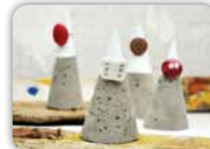
KUŽELOVÉ STOJÁNKY NA PRSTENY Z BETONU