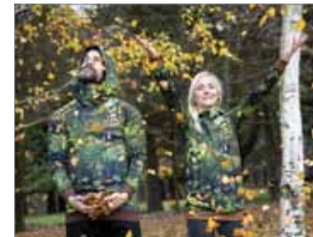
Oděvy s originálními potisky podle autorských grafických návrhů a ilustrací – Aidastyle / www.fler.cz/aidastyle