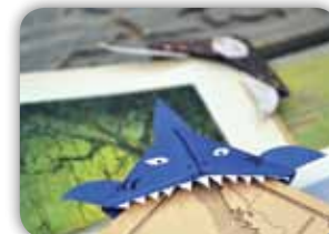
ROHOVÉ ORIGAMI ZÁLOŽKY PRO MALÉ I VELKÉ ČTENÁŘE