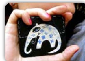
MALOVANÁ BROŽ 29 Z BALZOVÉHO DŘEVA