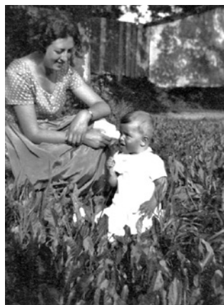
S maminkou, 1934