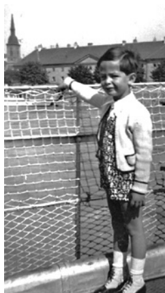
Na lodi v Bratislavě, 1936