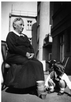
S babičkou, 1934

Zatímco v naší rodině vypadalo všechno růžově, v Evropě se politická situace změnila. V Německu se k moci dostali národní socialisti. Hitler velmi hlasitě oznámil své plány do budoucna. Netajil, že má v úmyslu nastolit v celé Evropě i ve světě národně socialistický systém, a to násilím, tedy válkou. Německo bylo velké, Československo – jeho soused – malé. Pro mnoho občanů Československé republiky to byl důvod k obavám. A ještě něco dal Hitler světu na vědomí: Chtěl vyhubit všechny Židy. A hned