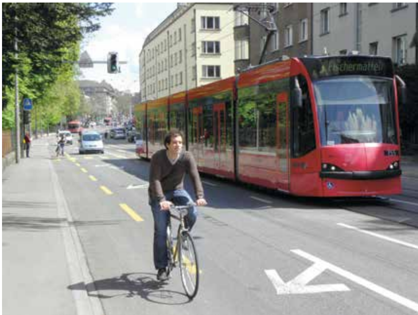
Cyklopruh ve Švýcarsku: příklad integrace cyklistické dopravy v provozu

provoz, nejsou ale dostatečně komfortní — podíl kola na dopravě tak dosahuje nizozemského průměru jen v několika málo menších městech.