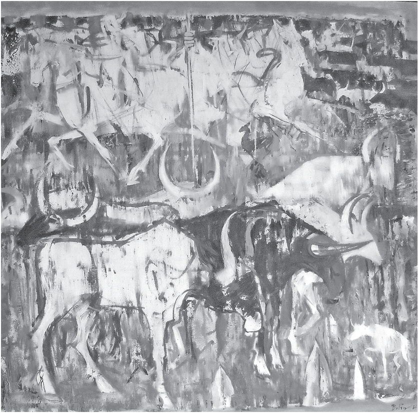
Juraj Dolán: Neolitická Libye