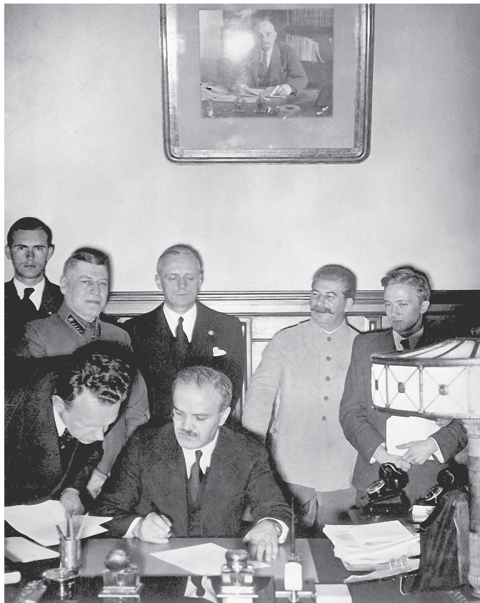
Molotov podpisuje německo-sovětský pakt

nyiní jistě odřeknou svou podporu Polsku, kdežto Italům tento pakt dodá odvahy, aby se postavili po bok Německa.