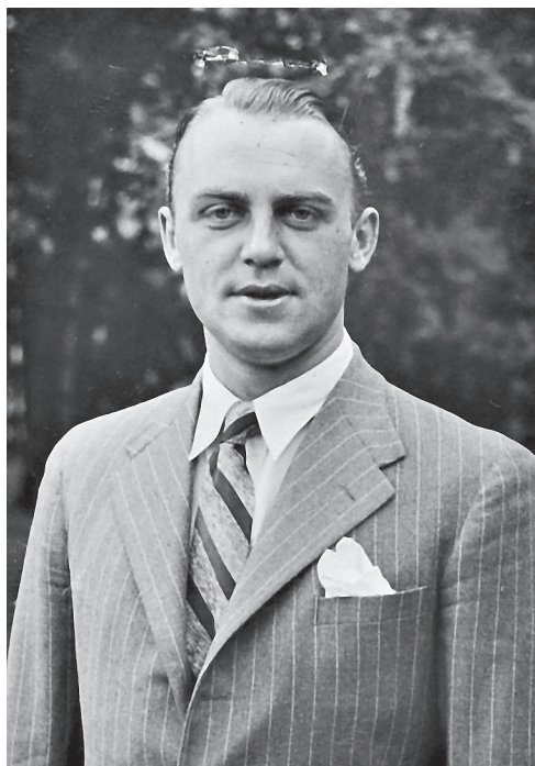
SS-sturmbannführer Alfred Naujocks