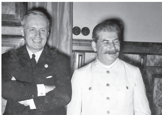
Ribbentrop se Stalinem po podpisu německo-sovětského paktu 23. 8. 1939

„Taková slova,“ řekl, „by po těch letech, co jsme na sebe navzájem vy- lévali škopíčky špíny, působila směšně.“