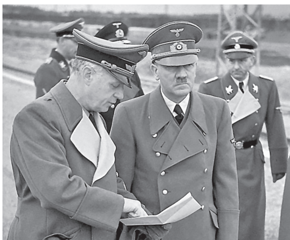
Hitler a Ribbentrop, strůjci německo-sovětského spiknutí proti Polsku

mezi nacionalismem a internacionalismem již neexistuje. 2. Neexistuje žádný reálný konflikt zájmů mezi Německem a Ruskem [...] žádný problém mezi Baltem a Černým mořem, který by nemohl být vyřešen k naprosté spokojenosti obou zemí. 3. Berlín a Moskva stojí na historické křižovatce, která rozhodne, zda po generace budou jejich vztahy mírové, či válečné. 4. Navzdory období vzájemné nedůvěry ještě stále existují „přirozené sympatie Němců k Rusům“. 5. Oba režimy spojuje skutečnost, že kapitalistické západní demokracie jsou „nesmiřitelnými nepřáteli“ jich obou. 6. Krize německo-polských vztahů nezbytně vyžaduje „rychlé vyjasnění německo-ruských vztahů“.