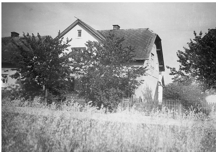
Rodný dům ve Vidnavě ve 40. letech.