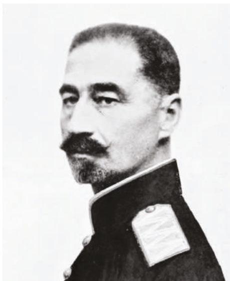
Ivan Georgijevič Erdeli

k protibolševickým silám gen. Kornilova. Z velitele divize se vypracoval až na velitele Ozbrojených sil Jižního Ruska. Po porážce „bílých“ odjel do Francie, kde také zemřel.