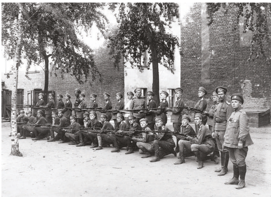
Po „únorové revoluci“ bylo zformováno i 15 čistě ženských vojenských formací, včetně několika batalionů smrti (Женские батальоны смерти)