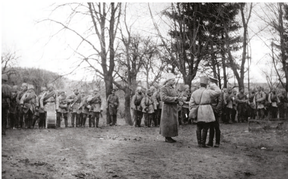
Odchod 2. roty České družiny z Okočína na frontu do Karpat, podzim 1914

Dobrovolníci České družiny měli být původně určeni jako oddíl propagátorů a agitátorů či tlumočnicků po plánovaném průlomu fronty do Českých zemí a na Slovensko. Protože takové okolnosti nenastaly, byli družiníci určeni k roli divizních nebo armádních rozvědčků, což odpovídalo jak jejich malému počtu, tak jejich inteligenci, vyspělosti a schopnostem. Družina byla rozdělena na půlroty