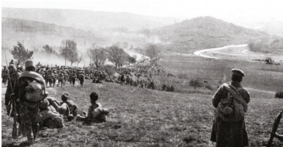
Příslušníci České družiny při ústupu ze slovenských Karpat poté, co unikli obklíčení a hrozbě popravky za vlastizrady, květen 1915