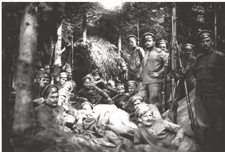
Rozvědčíci 3. roty 1. pluku při odpočinku za Brusilovovy ofenzívy v rajonu Bučac u řeky Zlatá Lípa, léto 1916

kdy ne všichni ruští velitelé na jiných úsecích bojiště byli ofenzivně nakloněni a nedokázali Brusilovova úspěchu plně využít. A ačkoliv se jednalo o jednu z největších porážek Centrálních mocností, které přišly o 617 tisíc mužů a musely místy ustoupit až o 120 km, vlastní ruské ztráty 800 tisíc mužů podnítily sílící revoluční nálady, podpořené celkovým špatným stavem carské armády a těžkým životem vojáků v poli.