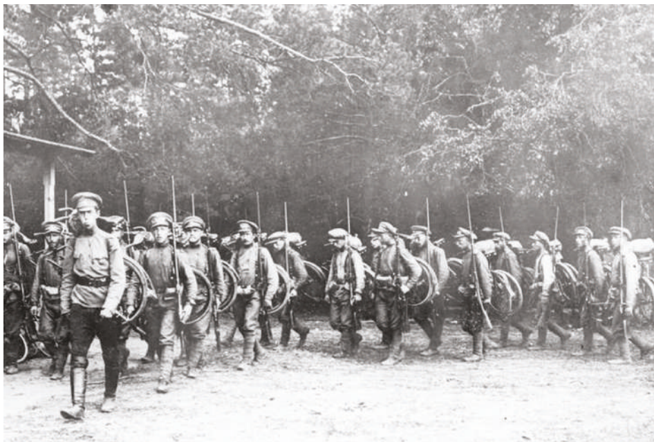
Ruský cyklistický oddíl při pochodu na frontu, červen 1917