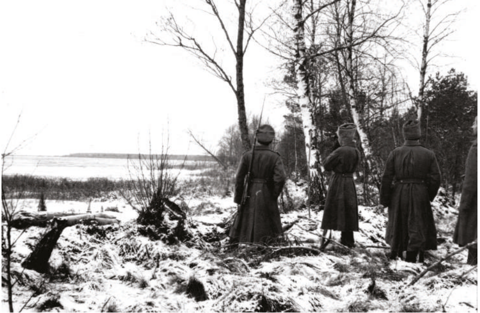
Příslušníci jedné z rot České družiny na rozvědce v Pinských bažinách, podzim 1915