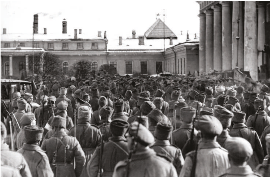
Příchod ruského vojska k sídlu petrohradského parlamentu k ochraně členů Prozatímní vlády, březen 1917

Po celé zemi začalo docházet k protestům proti válce a hladovým bouřím. Vše vyvrcholilo 3. března (18. února dle starého kalendáře) 1917, kdy došlo ke generální stávce dělníků petrohradských Putilovových závodů, jedné z nejdůležitějších zbrojních továren impéria. V následujících dnech se k dělníkům přidávali protestanti, požadující odstoupení cara, ukončení války a lepší zásobování potravinami, a tak 8. března stávkovalo v Petrohradě již přes 200 tisíc lidí. Situace se stávala chaotickou, mezi lidmi se šířily různé fámy a došlo i k potyčkám s bezpečnostními silami, během kterých zemřelo několik lidí, načež došlo k útokům na státní budovy a k rabování. Po odmítnutí poslušnosti u vojenských útvarů se 15. března car Mikuláš II. vzdal koruny ve prospěch svého bratra Michaila. Ten však korunu následující den odmítl. S abdikací cara byla ustanovena Prozatímní vláda v čele s knížetem Lvovem, která se tak fakticky ujala moci. Po více jak pěti stoletích tak v Rusku skončilo samoděržaví a začal přechod k demokracii.