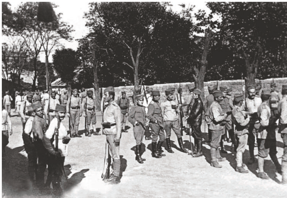
Čeští dobrovolníci v srbském vojsku během cvičení v ruské Oděse

Rozšíření počtu čs. jednotek a intenzivní bojová činnost s sebou přinesla otázku doplňování stavů novými vojáky. Část nových branců byla získána z řad již odvedených ruských Čechů, mnohem větší potenciál ale nabízely zajatecké tábory, ve kterých dlely tisíce Čechů a Slováků. Velká část z nich, ovlivněna rusofilstvím, odporem ke všemu německému, ale i politickou agitací čs. spolků, projevovala zájem o českou otázku a pomoc Rusku. Ruští političtí představitelé ale cítili k Čechům-zajatcům nedůvěru a báli se též cizího vojska na ruské půdě. Velké množství zajatců tak podávalo v zajateckých táborech přihlášky ke vstupu do čs. vojska, ale vyřízení trvalo velmi dlouho, takže někteří raději vstoupili do srbské dobrovolnické divize, formované po ústupu srbské armády ze Srbska v Oděse. Srbsko, jako stát bojující na straně Dohody, nemělo problémy s uvolňováním zájemců z ruských zajateckých táborů a navíc dobrovolníkům byly uznávány jejich důstojnické hodnosti z rakousko-uherské armády. Celkově se do I. srbské dobrovolnické divize přihlásilo téměř 600 Čechů, z nichž bylo 128 důstojníků. Po zformování a výcviku byla divize na podzim 1916 nasazena v Dobrudži u Černého moře.