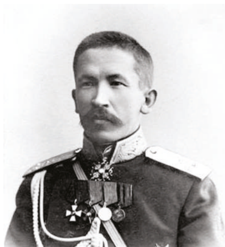
Lavr Georgijevič Kornilov