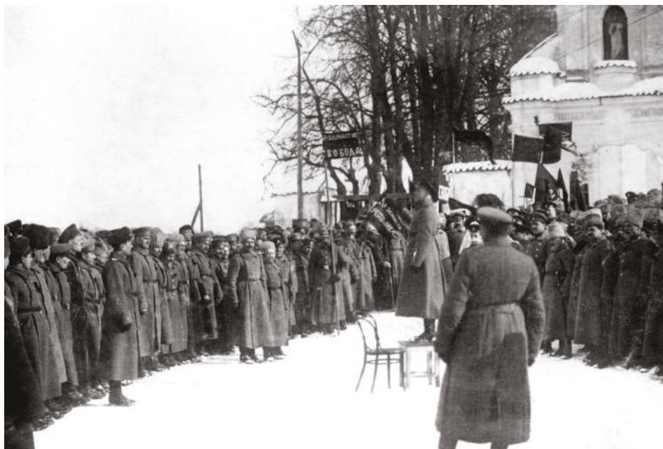
Manifestace v ruské armádě. Ke slovu se dostávají političtí řečníci, Petrohrad, březen 1917.