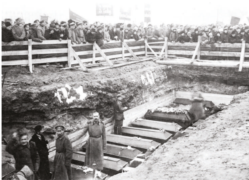
Píjetní tryzna 210 obětí revolučních dnů v Petrohradě 5. dubna 1917, které se zúčastnilo 900 tisíc lidí