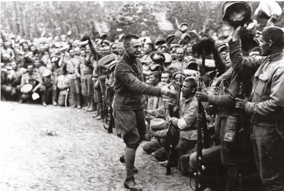
Ministr Alexandr F. Kerenskij při agitaci mezi ruskými vojáky v červnu 1917