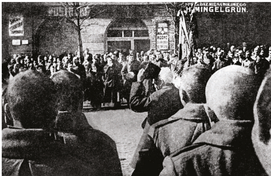
Prísaha 231 novodružiníků v Tarnově, leden 1915