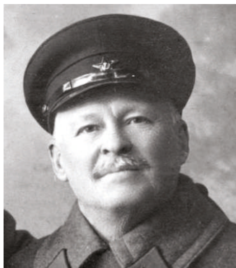
Alexej Jevgeňjevič Gutor

V roce 1895 ukončil Nikolajevskou akademii Generálního štábu v Petrohradě a působil v různých štábních funkcích. Účastnil se rusko-japonské války, následně velel několika pěším plukům. Po mobilizaci v roce 1914 je náčelníkem štábu 4. armády, se kterou působí na frontě. V dubnu 1915 je jmenován velitelem 34. pěší divize, poté v březnu 1916 velitelem 6. armádního sboru, který však pod jeho vedením utrpěl těžké ztráty. Na počátku roku 1917 byl přeložen do čela 11. armádního sboru, v květnu se ujímá 11. armády. O měsíc později se stává velitelem celého Jihozápadního frontu, který provedl tzv. Kerenského ofenzívu. Po počátečním úspěchu však operace vedla ke zhroucení ruské armády a Gutor byl přeložen do zálohy. V roce 1918 vstoupil do Rudé armády, kde zastával mnoho významných postů. V roce 1920 byl zatčen za kontrarevoluci, po dvou letech byl ale pro nedostatek důkazů