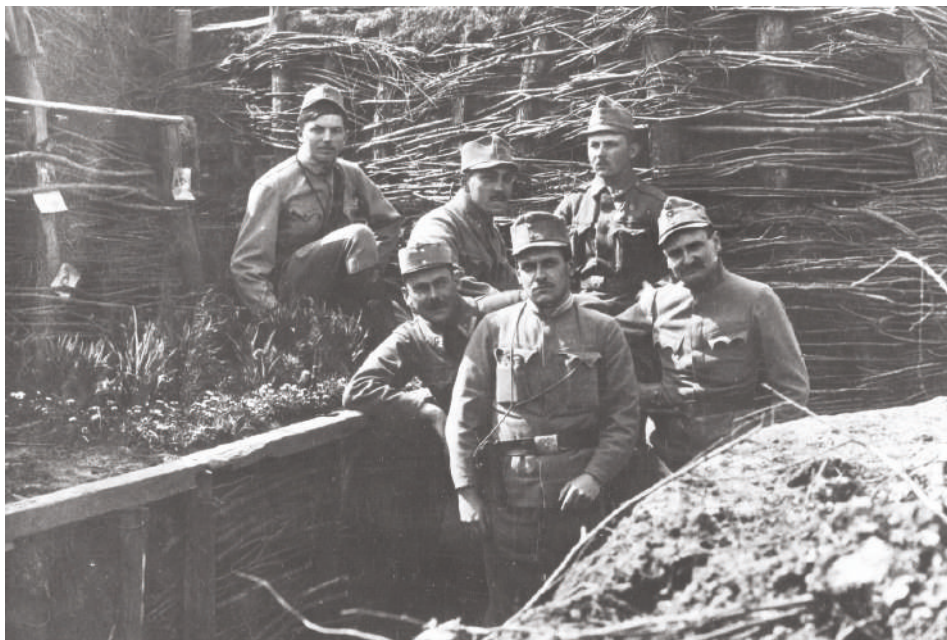
Čeští vojáci c. a k. pěšího pluku č. 75, který byl doplňován na jindřichohradecku, v zákopech u Koňuch před útokem čs. brigády