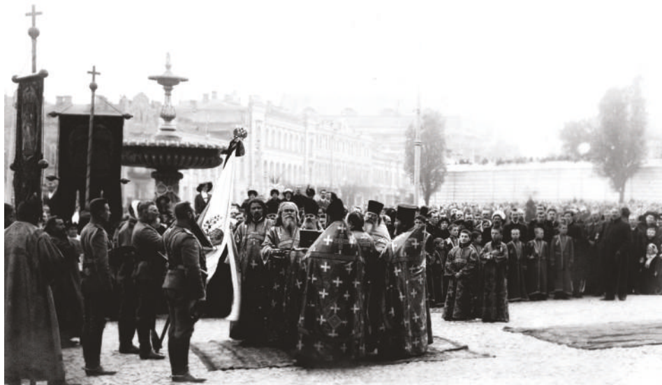
Slavností přísaha a svěcení praporu České družiny na Sofijském náměstí v Kyjevě, podle ruského kalendáře se tak stalo na svátek sv. Václava 28. září 1914 (11. 10. 1914)