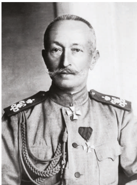
Alexej Alexejevič Brusilov

Pocházel z vojenské rodiny, jeho kariéra tak byla předurčena. V letech 1877–1878 se účastnil na Kavkaze bojů s Turky, následně velel Jezdecké škole pro důstojníky. Od roku 1909 velel několika divizím a armádním sborům. Na počátku války byl v čele 8. armády, se kterou úspěšně operoval v oblasti Varšavy. V březnu 1916 se stal velitelem Jihozápadního frontu. Od června do října 1916 probíhala jím naplánovaná ofenzíva, která byla poslední úspěšnou ruskou operací ve válce. Po revoluci v únoru 1917 se stal vrchním velitelem armády, po bitvě u Zborova vyslovil uznání čs. jednotkám. Následně byl ze své funkce odvolán, po říjnové revoluci se odmítl přidat k „bílým“ (pravděpodobně proto, že popravili jeho syna) a od roku 1920 sloužil jako předseda sboru vojenských specialistů při vrchním velení sovětské Rudé armády. V letech 1923–1924 působil jako generální inspektor jezdeckta. Po jeho smrti mu byl vypra-