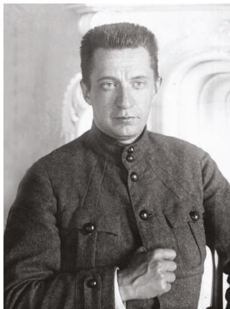
Alexandr Fjodorovič Kerenskij

vratu. Po vypuknutí únorové revoluce v roce 1917 tak patřil k jejím vůdcům. Po svržení cara byl nejprve členem Prozatímního výboru Státní dumy, po vzniku Prozatímní vlády knížete Lvova v březnu se stal ministrem spravedlnosti a v dubnu také války a válečného námořnictva. Z této funkce začal v květnu objíždět frontu a vysvětlovat vojákům důvody pro setrvání Ruska ve válce a důleži-