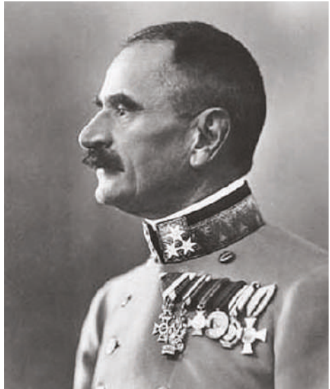
Karl Tersztyánszky von Nádas

výšlen na generálmajora. Dále stoupal po kariérním žebříčku, v dubnu 1913 získal místo v Tajné radě a stal se také čestným majitelem husarského pluku č. 8. Když vypukla válka se Srbskem, stál v čele IV. sboru, který obsadil město Šabac. Po vypuknutí bojů s Ruskem s ním byl v srpnu přesunut do Haliče do okolí města Lvov. Zde nejprve museli jeho muži ustoupit před ruskou ofenzívou, při následném protiútoku ale obsadili Užský průsmyk a město Turka. Na jaře 1915 se stal velitelem armádní skupiny Tersztyánszky, se kterou se měl zapojit do ofenzívy proti Srbsku, pro spory s uherskými úředníky byl ale odvolán. V květnu 1916 byl povýšen na generálplukovníka a stal se velitelem 4. armády. Po neúspěšné ofenzívě u Lucku byl však pro neshody s německými veliteli opět odvolán. V březnu 1917 se stal velitelem 3. armády. Ta během Kerenského ofenzívy utrpěla velké ztráty, přišla např. o většinu dělostřelectva a Rusové doká-