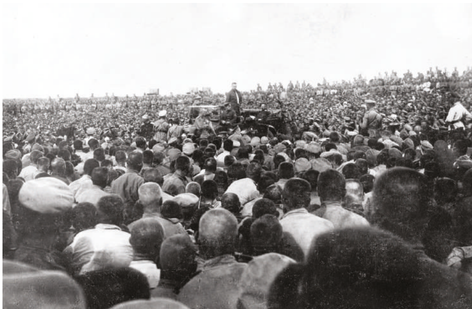
Ministr války a námořnictva Prozatímní vlády Alexandr Kerenskij mluví k ruským a čs. vojákům v Jezerné před bitvou u Zborova