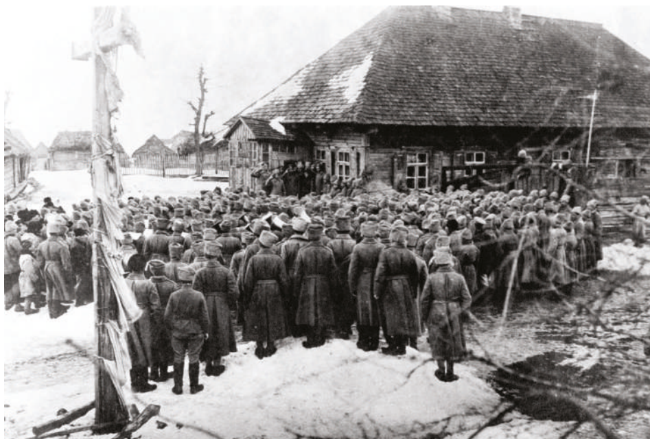
Příslušníci čs. brigády prohlašují právo na samostatnost čs. státu. Remčica, únor 1917.