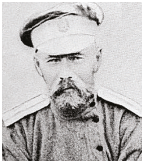
Leonid Nikolajevič Bělkovič

1914 byl nejprve jmenován velitelem 57. a po několika dnech 15. pěší divize. V červenci 1915 je jmenován velitelem 41. armádního sboru a v dubnu 1917 velitelem 7. armády. Během Kerenského ofenzívy je jeho armáda nejsilnější, dosáhla však nejmenšího úspěchu, takže již 3. července byl odvolán a odeslán do zálohy nejprve ke Kyjevskému a následně Moskevskému vojenskému okruhu. V roce 1918 se přihlásil do služeb Rudé armády, pracoval v historickém oddělení, které zpracovávalo události Velké války. Byl autorem několika studií. Ve stavu Rudé armády je veden ještě v roce 1920, pak ale jeho stopa mizí.