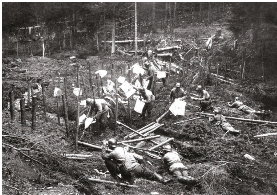
Sbírání nepřátelských proklamací příslušníky 5. roty 1. pluku v rumunských Karpatech, jaro 1917