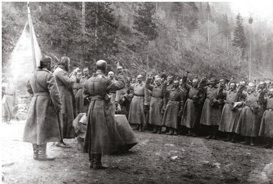
Přísaha věrnosti Prozatímní vládě u ruského 333. pluku v rumunských Karpatech, u kterého v té době sloužili příslušníci 1. roty 1. čs. pluku, březen 1917