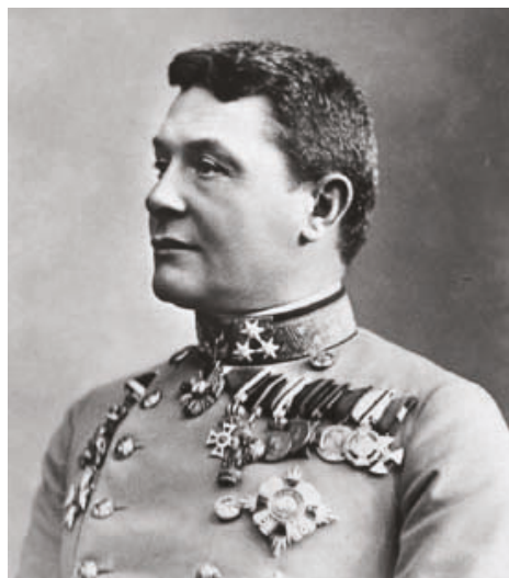
Hermann Albin Josef Baron Kövess von Kövessháza

Pocházel z vojenské rodiny, roku 1865 vstoupil do kadetní školy v Heinburgu a vojenské studium ukončil na vídeňské Vojenské technické akademii. V letech 1876–1878 absolvoval Válečnou školu. V roce 1882 se podílel na potlačení vzpoury v Dalmácii. V roce 1898 se stal velitelem pěšího pluku č. 23 ve Vídni, v roce 1902 je povýšen na generálmajora a v roce 1907 na polního podmaršála. To již byl velitelem 8. pěší divize. V roce 1911 následovalo povýšení na generálplukovníka. Po vypuknutí války stál v čele nekompletního XII. armádního sboru, který operoval v Halíči a utrpěl ztráty od ruské armády. V květnu 1915 se účastnil průlomu u Gorlice a podařilo se mu dobýt pevnost Ivanograd. Poté byl přeložen na srbskou frontu, kde se v září ujal nové 3. armády. Vedl si výborně, v říjnu obsadil Bělehrad, pronásledoval ustupujícího nepřítele a na počátku roku 1916 porazil černohorskou armádu. V březnu se se svou armádou stěhuje do Itálie, kde v květnu zahájil ofenzívu. Ruská Brusilovova ofenzíva z června však znamenala rychlý přesun na východní frontu. Byla zde ustanovena nová 3. armáda s ním v čele, která se pak bránila ruskému náporu. V říjnu 1916 se stal velitelem