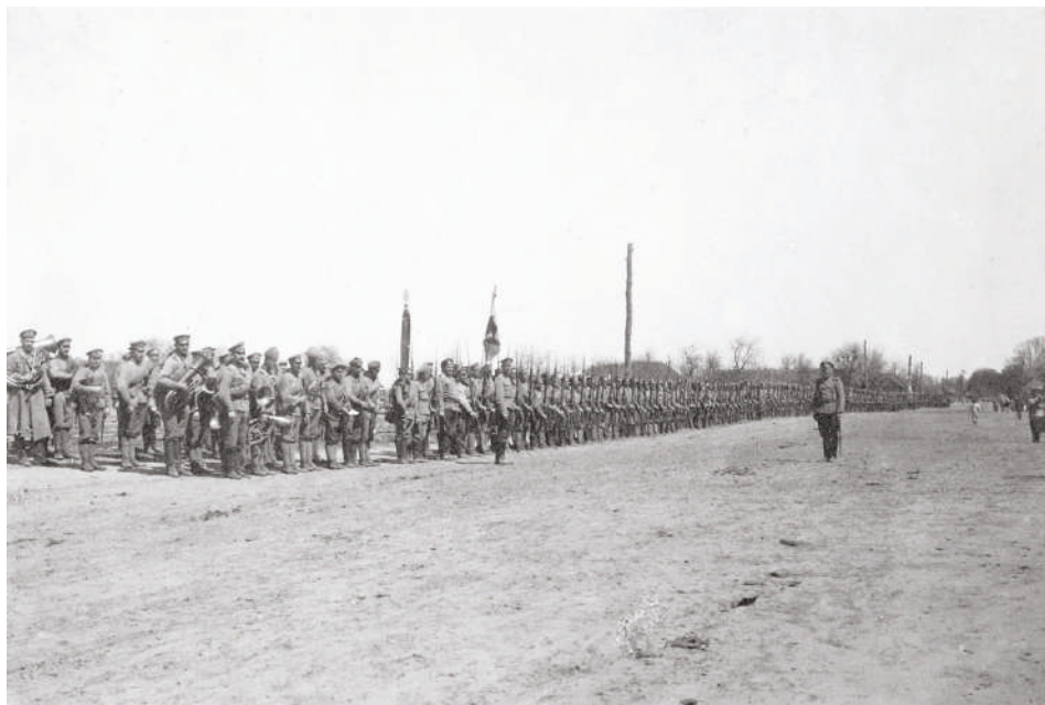
Nástup čs. vojáků před odchodem ke Zborovu. Vpředu si povšimněte vojenské hudby.