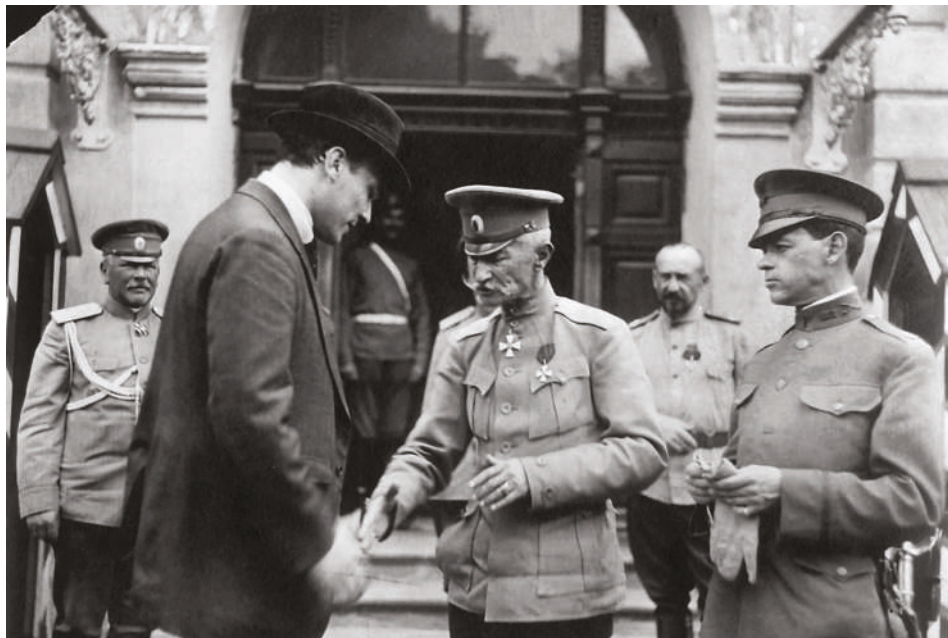
Generál Alexej A. Brusilov s ministrem financí Prozatímní vlády A. Těřeščenkem