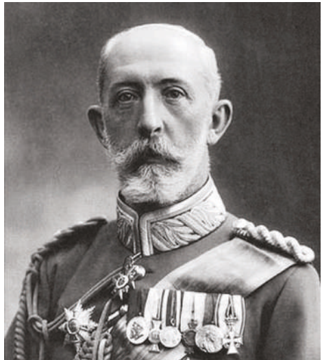
Felix Graf von Bothmer

Pocházel z vojenské rodiny. Od roku 1871 sloužil v bavorské armádě, v letech 1875–1878 absolvoval Válečnou akademii v Mnichově a poté působil ve štábech řady jednotek, na generálním štábu a na ministerstvu války. V roce 1910 byl povýšen do hodnosti generál pěchoty a přeložen do rezervy. Do války se zapojil v prosinci 1914, kdy byl jmenován velitelem 6. záložní divize a ještě na konci měsíce II. záložního sboru, které operovaly v oblasti belgických Yper. V březnu 1915 se stal velitelem sboru Bothmer, který byl poslán do oblasti Karpat na pomoc rakousko-uherské armádě, v dubnu 1915 porazil Rusy v bitvě u Zwininu a měl podíl na květnovém průlomů u Gorlice. V srpnu