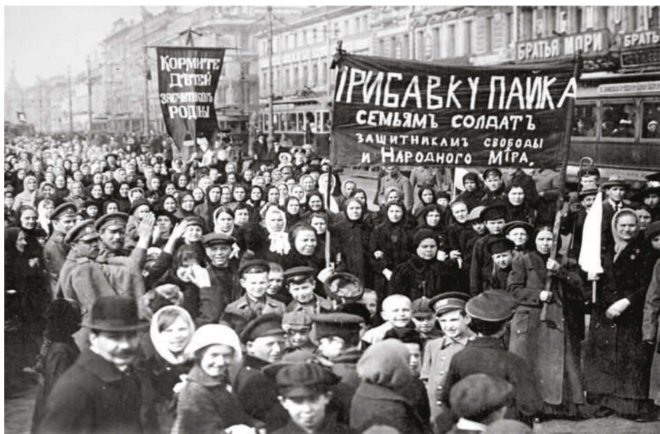
Stávka dělníků Putilovských závodů v Petrohradě, březen 1917

Na události v Rusku roku 1917 mělo velký vliv již léto roku předchozího. V červnu 1916 byla zahájena Brusilovova ofenzíva, která skončila v září velkým vítězstvím, ale zároveň obrovským rozvratem carské armády. Rusové sice dokázali místy postoupit až o 120 km, rozbít mnoho německo-rakouských jednotek a připravit je o mnoho mužů, sami se ale totálně vyčerpali. Vítězství bylo vykoupeno více jak 800 tis. mrtvými, téměř stejný počet vojáků byl zraněn, nezvěstný nebo dezerto-