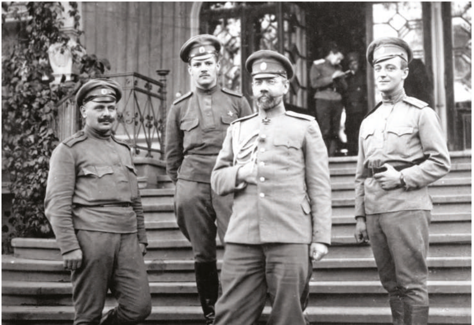
Velitel 48. ruské pěší divize gen. Novickij se svými rozvědčíky, příslušníky 4. roty Syrovým, Licynským a Vilímkem, podzim 1915