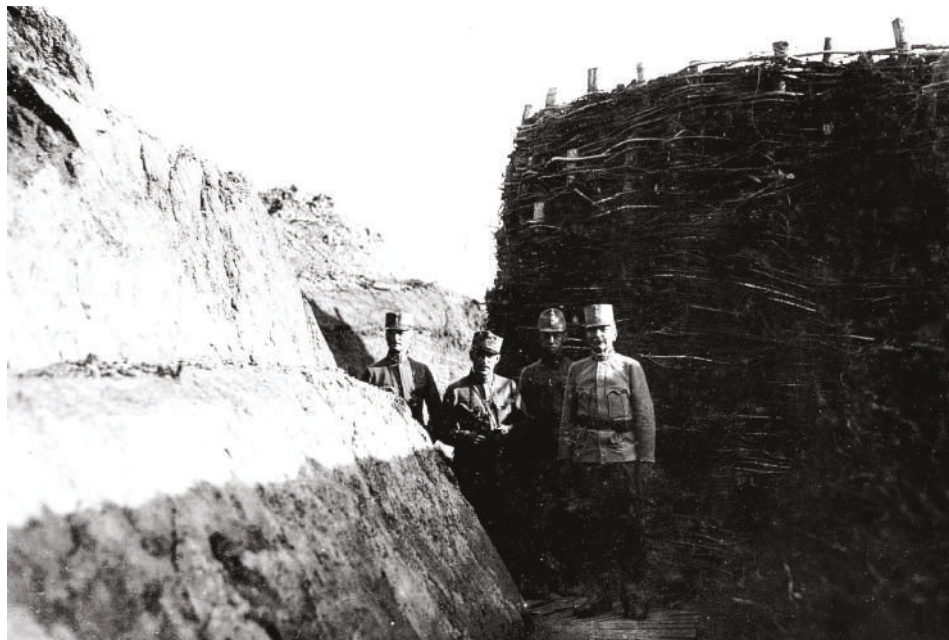
Generál E. Kletter (první zprava) s náčelníkem svého štábu plk. N. Ruzic von Sanodol (první zleva) na inspekci postavení praporu polních myslivců č. 5, jaro 1917