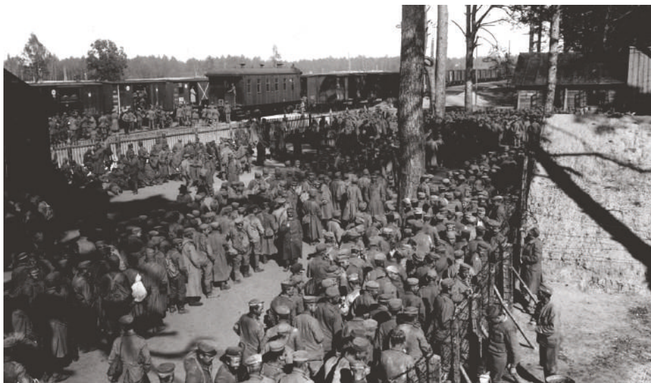
Darnica u Kyjeva, jeden z největších zajateckých táborů v Rusku, kde bylo internováno i mnoho českých zajatců

Na počátku roku 1916 se podařilo získat povolení k náboru zajatců, kteří si již podali přihlášku přes Svaz ke generálnímu štábu. Tím vzrostly naděje u dalších zajatců, podpořené rostoucími zprávami o hrdinských činech čs. dobrovolníků nejen na ruské, ale i francouzské frontě. Čs. věc také nacházela stále více příznivců mezi významnými ruskými politiky. Češi se v zajateckých táborech také začali organizovat do různých spolků (byť ilegálních) a četli i přispívali do různých čs. periodik, zejména časopisu Čechoslován. Zajatci též zakládali sokolské jednoty, které podporovaly národnostní myšlenky, a mnoho zajatců také manifestačně přecházelo k pravoslaví. Navíc por. V. Klecanda, řídicí výzvědné