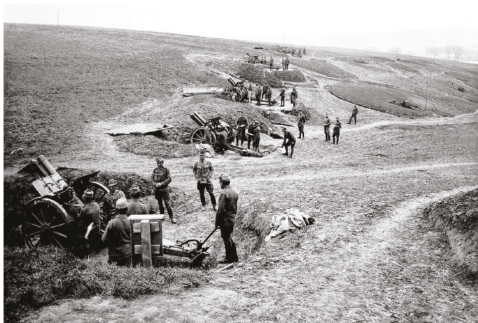
Postavení rakousko-uherských polních houfnic u Břežan na jaře 1917