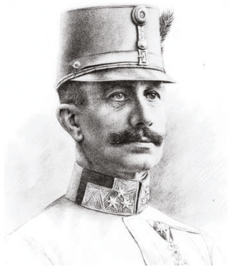
Eduard von Böhm-Ermolli

Narodil se Itálii v rodině armádního důstojníka, která se krátce poté přestěhovala do Opavy. V roce 1875 ukončil vídeňskou Tereziánskou vojenskou akademii a byl přidělen jako velitel čety k dragounskému pluku č.4. Projevil výrazné nadání, proto byl poslán ke studiu na Válečnou školu, kterou ukončil roku 1880. Následně sloužil v různých štábních funkcích, od roku 1891 na štábu Generálního inspektora jezdecktva. V prosinci 1896 se stal velitelem hulánského pluku č.3, v dubnu 1901 přešpurské 16. jezdecké brigády. Od roku 1905 byl v čele samostatné Divize jezdecktva, které působila na severní Moravě, ve Slezsku a Haliči. V roce 1907 byl povýšen na polního podmaršálka, roku 1909 se ujal velení 12. pěší divize, v listopadu 1911 1. sboru v Krakově a v květnu 1912 byl povýšen na generála jezdecktva. V době mobilizace v červenci 1914 se stal velitelem 2. armády, se kterou vstoupil do války a velel jí až do května 1918. Nejprve s ní byl nasazen proti Srbsku, po ruském průlomu v Haliči se však již v srpnu přesunula na východní frontu, kde se střídavými úspěchy působila až do konce bojů. Od září 1915 do ledna 1918 stál také v čele tzv. Böhm-Ermolliho skupiny armád, která sdružovala rakouské, německé i osmanské síly. V červenci 1917 se podílel na zastavení Kerenského ofenzívy a následném protiútoky. Na jaře 1918,