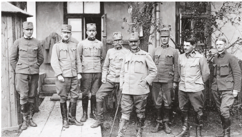
Eduard Edler von Böltz (uprostřed), velitel 19. pěší divize, se svým štábem