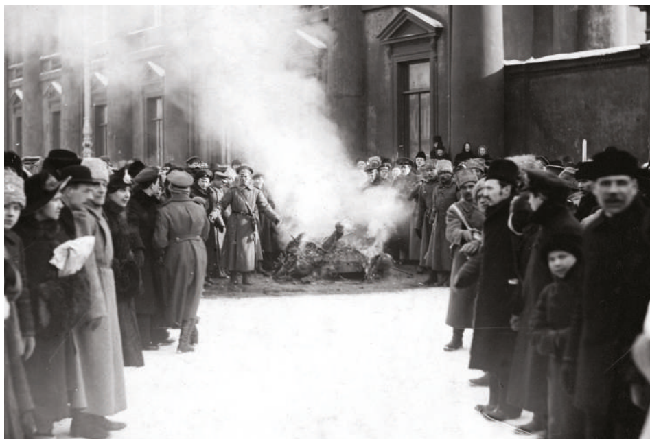
Pálení carského orla před budovou parlamentu v Petrohradu v březnu 1917