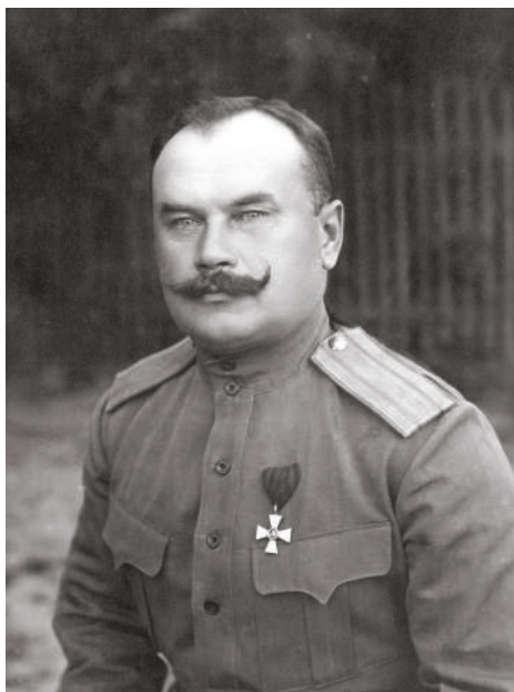
Vjačeslav Platonovič Trojanov

Do armády vstoupil v roce 1894, absolvoval Čugajevské vojenské učiliště a v letech 1904–1905 se účastnil rusko-japonské války. Celou dobu pravděpodobně sloužil u 34. sevského pěšího pluku. U něj ho také, již v hodnosti majora, zastihla mobilizace v červenci 1914 a vypuknutí nové války. Během bojů se osvědčil jako dobrý a statečný voják, takže již v říjnu byl povýšen na podplukovníka. V červenci 1915 byl jmenován velitelem České družiny. Mezi Čechoslováky byl zakrátko velmi oblíben, intenzivně se podílel na reorganizaci útvarů a projevoval plnou podporu jejich boji za samostatnost. V červenci byl také povýšen na plukovníka a s tím, jak se rozrůstalo čs. vojsko v Rusku, stoupal i on po hodnostních žebříčcích. Nejprve se stal velitelem Čs. střeleckého pluku, a když se pluk v květnu 1916 rozrostl na Čs. střeleckou brigádu, stál v jejím čele. Jejím velitelem byl i během letní Kerenského ofenzívy. Úspěch brigády u Zborova přinesl ocenění i jemu. Byl povýšen na generálmajora a 18. července 1917 jmenován do čela 1. finské divize a v září se ujal 24. armádního sboru. S jednotkami působil na rumunské frontě, kde v té době probíhaly nejtěžší boje, během kterých se Rumunům za pomoci ruských jednotek podařilo způsobit Centrálním mocnostem vel-