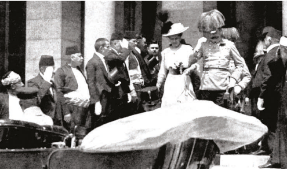
Odjezd arcivévody Františka Ferdinanda d'Este a Žofie Chotkové od sarajevské radnice těsně před atentátem, 28. června 1914

V neděli 28. června 1914 spáchal srbský separatista Gavrilo Princip atentát na rakouského následníka trůnu Františka Ferdinanda d'Este a jeho manželku, českou šlechtičnu Žofii Chotkovou. Stalo se tak v Sarajevu, hlavním městě Bosny a Hercegoviny, kterou Rakousko-Uhersko anektovalo v roce 1908. S tím se však velká část obyvatelstva nehodlala smířit a vedla proti Habsburkům odboj, silně podporovaný sousednímu Srbskem. Arcivévoda, jako generální inspektor armády, byl mimo jiné přítomen na manévrech, které se konaly na