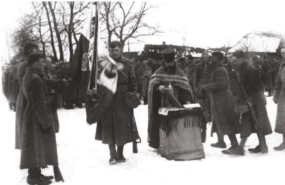
Prísaha príslušníku III. praporu 1. pluku (z něhož později vznikl 3. pluk) na prapor České družiny. Treskyňě, únor 1917.

léta 1916 se přihlásilo do čs. vojska již na 7 000 zajatců, a proto byl v Borispolu 21. října 1916 zřízen 1. čs. záložní střelecký prapor a důstojnická škola čs. brigády. Dalších 200 000 zajatých Čechů a Slováků bylo roztroušeno po zajateckých táborech, v dolech, zbrojních závodech a hospodářských usedlostech po celé Rusi.