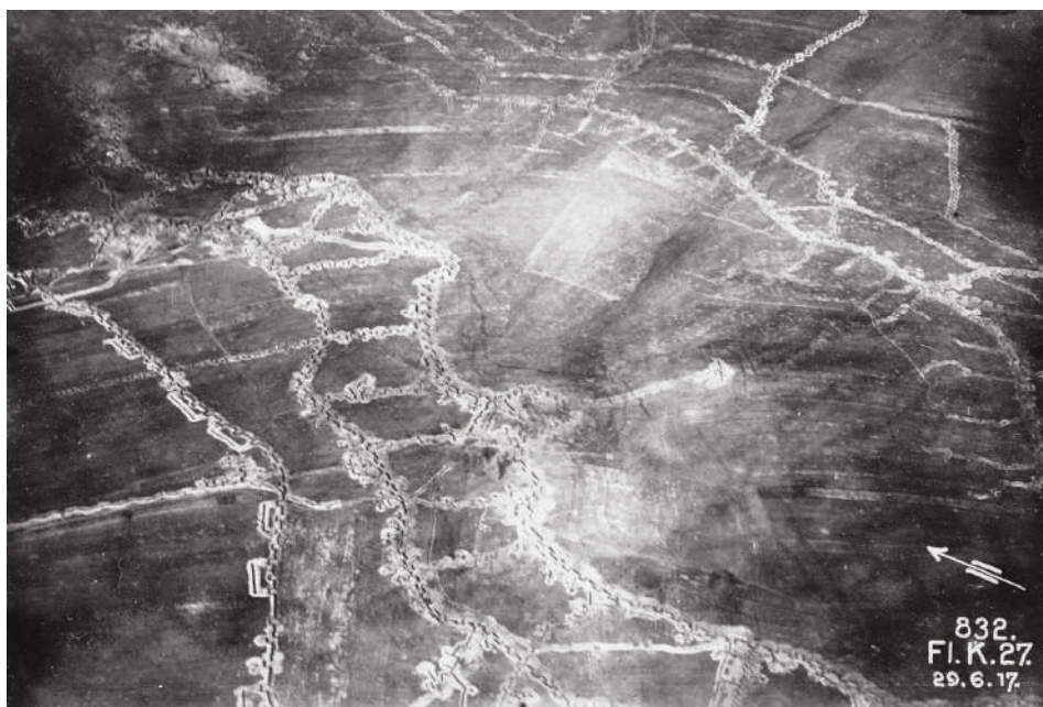
Letecký snímek linií rakousko-uherských zákopů u Zborova. Vpravo jsou vidět ruské zákopy, které byly obsazeny dobrovolníky Československé střelecké brigády.