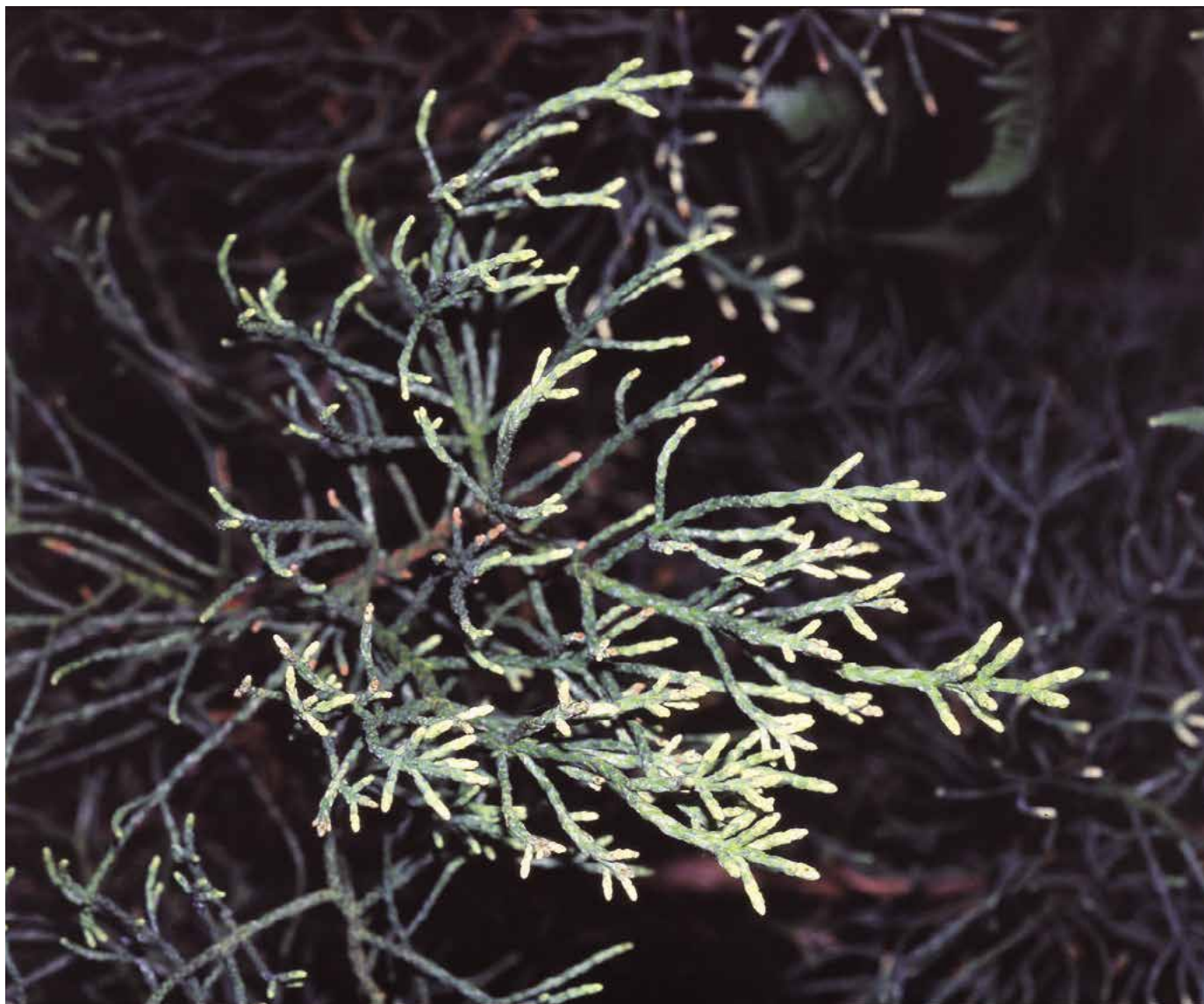
▲ Athrotaxis cupressoides – detail (R. Rybková)

Nároky a vše ostatní. Daří se ve Středozezemí a na některých místech v Anglii. Ve středoevropských podmínkách musí přezimovat ve studeném skleníku, zimní zahradě nebo ve světlých halách. Patří u nás mezi zajímavé, stálezelené, spíše sbírkové kbelíkové rostliny. Vše ostatní viz hlavo- tis a araukárie.