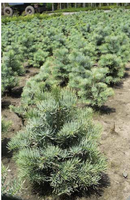
▲ Abies concolor 'Compacta' – porost (T. Horák)

olacea compacta , před r. 1891; vzrůst zakrslý, nepravidelně keřovitý, stěsnaný, větve velmi hustě uspořádané, jehlice tuhé, vzpřímené nebo srpovitě zahnuté, 25–40 mm dlouhé, namodralé ojněné), 'Fagerhult' r. 1933; vzrůst statný, kmen vzpřímený, větve výrazně převislé, jehlice delší než u původního druhu, jehlice nápadně šedomodré), 'Fastigiata' (před r. 1889; vzrůst sloupovitý až kuželovitý, hustý, větve velmi krátké a vystoupavé, jehlice šedozelené), 'Gable's Weeping' (r. 1969; vzrůst nízký, větve vodorovně odstávající, jehlice podstatně kratší, temně šedozelené), 'Globosa' (r. 1905; vzrůst kulovitý, větve krátké, pravidelně uspořádané, rostliny až 0,7 m široké, jehlice tuhé, šedozelené), 'Husky Pup' (r. 1975; vzrůst velmi zakrslý, široce kuželovitý, jehlice až 2,5 cm dlouhé, 15leté rostliny asi 0,4 m vysoké a asi stejně široké), 'Igel' (r. 1984; vzrůst zakrslé polokulovitý, velmi hustý, roční přírůstky asi 1,5 cm), 'Pendula' (před r. 1896; vzrůst převislý, kmen většinou sloupovitě vzpřímený, větve i větévky zplihle převislé), 'Piggelmee' (r. 1975; vzrůst nepravidelně zakrslý, sotva 0,3 m vysoký, jehlice velmi hustě uspořádané, tuhé, stříbřitě namodralé), 'Schrammii' (před r. 1913; od podobného výpěstku 'Violacea' se liší rovnými, srpovitě nezahnutými, dvouřadě roz-