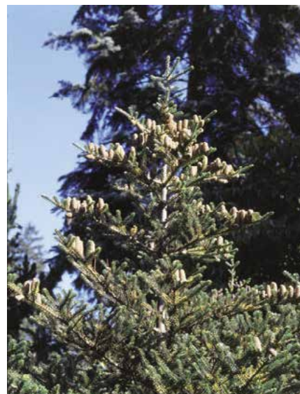
▲ Abies koreana – vrchol koruny (R. Rybková)

růstající stromy. Koruna v mládí široce kuželovitá, někdy poněkud nepravidelná, ve stáří vždy pravidelně stavěná. Základní větve v hustých přeslenech, lehce vystoupavé. Kmen rovný, středně silný, borka ve stáří