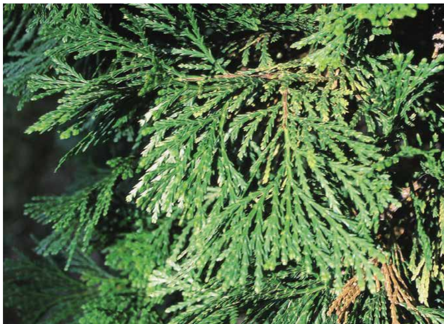
▲ Calocedrus decurrens – detail větévky (K. Gregor)

hnědou, v pruzích odlupující kůrou, později červenohnědou, hluboce brázditou borkou. Stálezelené, šupinaté listy vejčité podlouh-