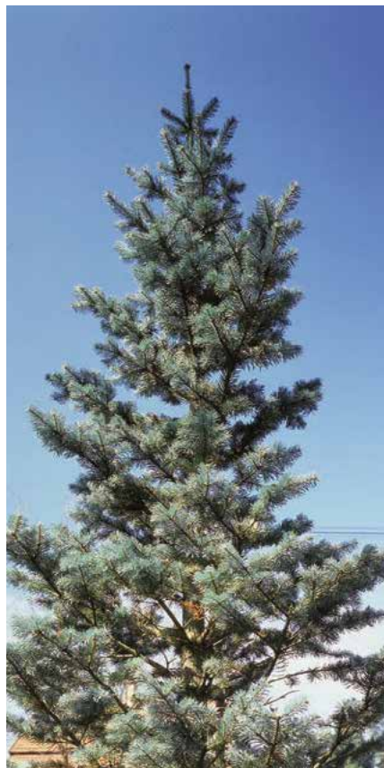
▲ Abies procera 'Glauca' – vrchol koruny ( D. Dugas )

Kultivary. Nejčastěji se pěstují 'Argentea' (r. 1886; strom, jehlice namodralé bělavé, stříbřitě lesklé), 'Blaue Hexe' (kolem r. 1965; vzrůst zakrslý, zpočátku široce a ploše kulovitý, větve později vystoupavé, krátké a hustě členité, jehlice krátké), 'Glauca' (před r. 1863; jehlice nápadně bě-