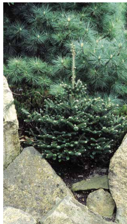
▲ Abies koreana 'Oberon' (Č. Raab)

liny 0,3 m vysoké a 0,6 m široké, jehlice svěže zelené), 'Horstmann WB' (r. 1986; vzrůst zakrslý, jehlice hustě uspořádané, matně temně zelené, 2 cm dlouhé, na rubu se 2 bílými proužky), 'Inverlieht' (r. 1985; vzrůst slabší, širší než vysoký, šišky početné), 'Lippetal' (r. 1989; vzrůst vzpřímený, zakrslý, jehlice uspořádané radiálně), 'Lucy' (r. 1999; vzrůst pomalý, jehlice velmi hustě uspořádané a poněkud prohnuté), 'Luminetta' (syn. 'Lutea', r. 1990; vzrůst pomalý, vzpřímený, jehlice i v zimě zlatožluté), 'Moravia Dwarf' (r. 1999; vzrůst pomalý, poměrně úzký a strnulý, jehlice velmi krátké, nápadně vybarvené), 'Oberon' (vzrůst