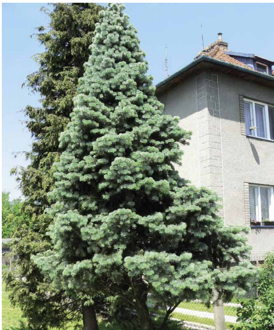
▲ Abies concolor (K. Gregor)

kami, které jsou před dozráním zelené), dále kultivary 'Argentea' (syn. 'Candicans', f. argentea Niemetz, před r. 1903; od původního druhu se liší výrazně stříbřitě bílými jehlicemi), 'Archer's Dwarf' (r. 1982; vzrůst zakrslý, vzpřímený, úzce kuželovitý, větve vodorovně odstávající, jehlice malé, 10leté exempláře asi 1,5 m vysoké a až 0,8 m široké), 'Aurea' (před r. 1906; vzrůst robustní, rašení zcela zlatožluté, později stříbřitě šedavé), 'Candicans' (r. 1929; výběr z f. argentea , od původního druhu se liší jehlicemi zcela stříbřitě bílými), 'Compacta' (syn. f. vi-