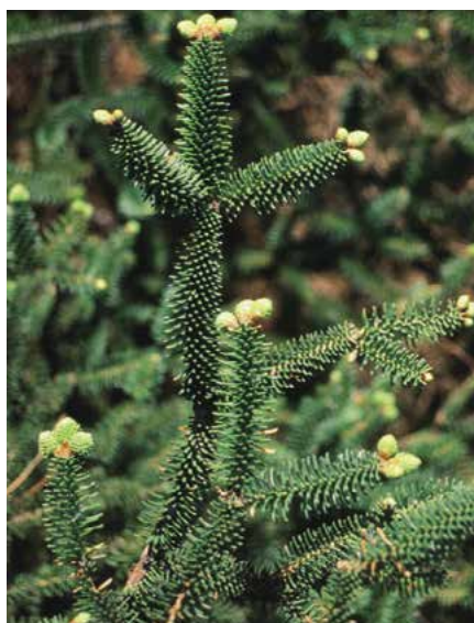
▲ Abies pinsapo – detail větvky (K. Gregor)

jedle většinou menší. Kůra zpočátku hladká, později drsná. Mladé výhony červenohnědé, lysé. Pupeny vejčité kulovité, tupé, silně pryskyřičné. Jehlice radiálně na všechny strany odstávající, tuhé, tlusté, 8–15 mm dlouhé, na bázi štítovitě rozšířené, špičky nepatrně pichlavé, na rubu se 2 výraznými bílými pruhy průduchů. Samčí květy temně červené. Šišky (VII–X) vzpřímené, přisedlé, cylindrické, 10–15 cm dlouhé, 4–5 cm tlusté, světle hnědé, šupiny trojhranné klínovité. Kořenový systém obdobný jako u jedle bělokore.