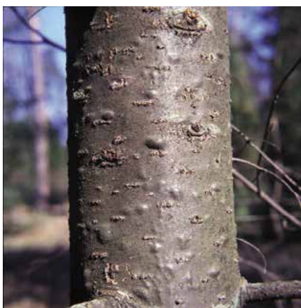
▲ Abies balsamea – detail kmene (D. Dugas)

pupeny vejčité kulovité, drobné, sklovitě pryskyřičnaté. Jehlice, obzvláště u mladších stromů, kartáčovitě uspořádané, na slabších větvích i hřebenovitě rozčísnuté, 15 až 25 mm dlouhé, s lehce zaoblenou špičkou, nahoře tmně zelené, na rubu se 2 bílými pruhy průduchů, při rozemnutí voní silně balzámově. Na plodných větvích jsou jehlice kratší, strnulejší, špičatější a více nahoru stočené. Rozpadavé šišky ozdobné (VII–XI), vzpřímené, malé, vejčité válcovité, 5–9 cm dlouhé, před uzráním tmně fialové, zralé šedohnědé, nakonec silně pryskyřičné, šupiny 15 mm široké. Kořenový systém obdobný jako u jedle bělokoré. Nabodnutím pryskyřičných zduřenin kůry se získává světle žlutý, tekutý, silně lepkavý kanadský balzám.