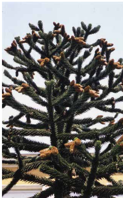
▲ Araucaria araucana (K. Gregor)

podmínkách jen vzácně přes 10 m. Koruna je většinou široce kuželovitá, bizarního vzhledu, u starších jedinců téměř kulovitá, při solitérním umístění až k zemi zavětvená. Větve válcovité, v přeslenech, odstávají víceméně vodorovně, horní jsou mírně vystoupavé a nejspodnější poněkud převíslé. Kmen roste rovně, má dlouho patrné šupiny po listech, pozdější borka je černošedá až šedavě nahnědlá, šupinovitě odlupující. Listy hustě spirálovitě uspořádané, vejčité kopinaté, na bázi výrazně rozšířené a přisedlé, 25–35 mm dlouhé, ostře trnitě zašpičatělé, temně zelené a setrvávají na rostlině 10–15 let. Šišky (VIII–XI), vzprímené, kulovité, až 15 cm široké, hnědé, plodové šupiny podlouhle kopinaté s dlouhými, čárkovitými přívěsky. Semena 3–4,5 cm dlouhá, podlouhle opakvejčitá, červenohnědá, jedlá (známá „pinones“). Kořenový systém vytváří často i několik hlubokých kulových kořenů, vedlejší kořeny průměrně větvené.