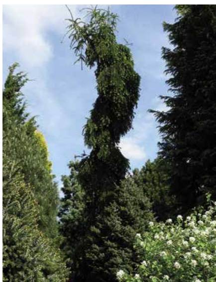
▲ Abies nordmaniana 'Pendula' (T. Horák)

nízký, stěsnaně kuželovitý, výhony velmi krátké, vzpřímené, jehlice různé délky, buď 4–5 mm nebo i 10–30 mm), 'Glauca' (vyskytuje se občas ve výsevech, jehlice silné, namodrale zelené), 'Golden Spreader' (před r. 1961; vzrůst zakrsle polštářovitý, plochý, větve daleko odstávající, jehlice svrchu světle žluté, na rubu bělavě žluté, 10leté exempláře asi 0,6 m vysoké, trpí někdy slunečním úpalem), 'Horizontalis' (před r. 1887; vzrůst zakrslý, rozložitý, bez vrcholového výhonu, všechny větve a výhony vodorovné), 'Jensen' (před r. 1944; vzrůst bujný, převislý, jehlice krátké, jen 10 až 18 mm dlouhé), 'Pendula' (poprvé r. 1869