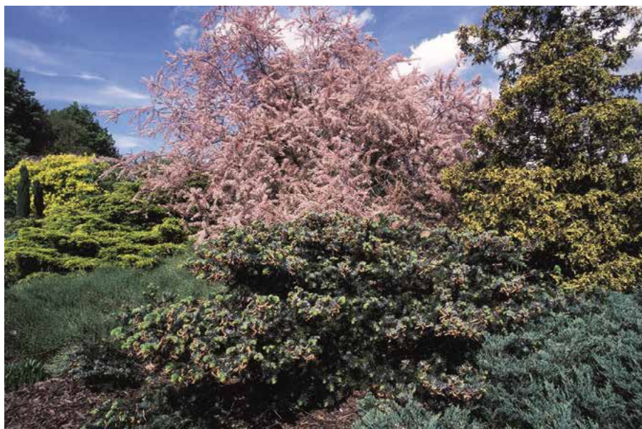
▲ Abies amabilis 'Spreading Star' – v pozadí tamaryšek (R. Rybková)

Popis druhu. Domovem v Severní Americe, kde roste nejčastěji v horách a močálovitých oblastech. Vytváří 15–25 m vysoké stromy, koruna zašpičatěle kuželovitá. Kmen štíhlý, kůra popelavě šedá, s četnými pryskyřičnými zduřeninami, nakonec šupinatá. Mladé výhony žlutošedé, roztroušeně chloupkaté,