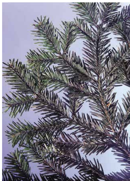
▲ Abies alba – detail větvky (D. Dugas)

Kultivary. Ojedinele se pěstuje 'Columnaris' (r. 1861; vzrůst vysoký, štíhle sloupovitý, početné větve krátké, vystoupavé, stejně dlouhé, jehlice poněkud kratší než u původního druhu), 'Compacta' (kolem r. 1885; vzrůst zakrslý, kulovitý, stěsnaný, širší než vyšší, jehlice výrazně lesklé), 'Fastigiata' (r. 1846; vzrůst vysoký, široce sloupovitý, až 3 m široký, jehlice tenké, 1–2 cm dlouhé), 'Microphylla' (před r. 1867; vzrůst zakrslý, větve tenké, krátké a shloučené, jehlice velmi tenké, úzké, až 1,5 cm dlouhé), 'Mladá Boleslav' (syn. 'Veselý', 'Jeseník', r. 1981; vzrůst široce keřovitý, jehlice svěže zelené, 20letý jedinec asi 100 cm vysoký a 150 cm široký, možná WB), 'Pendula' (kolem r. 1835; 10–15 m vysoký, kmen zpočátku vzpřímený, vrchol