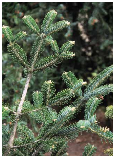
▲ Abies bornmuelleriana – detail větve (K. Gregor)

Popis druhu. Domovem na jižním pobřeží Černého moře a v Turecku, kde stoupá vysoko do hor. Mezidruhový kříženec A. cephalonica x A. nordmanniana . Strom až 30 m vysoký, připomínající A. nordmanniana , zavětvený až k zemi. Koruna široká až úzce kuželovitá. Kmen zůstává dlouho