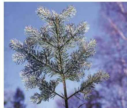
▲ Abies procera 'Glauca' – detail větévky ( D. Dugas )

lavě nasivělé), 'Jeddeloh' (r. 1979; vzrůst stejný jako u 'Blaue Hexe', jen jehlice namodralé zelené), 'Nobel' (vzrůst ploše přízemní, ve stáří roste podobně jako výpěstek 'Prostrata' poněkud vzpřímeně, jehlice velmi hustě uspořádané, výrazně namodralé), 'Prostrata' (syn. A. nobilis compacta Hort., před r. 1932; vzrůst nestejně ploše keřovitý, vzniká roubováním postranních větví, později roste vzpřímeně), 'Sherwoodii' (r. 1933; jehlice vytrvale zlatožluté) a další. Na objevení a namnožení několika čarovníků „WB“ se podíleli i čeští zahradníci a sběratelé (bližší viz jedle bělokorá).