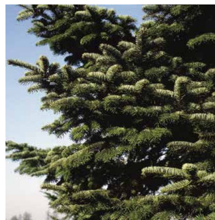
▲ Abies numidica – větvoví (H. Atanasová)

Popis druhu. Domovem ve východním Alžírsku a domestikována v jižní Evropě, kde roste nejčastěji spolu s A. pinsapo , A. cephalonica a A. cilicica . Na původních stanovištích (Kabylsko) roste 1600 až 2000 m n. m. na kamenitých půdách s cedry, tisy, cesminami apod. Tvoří urostlé, 15–20 m vysoké stromy. Koruna hustě rozvětvená, pravidelně kuželovitá. Základní větve v přeslenech, velmi členité, vodorovně rozložené. Kmen rovný, válcovitý, kůra v mládí tenká a hladká, starší borka