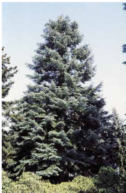
▲ Abies concolor var. lowiana (Č. Raab)

kami, které jsou před dozráním zelené), dále kultivary 'Argentea' (syn. 'Candicans', f. argentea Niemetz, před r. 1903; od původního druhu se liší výrazně stříbřitě bílými jehlicemi), 'Archer's Dwarf' (r. 1982; vzrůst zakrslý, vzpřímený, úzce kuželovitý, větve vodorovně odstávající, jehlice malé, 10leté exempláře asi 1,5 m vysoké a až 0,8 m široké), 'Aurea' (před r. 1906; vzrůst robustní, rašení zcela zlatožluté, později stříbřitě šedavé), 'Candicans' (r. 1929; výběr z f. argentea , od původního druhu se liší jehlicemi zcela stříbřitě bílými), 'Compacta' (syn. f. vi-