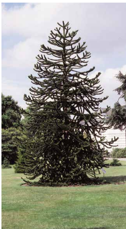
▲ Araucaria araucana (R. Rybková)

Popis druhu. Je domovem v Chile, jihozápadní Argentíně a na západních svazích And. Zde také dorůstá jako strom 30–50 m vysoko (samičí jedinci až 50 m, samčí pouze 15–18 m), ve středo- i jihoevropských