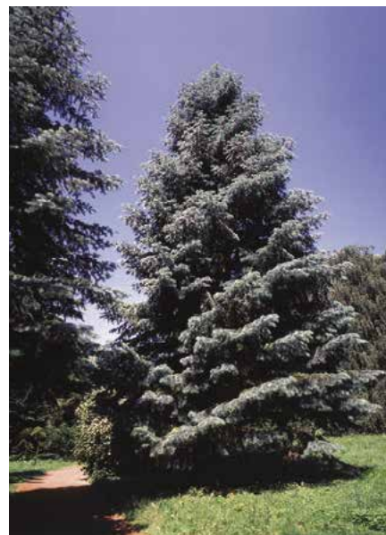
▲ Abies concolor (D. Dugas)