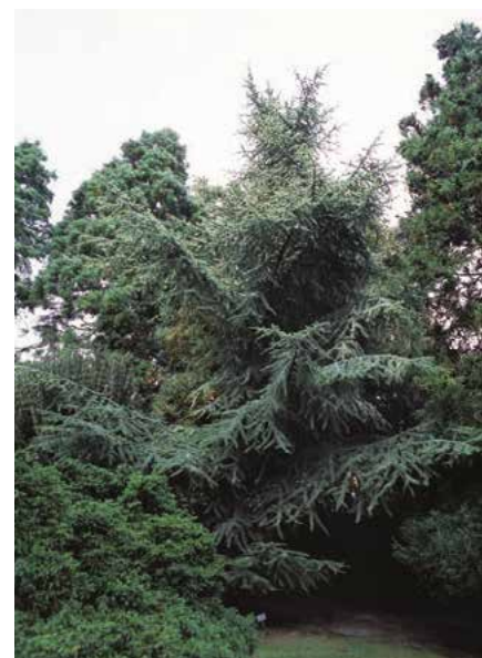
▲ Cedrus atlantica 'Aurea' (R. Rybková)

Kultivary. Poměrně bohatý sortiment zahrnuje vzrůstové i barevné výpěstky. Nejčastěji se setkáváme s kultivary: 'Albospica' (před r. 1868; mladé výhony téměř bílé), 'Argentea Fastigiata' (r. 1961; od kultivaru 'Glauca' se liší hlavně úzce kuželovitou korunou), 'Aurea' (před