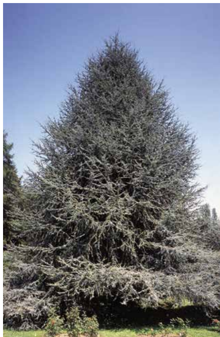
▲ Cedrus atlantica 'Glaucá' (D. Dugas)

'Aurea Robusta' (r. 1932; vzrůst kuželovitý, 10–15 m vysoký, jehlice delší, světle zelené), 'Fastigiata' (před r. 1890; vzrůst bujný, úzce kuželovitý až sloupovitý, ve stáří vzdušný, větve krátké, vystoupavé, jehlice modrozelené, rostliny 10–15 m vysoké), 'Glaucá' (vyskytuje se i na pů-