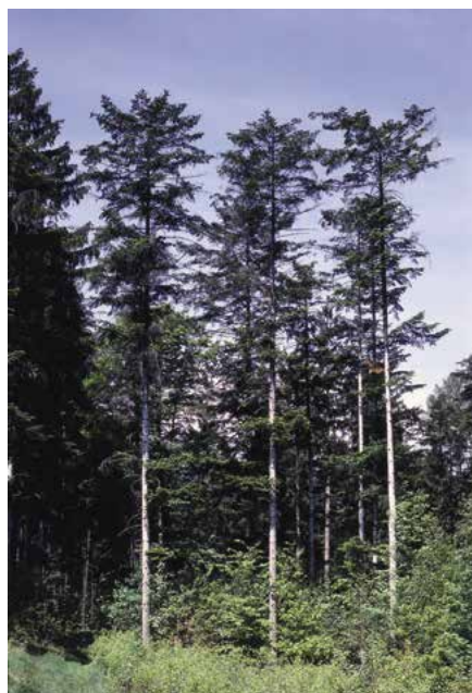
▲ Abies alba (K. Gregor)

vroubkované nebo se dvěma špičkami, 20 až 35 mm dlouhé, tmně zelené, lesklé, na rubu se dvěma bílými pruhy průduchů. Rozpadavé šišky vzpřímené, 10–14 cm dlouhé a až 5 cm silné, v mládí nazelenalé, ve zralosti tmně hnědé, šupiny 25–30 mm široké, zvenčí plstnaté. Objevují se zpravidla u stromů starších 30 let. Za příznivých podmínek plodí téměř každoročně, za horších podmínek jednou za 2–6 let. Kořeny pevné, s vyvinutým kulovým kořenem a rozvětveným postranním kořením, vlášení zpravidla s mykorrhizou.