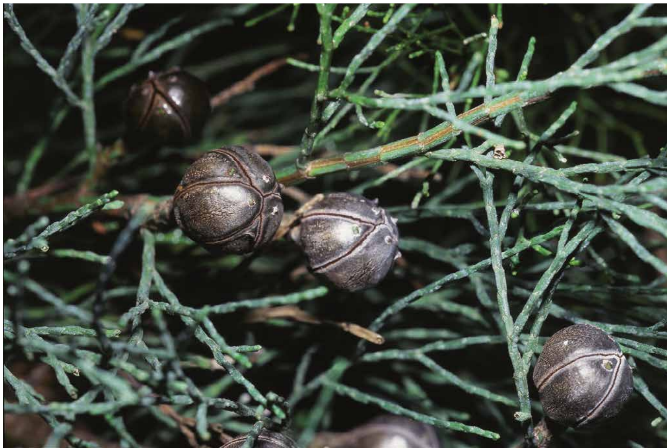
▲ Callitris muelleri – plody (R. Rybková)

Množení. Množí se výsevem a řízkováním. Bližší viz zerav západní.