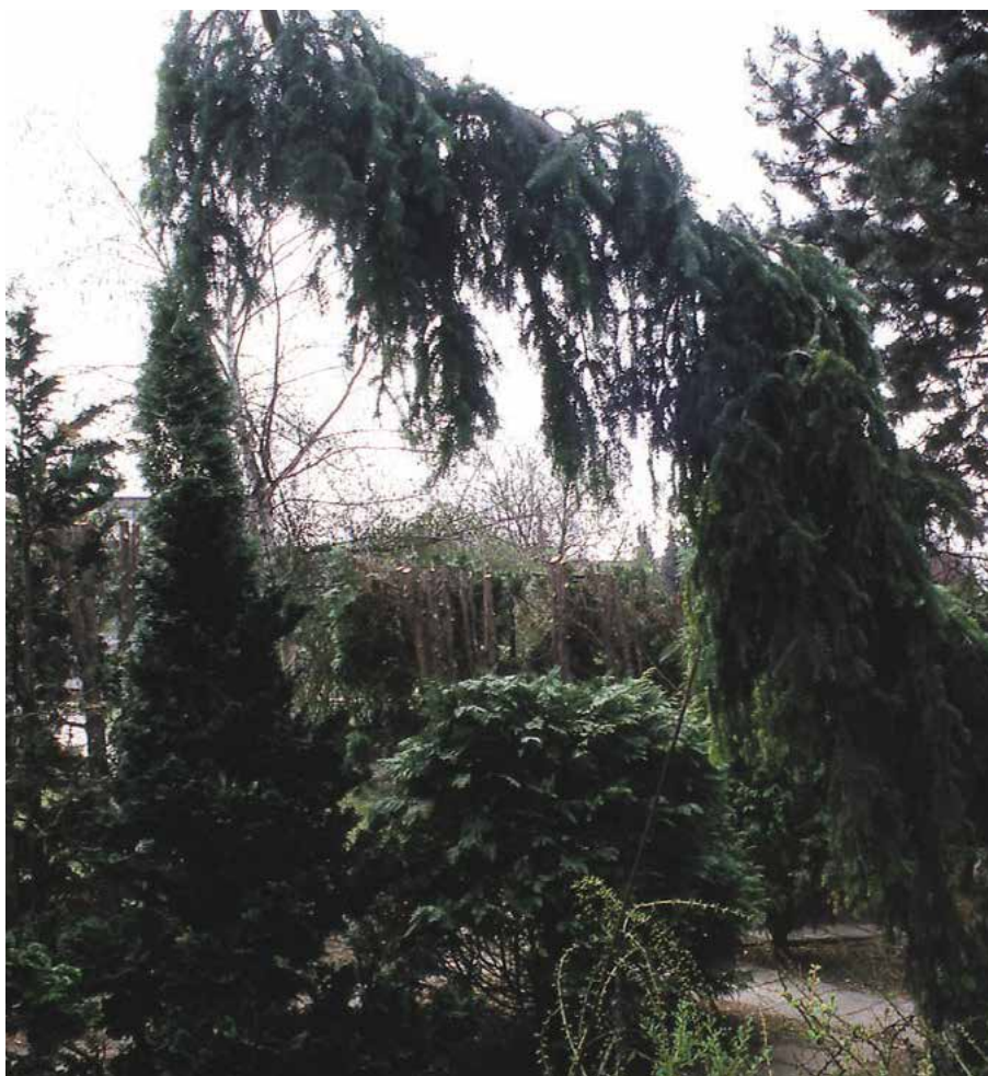
▲ Abies Alba 'Pendula' (K. Gregor)

později silně nahnutý a větve kolmo splývající), 'Pyramidalis' (r. 1850; vzrůst zpočátku přísně sloupovitý, později stěsnaně kuželovitý, 7–10 m vysoký, větve vystoupavé, výhony hustě shloučené, jehlice krátké, leskle temně zelené), 'Tenuiorifolia' (r. 1790; vzrůst normální, jehlice delší a tenčí, až 30 cm dlouhé), 'Tortuosa' (syn. A. pectinata nana , r. 1835; vzrůst zakrslý, nepravidelně keřovitý, větve stěsnaně vystoupavé, různě stočené), 'Virgata' (r. 1879; vzrůst široce sloupovitý, větve až 5 m dlouhé, splývající) aj. Na značném množství nalezených a rozmnožených WB se podíleli i čeští zahradníci, školkaři a milovníci konifer. Popis části jejich výpěstků se vymyká rozsahu této knihy a je uveden v samostatných publikacích (Hieke 2004, Šustrová, Šustr 2007). Jejich počet se každoročně rozšiřuje a má většinou význam sběratelský.