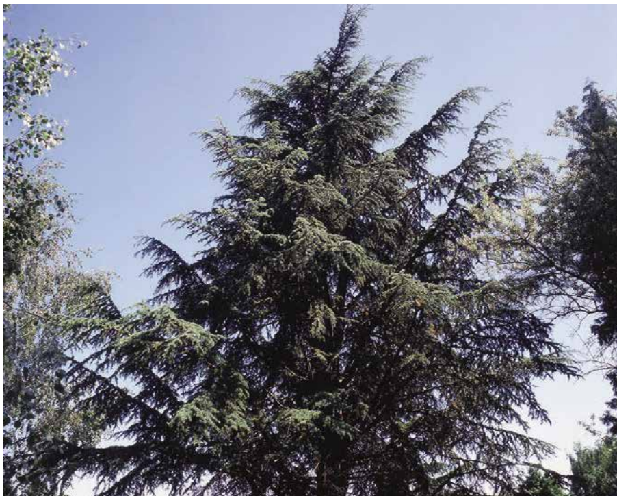
▲ Cedrus atlantica (D. Dugas)

Popis druhu. Pochází ze severní Afriky (pohoří Atlasu v Alžírsku a Maroku).