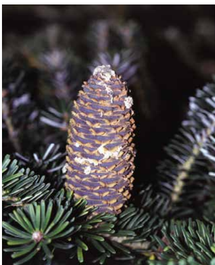
▲ Abies koreana – šiška (R. Rybková)

našedlá a drsná. Letorosty a mladé výhonky jen slabě chloupkaté, nažloutlé, později lysé a načervenalé. Pupeny téměř kulovité, červenohnědé, slabě pryskyřičnaté. Jehlice kartáčovitě nahloučené, 10–20 mm dlouhé, směrem ke špičce zpravidla širší, zaoblené či vykrojené, svrchu leskle temně zelené, na rubu bílé se zelenou prostřední žilnatinou. Šišky (VII–X), cylindrické, s krátkou zúženou špičkou, 4–7 cm dlouhé a asi 2,5 cm široké, před uzráním výrazně fialově purpurové nebo i zelené, plodové šupiny asi 20 mm široké. Semena obvejčitá, 10 mm dlouhá, fialová s purpurovými křídly. Mladé rostliny již bohatě plodí. Kořenový systém s řádným kúlovým kořenem a bohatě rozvětvenými kořeny postranními.