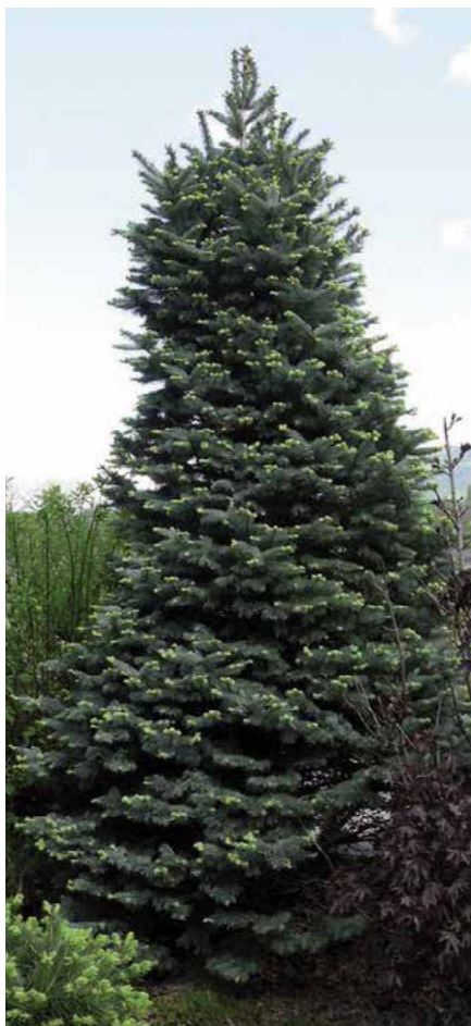
▲ Abies lasiocarpa 'Compacta'

lý, stěsnaně kuželovitý, až 3 m vysoký a asi 2 m široký, jehlice výrazně stříbřité, velmi hustě uspořádané), 'Green Globe' (r. 1979; roste pomalu, zakrsle, kuželovitě vzpřímeně, hustě zavětveně, jehlice jemné, temně zelené, 10letý exemplář asi 1,4 m vysoký), 'Kenwith Blue' (r. 1978; vzpřímený menší strom, jehlice namodrale zelené), 'Pendula' (syn. A. subalpina pendula , před r. 1909; od původního druhu se liší převislými větvemi), 'Roger Watson' (r. 1979; vzrůst zakrslý, široce kuželovitý, větve vodorovně odstávající, letorosty až 7,5 cm dlouhé, jehlice temně šedozelené, 1,5 cm dlouhé) aj.