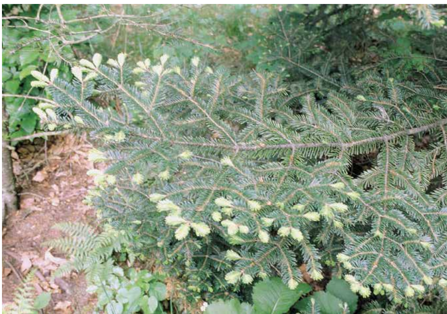
▲ Abies balsamea – detail větve (K. Gregor)

pupeny vejčité kulovité, drobné, sklovitě pryskyřičnaté. Jehlice, obzvláště u mladších stromů, kartáčovitě uspořádané, na slabších větvích i hřebenovitě rozčísnuté, 15 až 25 mm dlouhé, s lehce zaoblenou špičkou, nahoře tmně zelené, na rubu se 2 bílými pruhy průduchů, při rozemnutí voní silně balzámově. Na plodných větvích jsou jehlice kratší, strnulejší, špičatější a více nahoru stočené. Rozpadavé šišky ozdobné (VII–XI), vzpřímené, malé, vejčité válcovité, 5–9 cm dlouhé, před uzráním tmně fialové, zralé šedohnědé, nakonec silně pryskyřičné, šupiny 15 mm široké. Kořenový systém obdobný jako u jedle bělokoré. Nabodnutím pryskyřičných zduřenin kůry se získává světle žlutý, tekutý, silně lepkavý kanadský balzám.