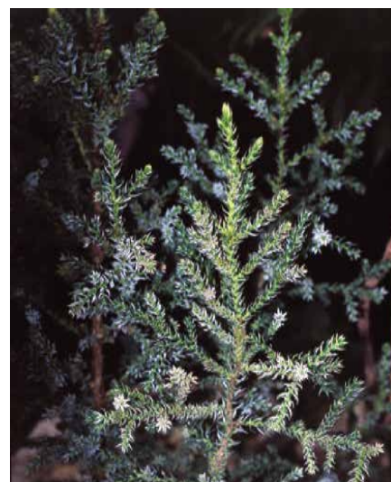
▲ Athrotaxis selaginoides – detail větévky

Biota orientalis /L./ Endlicher viz Platycladus orientalis /L./ Franco