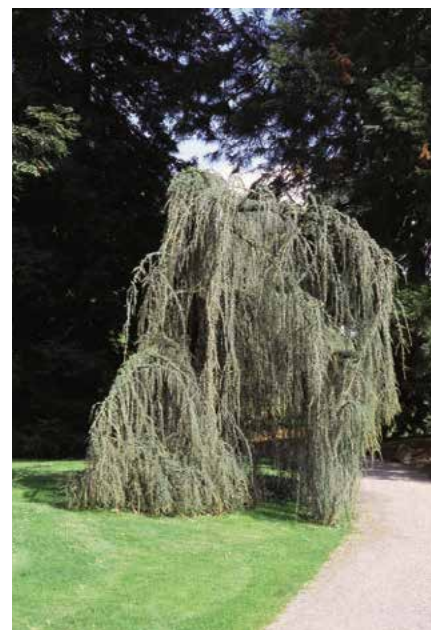
▲ Cedrus atlantica 'Glaucá Pendula' (R. Rybková)

vodních stanovištích; koruna, ve srovnání s původním druhem, hustěji zavětvená, jehlice výrazně šedomodré, při rašení obzvláště intenzivně vybarvené), 'Glaucá Pendula' (před r. 1900; kmen vzpřímeně přehýbající, 5–10 m vysoký, větve hustě rozmístěné, záclonovitě přehýslé, jehli-