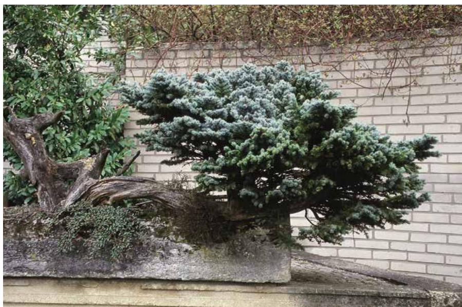
▲ Abies concolor 'Compacta' (K. Gregor)

Kultivary, formy a variety. Ojedinele se pěstuje var. lowiana /Gord./ Lemm. (syn. A. lowiana Murray – od původního druhu se liší hlavně strnulejším a pravidelnějším postavením větví, šedozelenějšími mladými větvičkami a šiš-