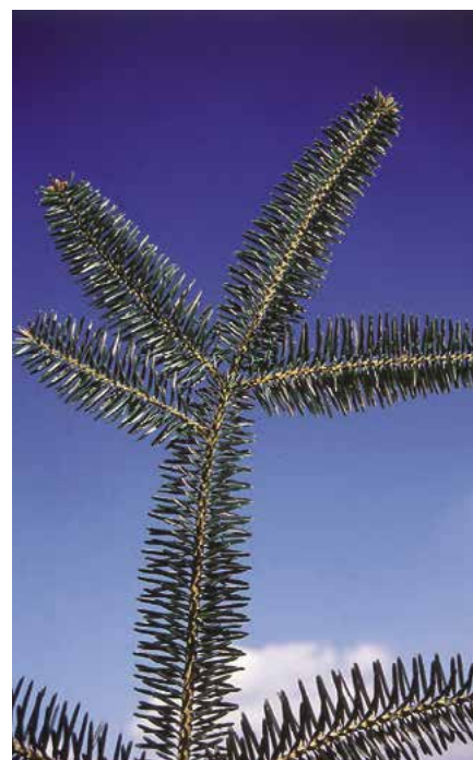
▲ Abies veitchii – detail větévky (D. Dugas)

Použití. Ideální solitéra. Uplatní se ale také v rozvolněných nebo i maskovacích skupinách. Tato jedle je ozdobná hlavně svou světle šedou borkou a stříbřitým spodkem svých jehlic. Hodí se i do středně velkých zahrad. Pěkně se vyjímá