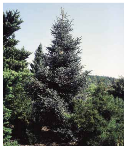
Abies pinsapo 'Glauca' (Č. Raab)

Kultivary. Nejčastěji se setkáváme s výpěstkem 'Aurea' (r. 1868; vzrůst slabší, často keřovitý, jehlice při rašení žluté, později zelené, citlivé na úpal), 'Clarke' (vzrůst zakrslý,