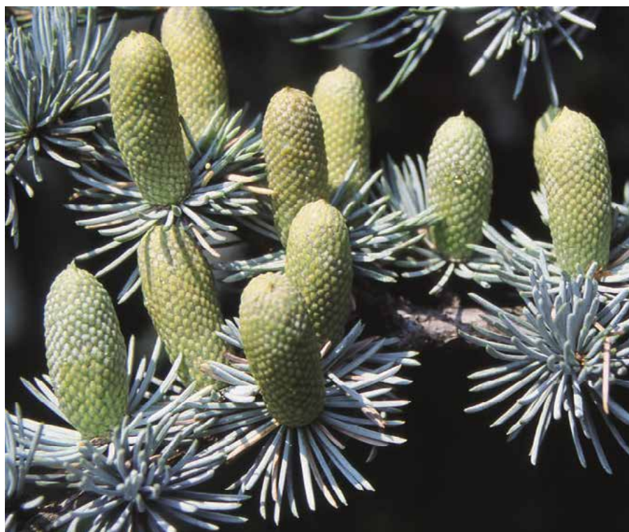
▲ Cedrus atlantica 'Glaucá' – větévka s násadou šišek (D. Dugas)