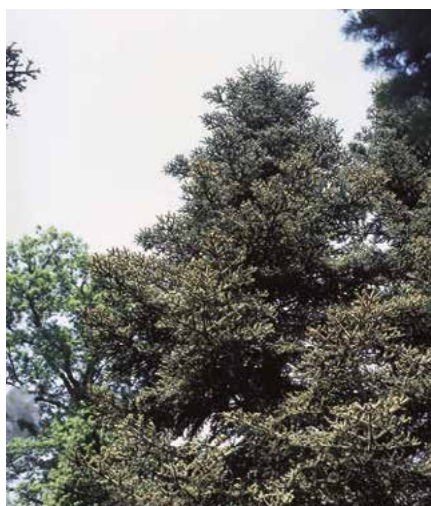
▲ Abies pinsapo (Č. Raab)

Popis druhu. Pochází z jižního Španělska. Strom až 20 m vysoký, někdy i vyšší, koruna široce kuželovitá, větve v pravidelných přeslenech. Kmen až 1 m v průměru. Ve středoevropských podmínkách jsou rozměry této