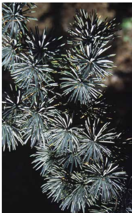
▲ Cedrus atlantica 'Glaucá' – detail větévky (D. Dugas)