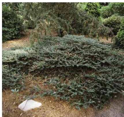
▲ Abies koreana 'Compact Dwarf' (R. Rybková)

a keřovitý, později vystoupavý, jehlice zlatožluté), 'Blauer Eskimo' (r. 1990; vzrůst slabý, v 15 letech asi 0,3 m vysoký a široký, kompaktně zakrslý, kulovitý, jehlice dlouhé, modrošedé, na rubu stříbřitě bělavé), 'Blauer Pfiff' (r. 1979; vzrůst široce keřovitý až polštářovitý, s lehce vystoupavými větvemi, jehlice šedomodré, na rubu stříbřitě, 15leté exempláře 0,8–1 m vysoké a 1,5–2 m široké), 'Blue Magic' (r. 1990; vzrůst zakrslý, vzdušný, větve šikmo vystoupavé, jehlice krátké, ocelově modré), 'Blue Standard' (r. 1962; vzrůst velmi pomalý, nepravidelný, šišky početné, zpočátku temně fialové), 'Bonsai Blue' (r. 1999; vzrůst vystoupavý, později široce kuželovitý, jehlice modrozelené, již v mládí s bohatou násadou šišek), 'Cis' (r. 1975; vzrůst zakrslý, ploše kulovitý, hustý, 10letá rostlina asi 0,3 m vysoká a 0,4 m široká, jehlice krátké, leskle temně zelené, na rubu šedobílé), 'Compact Dwarf' (syn. 'Compacta', 'Nana'; vzrůst