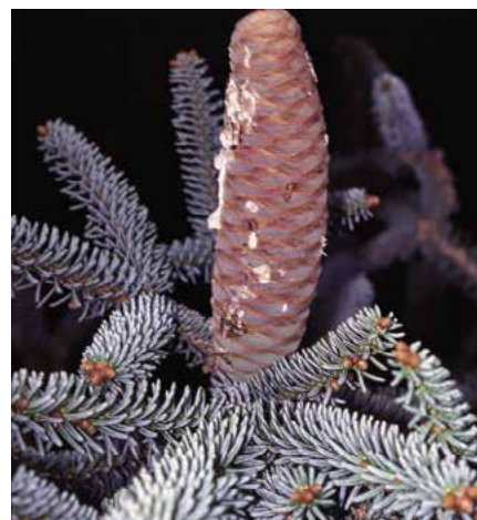
▲ Abies pinsapo 'Glauca' – šiška (R. Rybková)