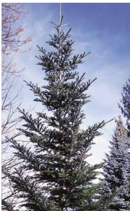
▲ Abies veitchii (D. Dugas)

Popis druhu. Je domovem ve středním a jižním Japonsku, kde roste v horských oblastech. Strom 15–25 m vysoký, koruna poměrně úzce kuželovitá, zpravidla až k zemi zavětvená. Vlastní větve krátké, vodorovně rozprostřené, s typickými kroužky na bázi. Borka šedá a hladká, ve vrcholu koruny bělavě šedá. Mladé výhony většinou červenohnědé, víceméně hustě a krátce chloupkaté. Pupeny malé, poměrně kulovité, načervenalé, průsvitně pryskyřičné. Jehlice shloučené, v horních částech koruny kolmo a dopředu postavené, v dolních partiích hřebenovitě rozčísnuté, čárkovité, 10–25 mm dlouhé, se 2 špičkami, nahoře leskle temně zelené, na rubu se svítivě bílými pruhy průduchů. Šišky (VII–X) cylindrické, 6–7 cm dlouhé, 3 cm široké, v mládí namodrale purpurové