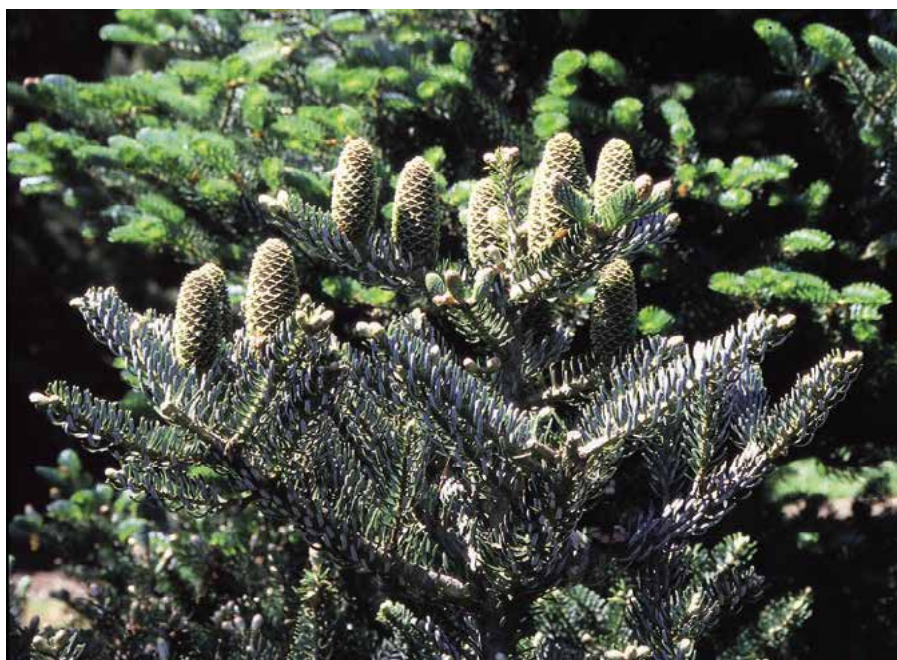
▲ Abies koreana 'Horstmanns Silberlocke' (K. Gregor)

Použití. Ve větších krajinářských úpravách se může uplatnit v polohách II, III a IV. Pro své nápadné a početné šišky nachází upotřebení hlavně v zahradách, átriích, skalkách, vřesovištích a mobilní zeleni. Ideální je umístění pro pozorování zblízka (poblíž budov, cest, teras, odpočívadel apod.). Je dřevinou vyloženě solitérní, ale zajímavé jsou i některé kombinace s trvalkami (u zakrslých kultivarů např. s brambořky, dlužichami, u stromovitých tvarů s plošticníkem apod.).