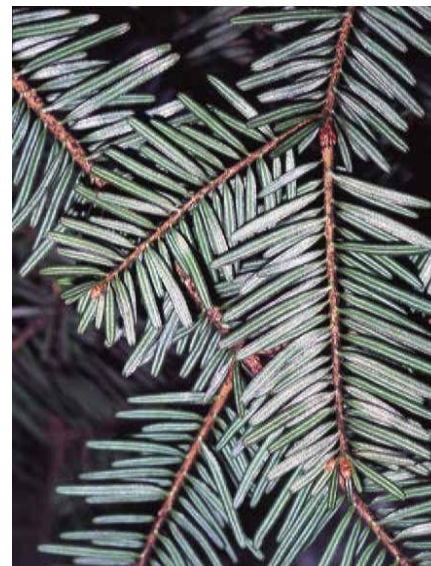
▲ Abies alba – rub jehlic (R. Rybková)