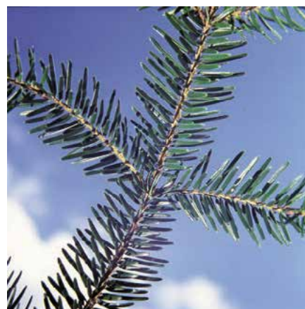
▲ Abies cephalonica – detail větvy (D. Dugas)

(syn. A. reginae-amaliae Heldr., A. panachaica Heldr.)