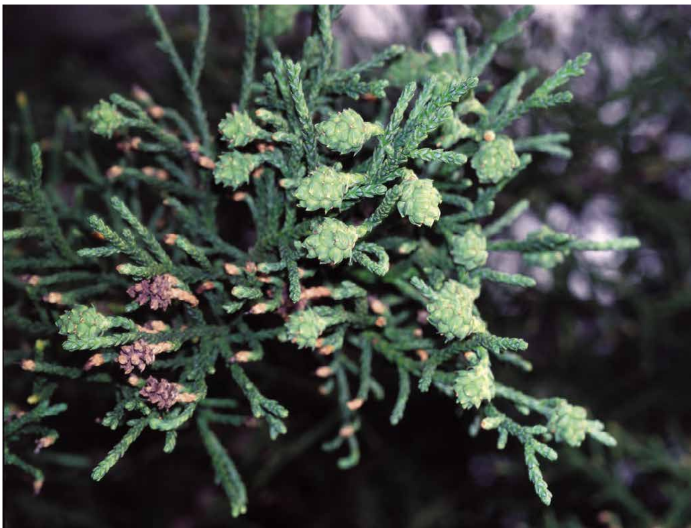
▲ Athrotaxis laxifolia – detail s plody (R. Rybková)