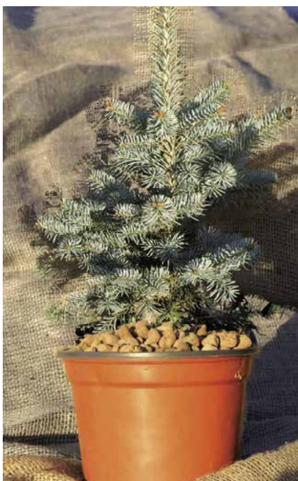
▲ Abies lasiocarpa 'Compacta' – mladá rostlina (T. Horák)