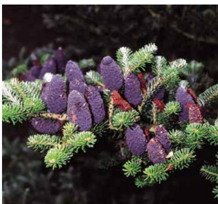
▲ Abies koreana – detail větve se šiškami (R. Rybková)