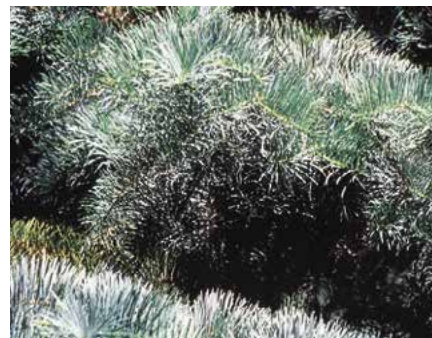
▲ Abies concolor – detail větve (D. Dugas)