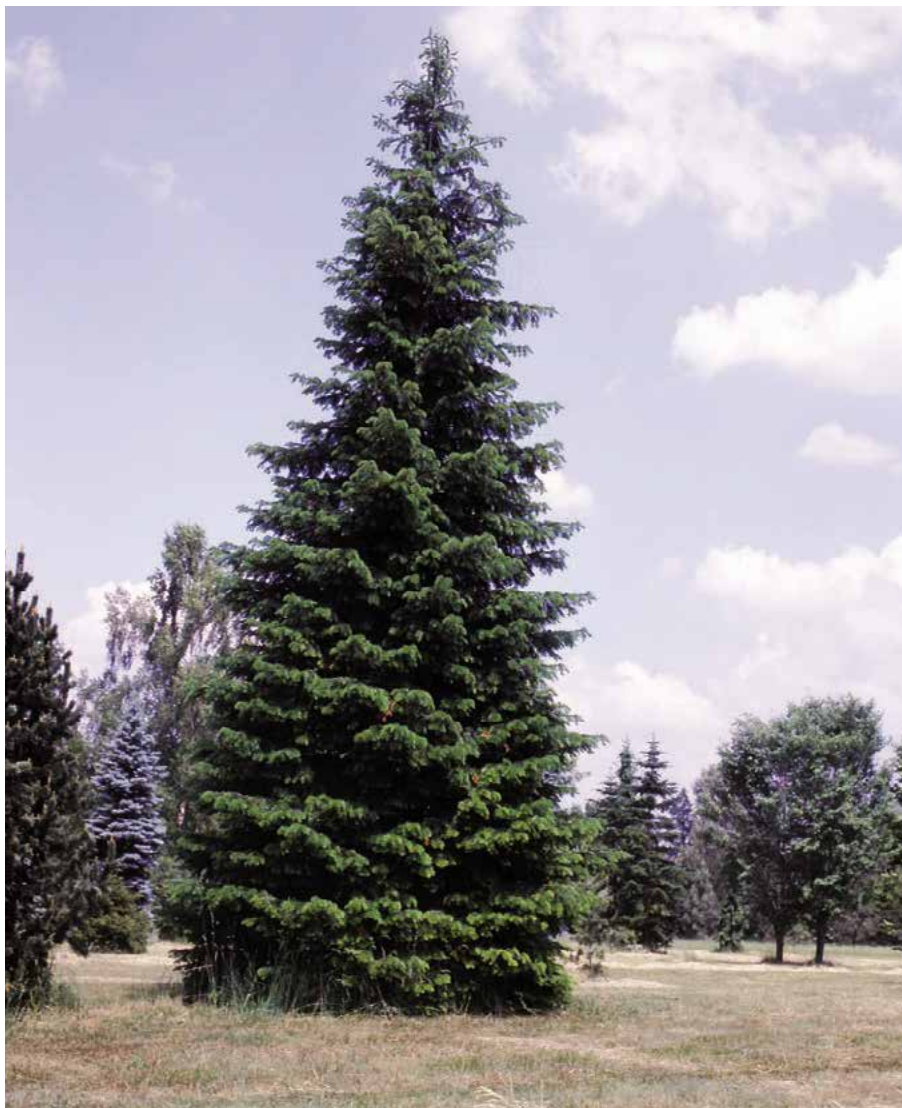
▲ Abies grandis (H. Atanasová)

Nároky. V našich podmínkách je mrazuvzdorná. Miluje vlhké ovzduší, světlé stanoviště. Ideální je půda humózní, vlh-