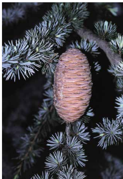
▲ Cedrus atlantica 'Glaucá' – šiška (R. Rybková)

vodních stanovištích; koruna, ve srovnání s původním druhem, hustěji zavětvená, jehlice výrazně šedomodré, při rašení obzvláště intenzivně vybarvené), 'Glaucá Pendula' (před r. 1900; kmen vzpřímeně přehýbající, 5–10 m vysoký, větve hustě rozmístěné, záclonovitě přehýslé, jehli-