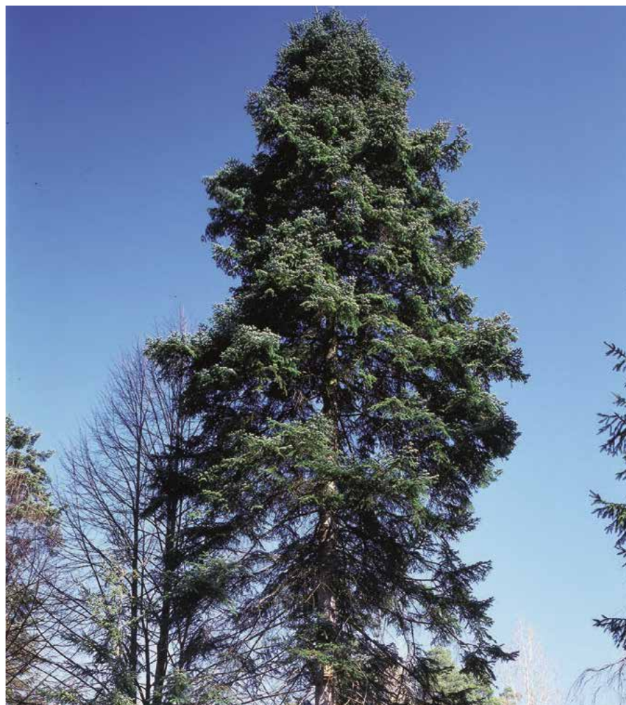
▲ Abies nordmanniana – starší strom (D. Dugas)

Kultivary. Známe hlavně výpěstky 'Aurea' (před r. 1891; strom, jehlice zlatožluté), 'Aureospica' (před r. 1891; vzrůst nepravidelně stromovitý, jehlice zelené se zlatožlutou špičkou), 'Aureovariegata' (před r. 1903; jehlice některých větví zcela nebo částečně zlatožluté), 'Barabits Compact' (r. 1985; vzrůst zakrslý, plochý, větve vodorovné až lehce dolů ohnuté, jehlice světle zelené, řídce uspořádané), 'Compacta' (r. 1867; vzrůst