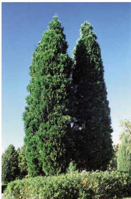
▲ Calocedrus decurrens (D. Dugas)

Popis druhu. Pochází ze Severní Ameriky (Oregon až Nevada a Kalifornie), kde roste ve vlhčích údolích, zejména spolu s Abies concolor a dalšími dřevinami. Vytváří stromy až 45 m vysoké, ve středoevropských podmínkách poněkud nižší (do 30 m). Dorůstá poměrně rychle, ve 20 letech je 8 až 10 m vysoký, v 50 letech 16–20 m. Koruna je téměř sloupovitá, ale u starších exemplářů nepravidelná. Větve dosti krátké a odstáva-