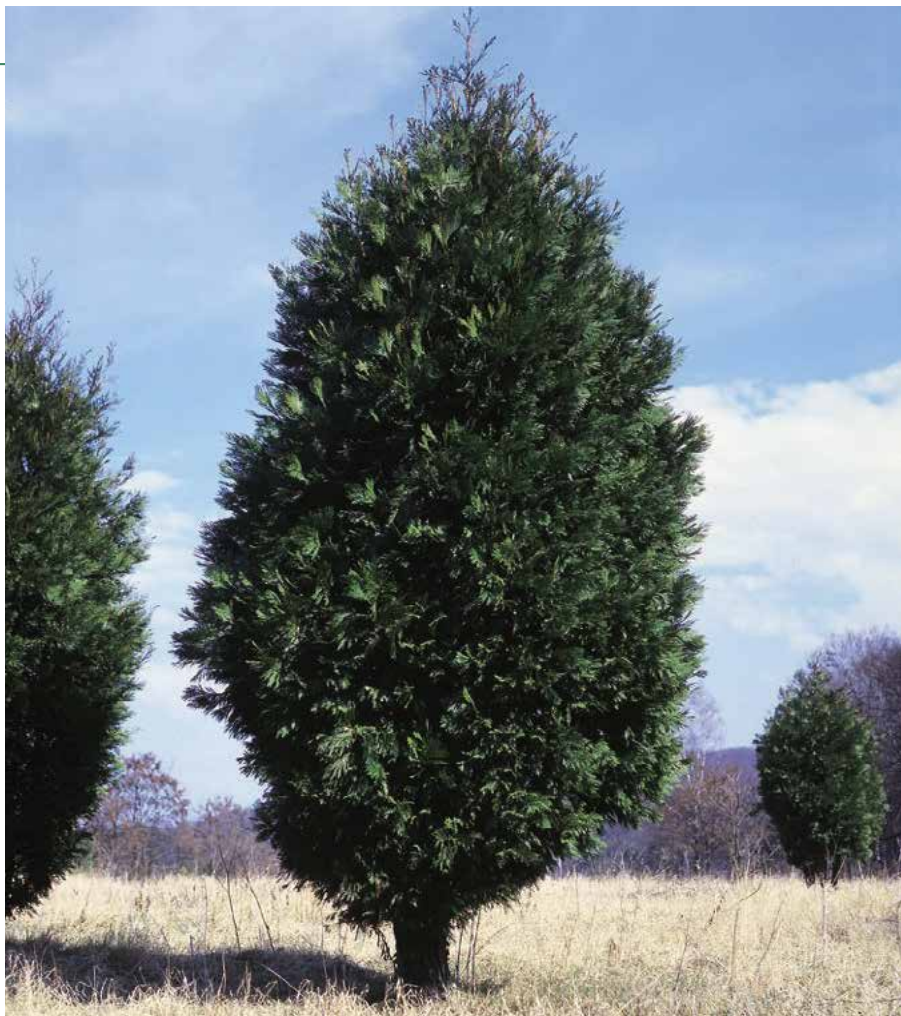
▲ Calocedrus decurrens – mladší solitérní rostlina (D. Dugas)

jící, ve stáří nápadně etážovitě uspořádané. Větévky silně zploštělé, oboustranně temně zelené. Kmen přísně rovný, pokrytý světle