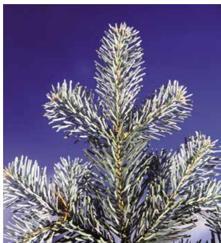
▲ Abies lasiocarpa – detail větévky (D. Dugas)

Popis druhu. Pochází ze Severní Ameriky (Aljaška až Oregon, Utah a Nové Mexiko), kde roste pouze ve vysokých horách blízko hranice lesa, asi 1 200 až 2 600 m n. m. Vytváří až 30, někdy i 40 m