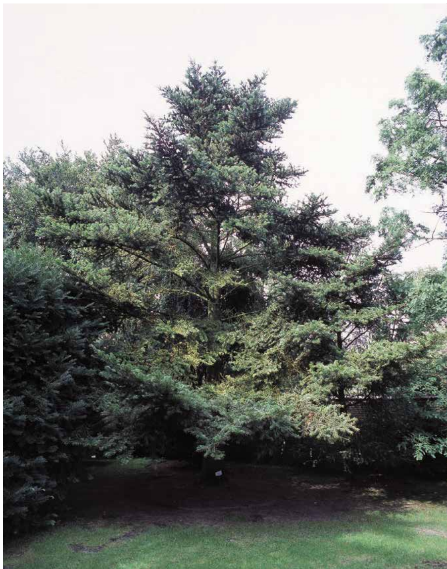
▲ Abies firma – mladší rostlina

Množení. V Japonsku se množí hodně řízkováním. Další viz jedle kavkazská a bělokorá.