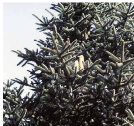
▲ Abies pinsapo 'Glauca' – část koruny (Č. Raab)

20letý exemplář asi 1 m vysoký), 'Fastigiata' (před r. 1868; sloupovitý tvar, větévky krátké, v ostrém úhlu vystoupavé), 'Glauca' (před r. 1867; jehlice nápadně namodrale zelené