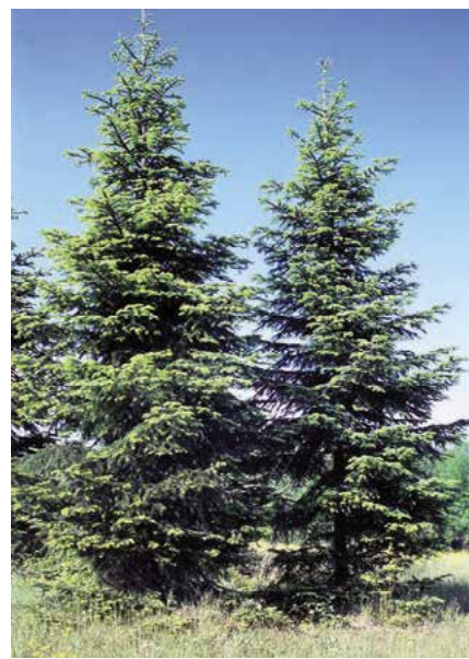
▲ Abies balsamea (D. Dugan)