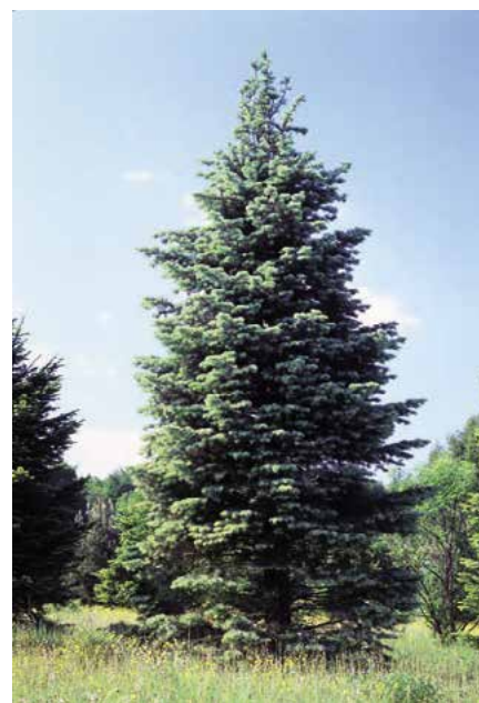
▲ Abies concolor (D. Dugas)

Popis druhu. Domovem v jihozápadní části USA až po severní Mexiko. Strom vysoký 25–40 m, zavětvený až k zemi, větve v přeslenech, vodorovně odstávající, koruna široce kuželovitá. Kůra světle šedá, drsná, mladé větévky šedozelené až olivově zelené, téměř lysé. Pupeny kulovité, pryskyřičnaté. Jehlice nestejně, většinou srpovitě nahoru postavené, čárkovité, 40 až 60 mm dlouhé, 2–2,5 mm široké, špičaté