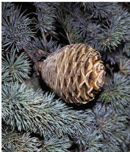
▲ Cedrus atlantica – šiška (R. Rybková)

Strom až 40 m vysoký, roste pomalu, ale i ve středoevropských podmínkách dosahuje úctyhodných rozměrů. Koruny mladších jedinců jsou štíhlejší (větve směřují poněkud nahoru), později jsou až deštníkovitě či kuželovitě rozkladité. Vrcholový výhon vzpřímený nebo lehce