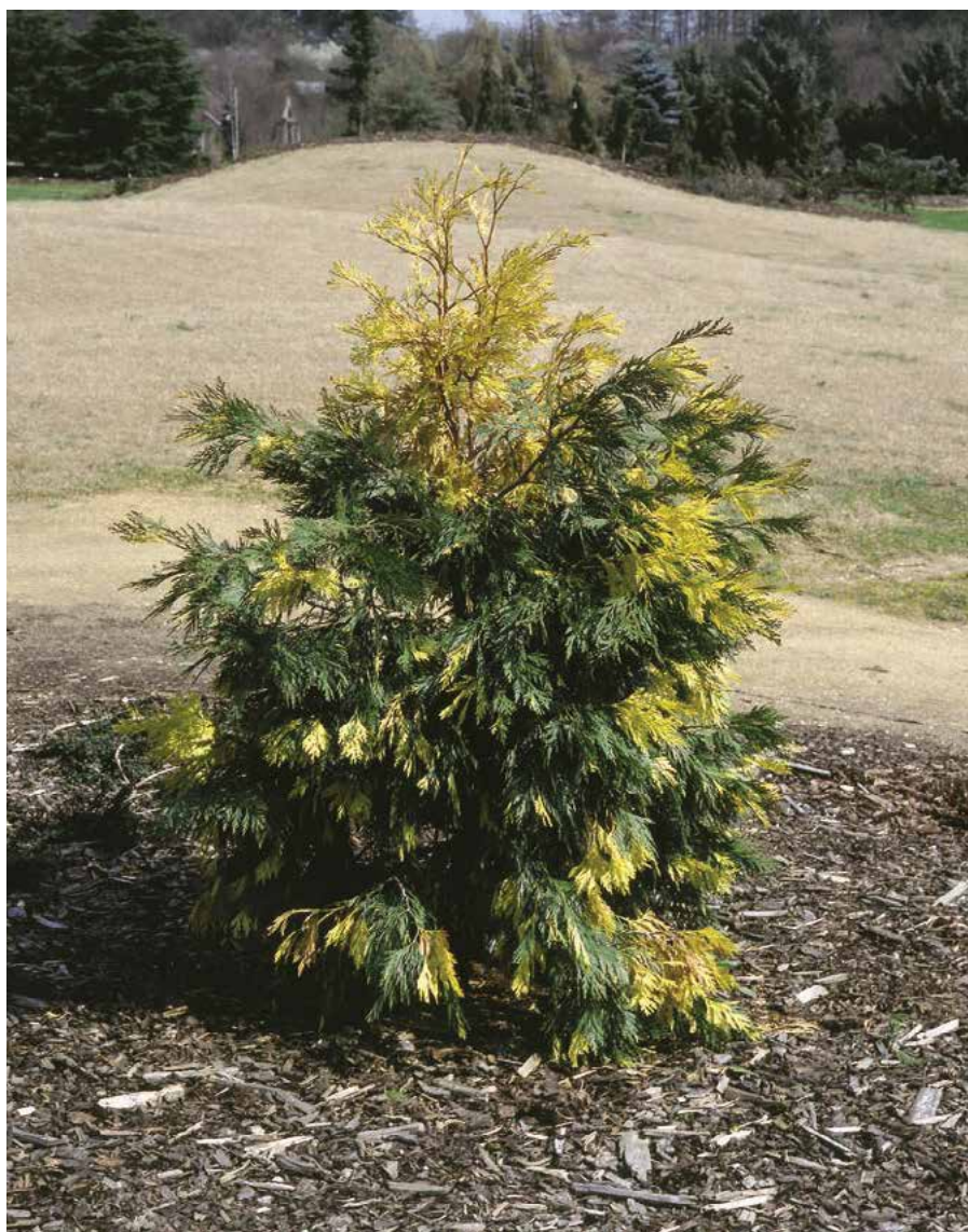
▲ Calocedrus decurrens 'Aureovariegata' (R. Rybková)

Použití. Pěstuje se poměrně vzácně, hlavně jako nápadná solitéra. Patří snad mezi nejvyšší stálezelené sloupovité stromy, které lze ve středoevropských podmínkách pěstovat. Ve větších sadovnických úpravách vyniká