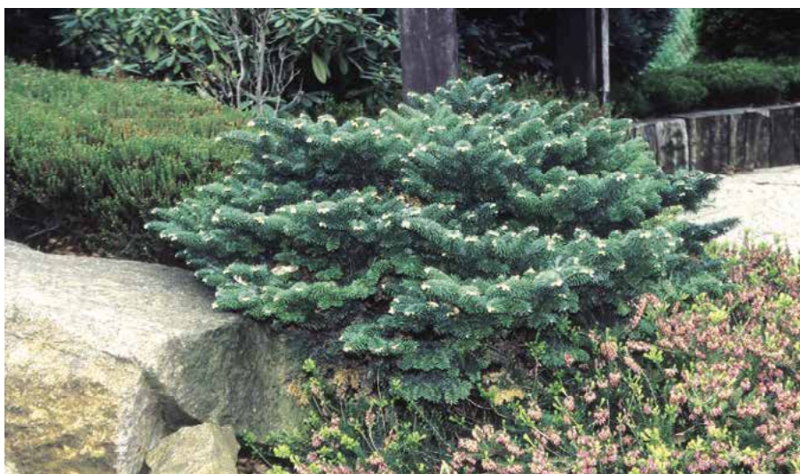
▲ Abies balsamea 'Nana' (Č. Raab)

Kultivary a formy. Nejznámější je výpěstek 'Andover' (r. 1957; vzrůst nízký, netvoří kmen, větve daleko rozprostřené, až 5 m široké, dorůstá pomalu, jehlice jako u původního druhu), 'Coerulescens' (kolem r. 1865; vzrůst statný, jehlice velmi hustě uspořádané, 6–10 mm dlouhé, oboustranně s namodralými pruhy průduchů), 'Columnaris' (syn. 'Pyramidalis', před r. 1903; vzrůst statně sloupovitý, větve krátké, jejich vrcholy vzpřímené, jehlice jen 5 mm dlouhé, hustě uspořádané), f. hudsonia (vysokohorský typ, široce zakrslý, větve velmi hustě uspořádané, jehlice krátké, široké), 'Nana' (syn. A. bal-