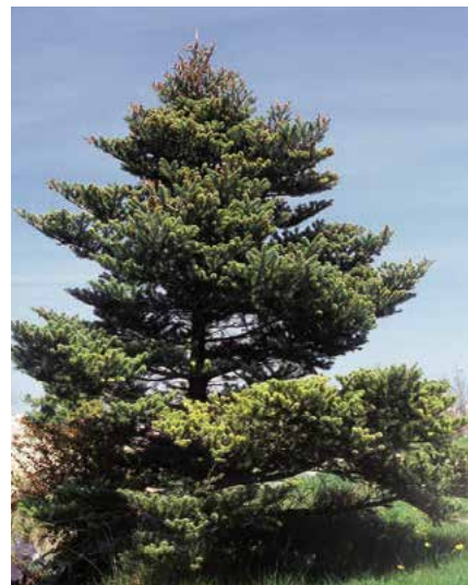
▲ Abies koreana (D. Dugas)

Popis druhu. Domovem v jižních pohořích Koreje 1000–1800 m n. m. Vytváří 4–7 (–15) m vysoké a 3–4 m široké, pomalu do-