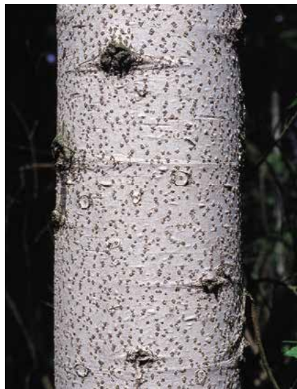
▲ Abies alba – detail kmene (K. Gregor)

Stálezelené, vysoké, kuželovité stromy, větve převážně v přeslenech odstávající. Borka starších stromů silná, u mladých jedinců většinou hladká, pupeny často pryskyřičnaté, kulaté, vejčité až vřetenovité. Jehlice obvykle rozčísnuté nebo kartáčovitě postavené, převážně ploché, tmně zelené, se stříbřitě bílými až namodralými proužky průduchů, někdy i na svrchní straně. Květy jednodomé. Samčí květy jednotlivě v paždí horních jehlic, samičí jednotlivě, vzpřímené, vejčité až válcovité, složené z četných plodových šupin. Šišky vzpřímené, vejčité podlouhlé až válcovité, po uzrání se až na vřeteno rozpadají. Semena křídlatá. Známé asi 40 druhů v severním mírném pásmu, dále v severní Africe a v Himálajích.