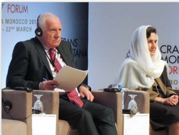
Manželka prezidenta Afghánistánu věří v lidská práva

prezident Bosny a Hercegoviny a za mnou poslanec rakouské Strany svobodných (FPÖ). O kus vedle seděla velmi angažovaná (jak ukázala ve svém projevu) první dáma Afghánistánu. To je jenom náznak struktury účastníků. Jak se ukázalo, nejdelší cestu měl člen vlády Solomon Islands – 33 hodin.