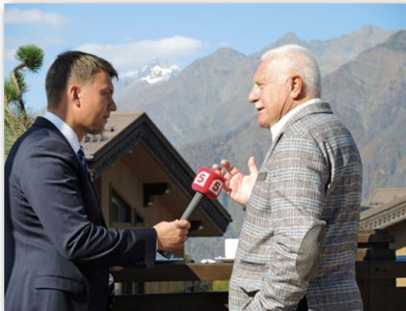
Jedno z desítek interview, která jsem v průběhu fóra poskytl

informací“, „médiá jsou komunikační zbraň přinášející velmi poškozenou (distorted) realitu do myslí stamiliónů lidí“. Toto byl – zkráceně vyjádřeno – zcela dominantní názor. Díky tomu nastává „éra renesance mýtů“. Zdánlivá diverzifikace (a demokratizace) médií lidskou společnost více rozděluje, než spojuje.