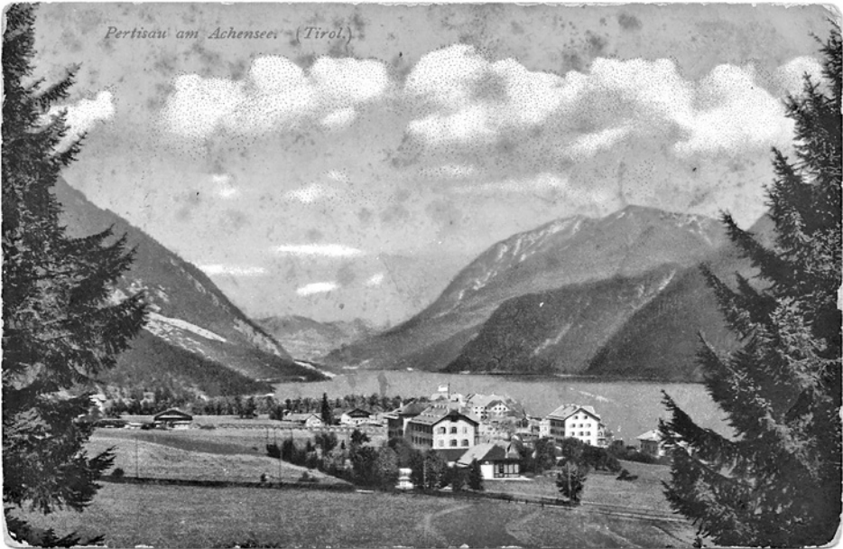
Pohled poslaný Fandě z Hallu 6. srpna 1915 (archiv J. Pavelkové).

3. srpna. Velký Gefechtsübung (válečné manévry) směrem k Innsbrucku. Proti