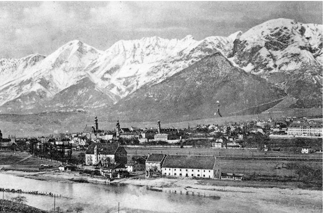
D. F.!! Dnes ráno nás již oblékli. Tak začíná tato pohlednice poslaná Fandě z Hallu 24. června 1915 (archiv J. Pavelkové).

vypadám! Oblékl jsem se do toho, co nám hodili na hromadu. Kalhoty dlouhé, blůza veliká, že mi rukávy přechnívají, a kolem krku to mám jako žena výstřih. Výměna prý není dovolena. Proto upevňuji dlouhé nohavice pásky, tzv. hosenšpanglami, rukávy v zápěstí – obyčejným provázkem, abych dostal ruce na světlo. Hotový strašák do zelí. Je to však c. k. uniforma, a proč se tedy za to stydět? I jednoručácké pásky jsem si na balónovité rukávy našil.