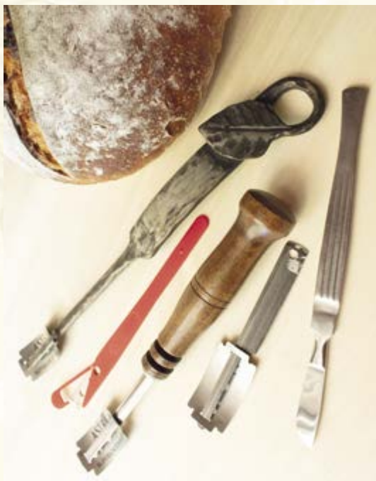
Skalpel a různé držáčky na žiletky, se kterými pečivo před pečením nařízneme

Na tvarované chleby a placky užijete váleček na těsto , dalaťanky můžete formovat jako malé chlebičky nebo jim dát jiný tvar raznicí .