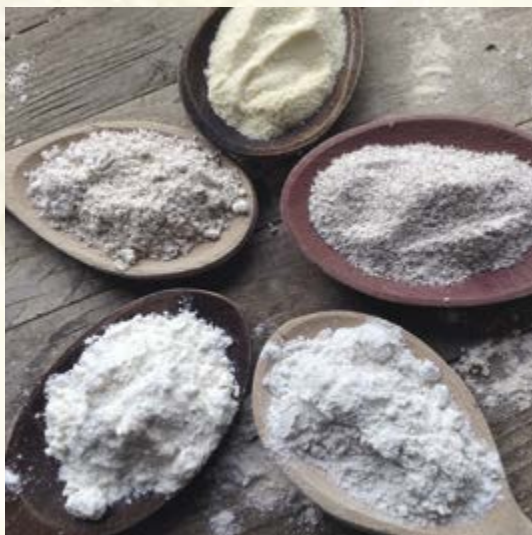
Chléb lze upéct z různých druhů mouk

První a dominantní místo zaujímá při pečení chleba mouka pšeničná , protože je vhodná prakticky na všechny druhy chlebových těst. Hned v „závěsu“ za ní je mouka žitná .