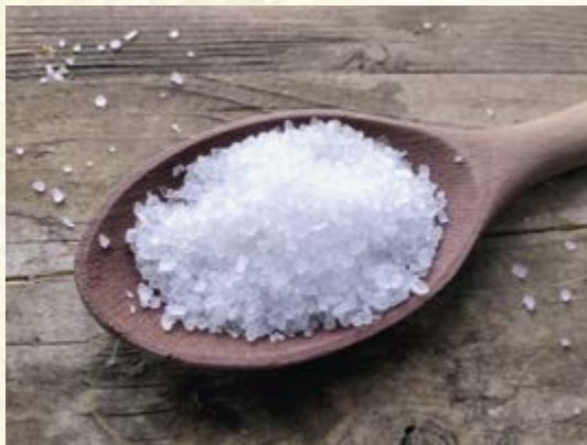
Sůl do těsta přidávejte opatrně

působí na kvasinky příznivě, neboť je dráždí a povzbuzuje k vyšší činnosti.