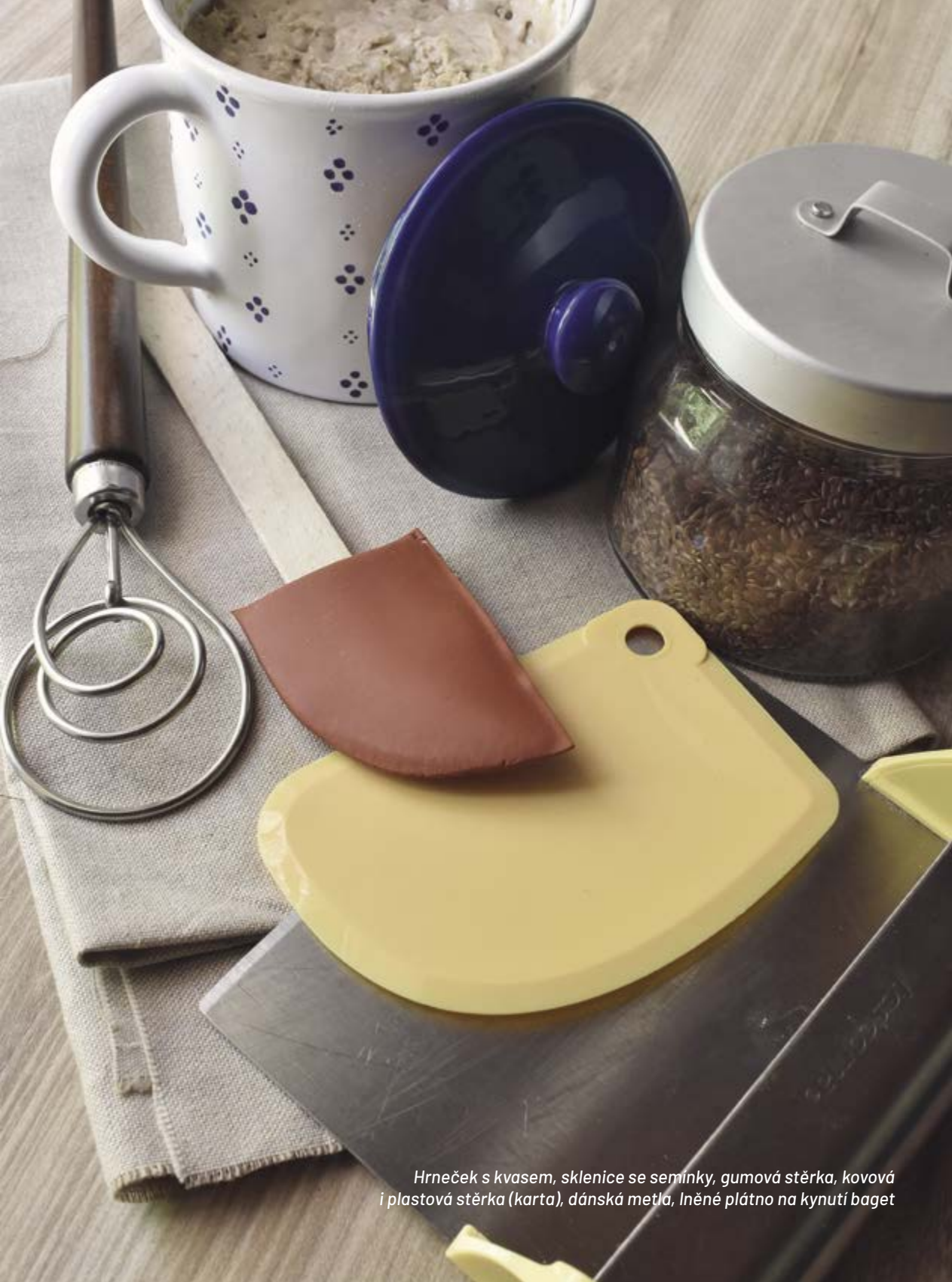
Hrneček s kvasem, sklenice se semínky, gumová stěrka, kovová i plastová stěrka (karta), dánská metla, lněné plátno na kynutí baget