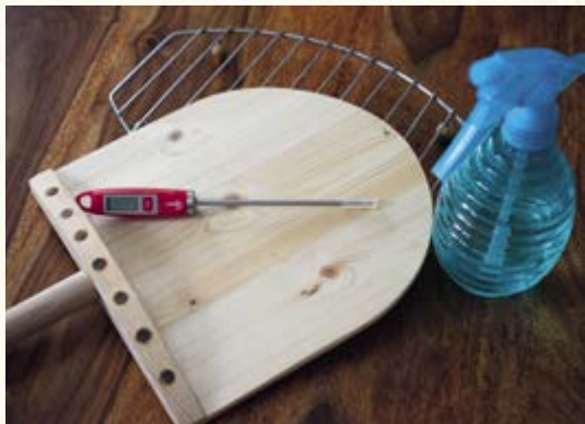
Sázecí lopatka (vyrobil František Žalud), rozprašovač vody, vpichový teploměr a kovová mřížka na chladnutí pečiva

Vyrobíme ji například tak, že spolu s troubou nahřejeme starší plech , uložený na dně trouby, kam po vsazení bochníku na kámen vlijeme menší množství horké vody. Okamžitě se vytvoří velké množství páry, proto je potřeba dát pozor na opaření. Plech by měl být opravdu starší, protože se častým používáním na výrobu páry ničí.