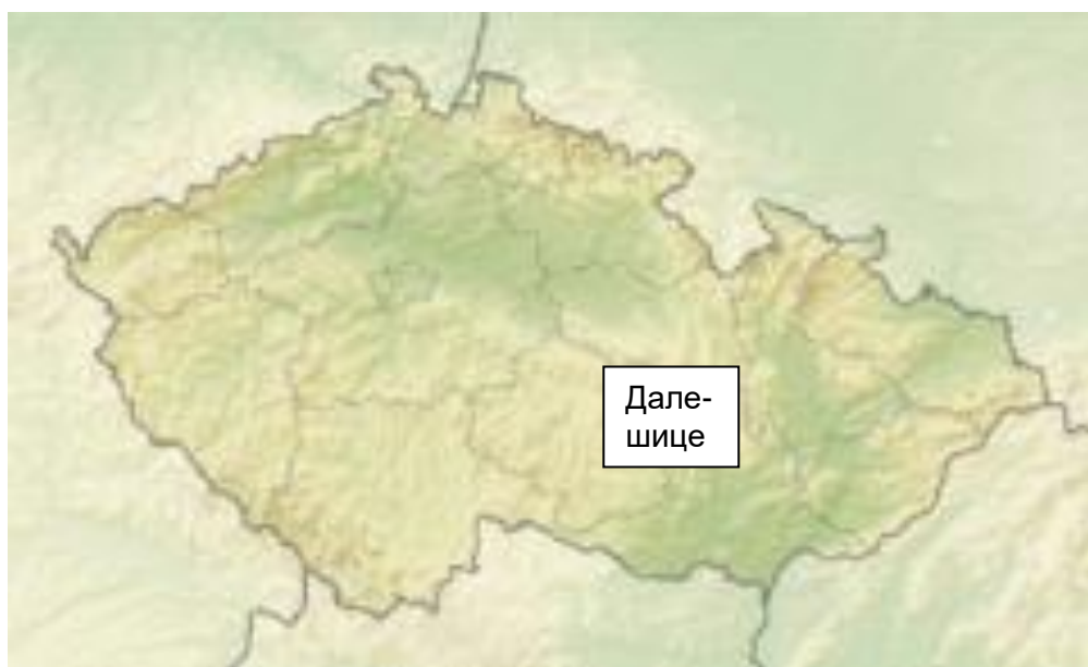
Далешницкая плотина на реке Йиглава в Чешской Республике.