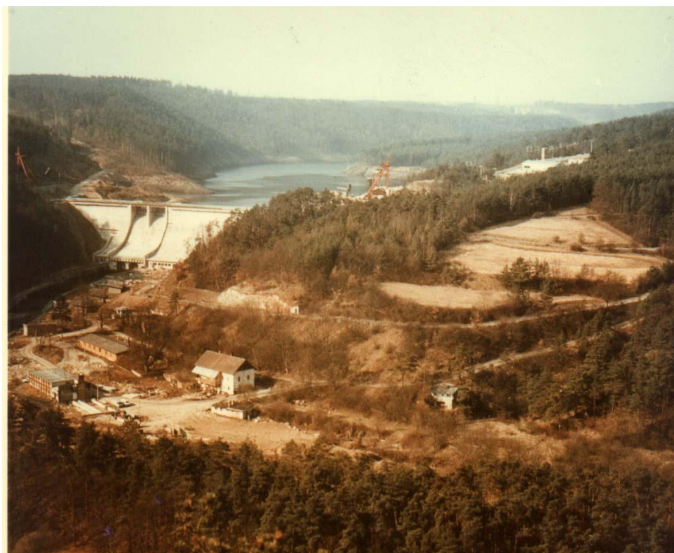
Насосная станция Далешнице работает вместе с нижней плотиной Мохельно.

В заключение работы приводится сравнение с требованиями проектировщика достигнутых результатов, опирающихся на современные возможности использования новейших методов испытания действия и поведения плотины в содействии с горным массивом при помощи методов математического моделирования и реальных геотехнических моделей.