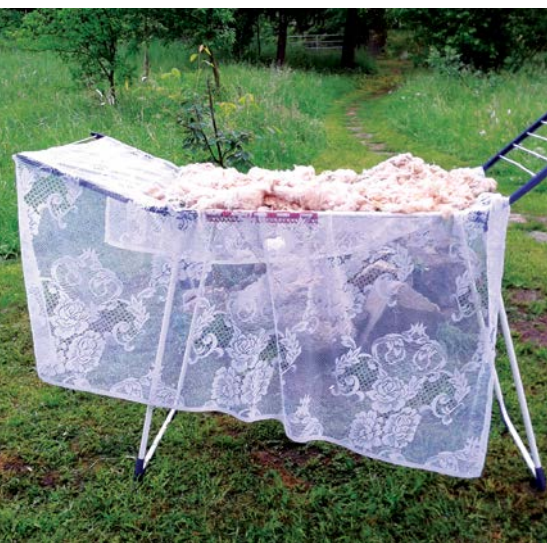
Sušení vyprané ovčí vlny na sušáku na prádlo