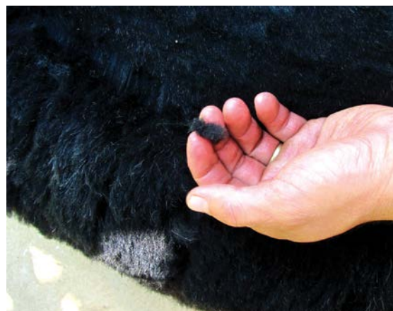
Přestřížky z vlněného rouna odstraňte

Ta nejjemnější vlna s krátkou hebkou podsadou se používá k výrobě pleteného oblečení, k výrobě plstěného sukna, vlna s nejdelším vlasem naopak na pevnou osnovu a tkaní lesklých hladkých látek, vlna hrubšího charakteru pak na pokrývky, koberce, podrážky a papuče.