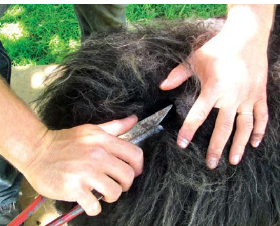
Začátek stříže od pravé zadní končetiny k hlavě