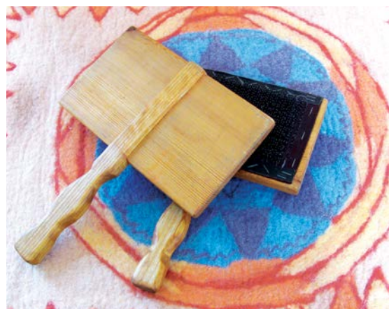
Kartáče na česání vlny zvané krample

Způsobů, jak česat na kramplích, je několik – liší se od kraje ke kraji. Nelze říci, který způsob je nejlepší, já uvádím pro inspiraci dva způsoby, které se mi osvědčily a které také různě střídám podle dané situace.