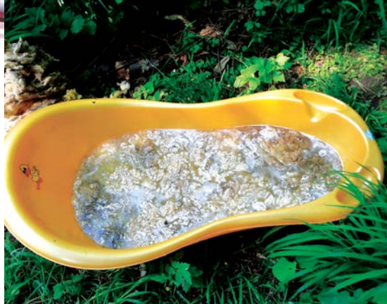
Praní vlny v dětské vaničce za pěkného dne v přírodě