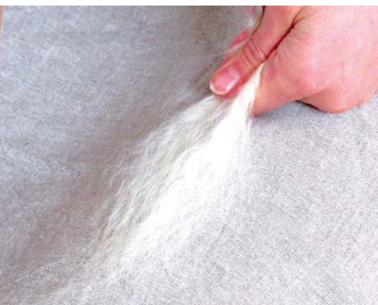
Rozčesaná vlněná vlákna