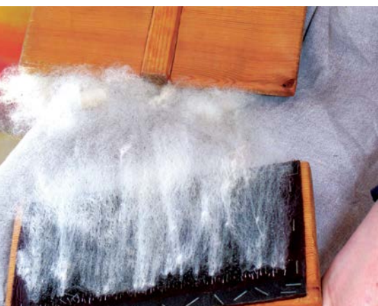
Část vláken se přichytí na horní kramplí