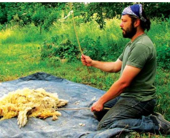
Šlehání ostříhané ovčí vlny lískovými pruty