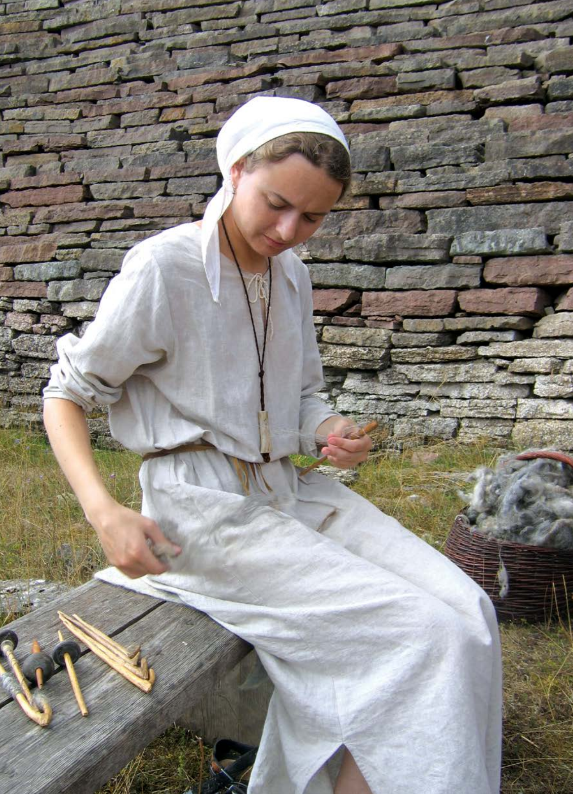
Přádelna z pevnosti Eketorp, Švédsko