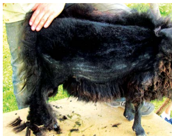
Ostříhaný pravý bok ovečky