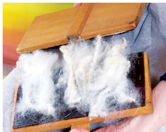
Naskládání vlny na spodní krampli