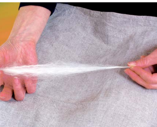
Dlouhý pramen vhodný k předení pevné přize

Při větším množství vlny je výhodné si opatřit česací hřebeny nebo si nechat vlnu strojově načesat. Česací hřebeny, tradiční zejména v západní Evropě, připomínají vychle na česání lnu, ale s tím rozdílem, že mají užší a delší hroty, a to pouze v jedné řadě vedle sebe podobně jako hrábě.