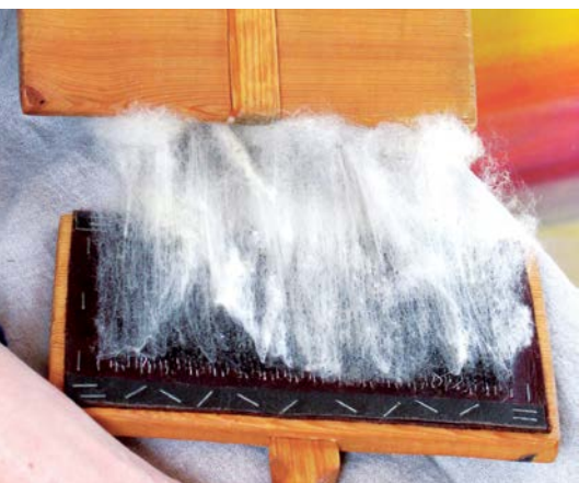
Vlákna se postupně vytahují a rozčesávají