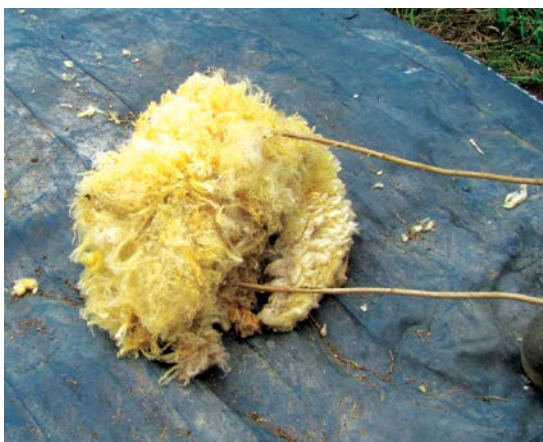
Na podložce jsou vidět prach a nečistoty uvolněné z rouna

Dalším jednoduchým prastarým způsobem je šlehání vlny, které je doloženo v Evropě již v období středověku. Ovčí nevyprané rouno se položilo na plachtu nebo na jinou podložku, a rytmickým šleháním lískovými pruty, nebo motouzy, se promíchávalo, rozvolňovalo, načechrávalo a čistilo tak od prachu a nečistot, které zůstaly ležet na zemi.