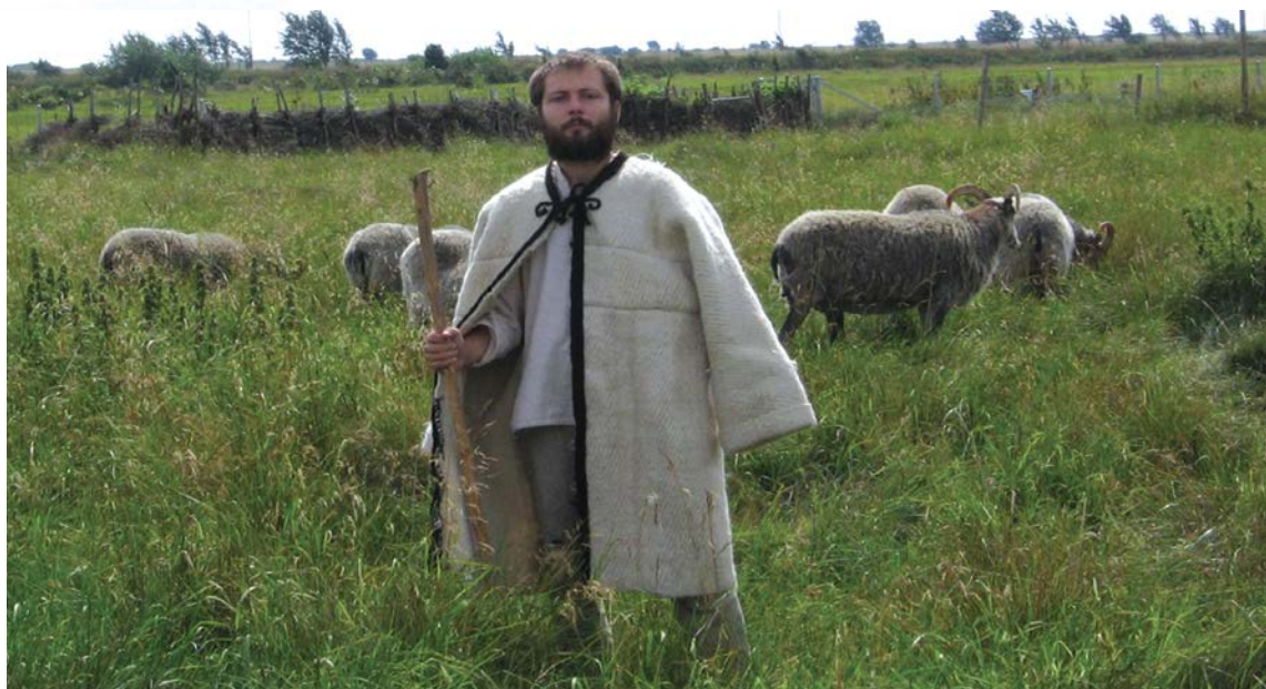
Pastevecký kabát (tzv. guba) utkaný z ručně předené příze

Typickými vlnářskými plemeny, chovanými také u nás, jsou anglická dlouhovlnná plemena Romney a Leicester nebo Shetlandské ovce s jemnou zkadeřenou vlnou, ze které se vyrábí tradiční anglické tvídy. Za naše původní vlnářská plemena se považuje ovečka Šumavská a Valaška.