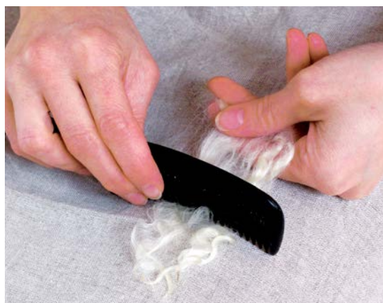
Česání vlny s dlouhými vlákny hřebenem