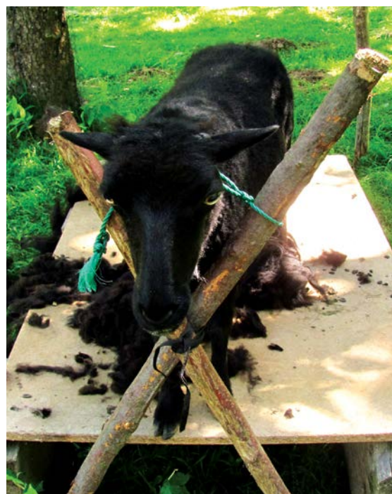
Ostříhaná ovečka. Moc rádi s mužem pozorujeme, jak se ostříhaná ovečka rozeběhne po pastvině k druhé ovečce, která ji ale nepoznává a trká ji.