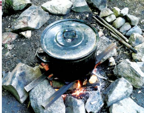
Voda se může ohřívát na ohni, na kterém si můžete po práci za odměnu opéct třeba špekáčky.