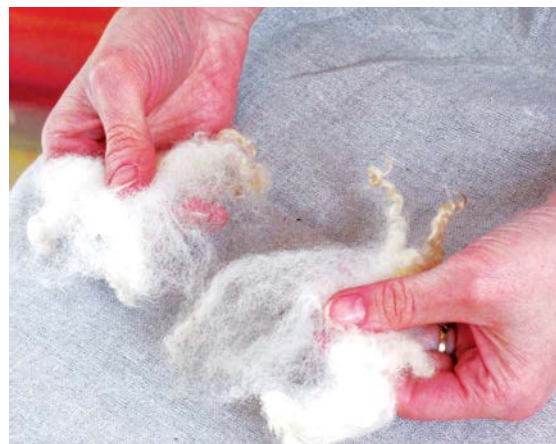
Rozvolňování vlny mezi prsty