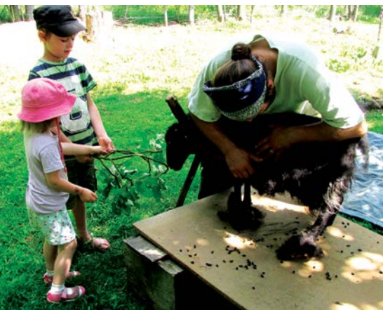
Ovečka je při stříhu klidná a děti ji odměňují větvičkou