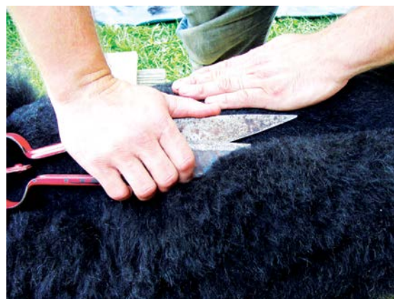
Nůžky držíme co nejvíce k tělu, druhou rukou napínáme kůži