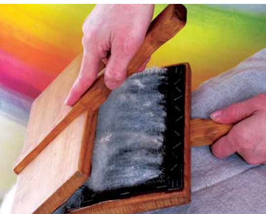
Přemístění vlny z jedné na druhou kramplí – 1. způsob

1. Kramplujte nejlépe v sedě s jednou kramplí položenou na klíně. Jedná se o spodní kramplí, na kterou budete skládat vlnu. Rukojeť této spodní krample držte levou rukou (pokud jste leváči tak pravou rukou), a to tak, že hřbet ruky leží na kolenou.