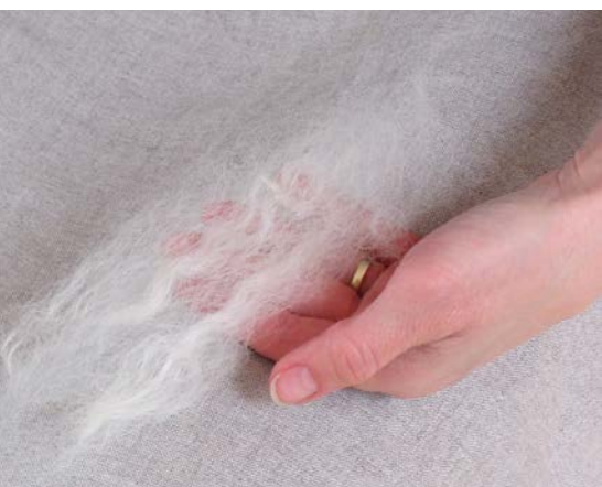
Hotový vyčesaný trs ovčí vlny