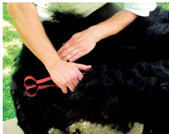
Stříhané ovčí rouno postupně klesá dolů

Na některých místech se samozřejmě nemusí podařit stříhat hned napoprvé těsně u kůže a přestřížky vzniknou. Je proto nutné je pak z vlněného rouna vytržít. Kdyby se tyto přestřížky smíchaly s ostatní kvalitně ostříhanou vlnou, krátké vlasy by pak z upředené příze odstávaly a píchaly.