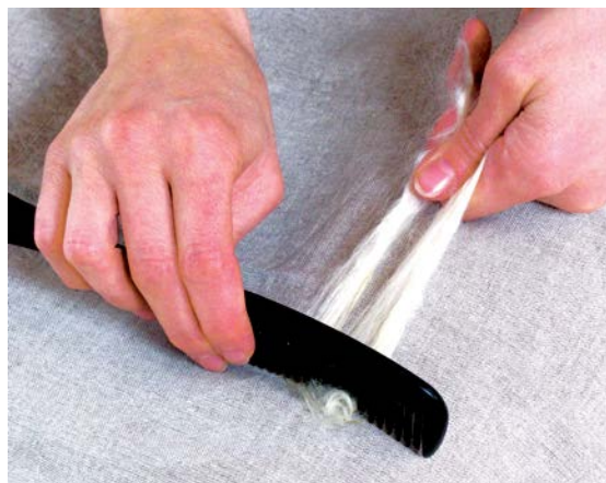
Vlákna se narovnávají a prodlužují