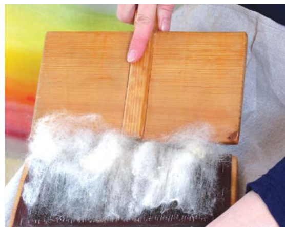
Rozčesání – vrchní kramplí se táhne k sobě