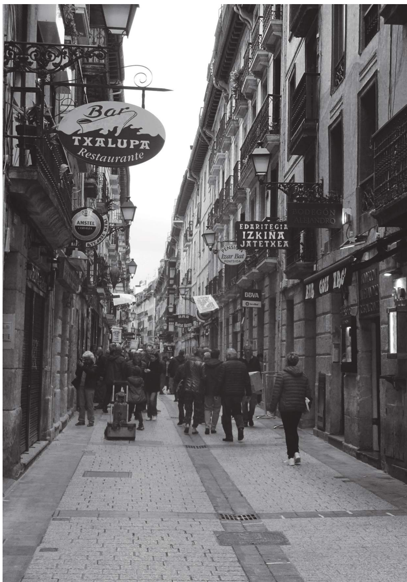
San Sebastian – Parte Vieja – staré centrum.