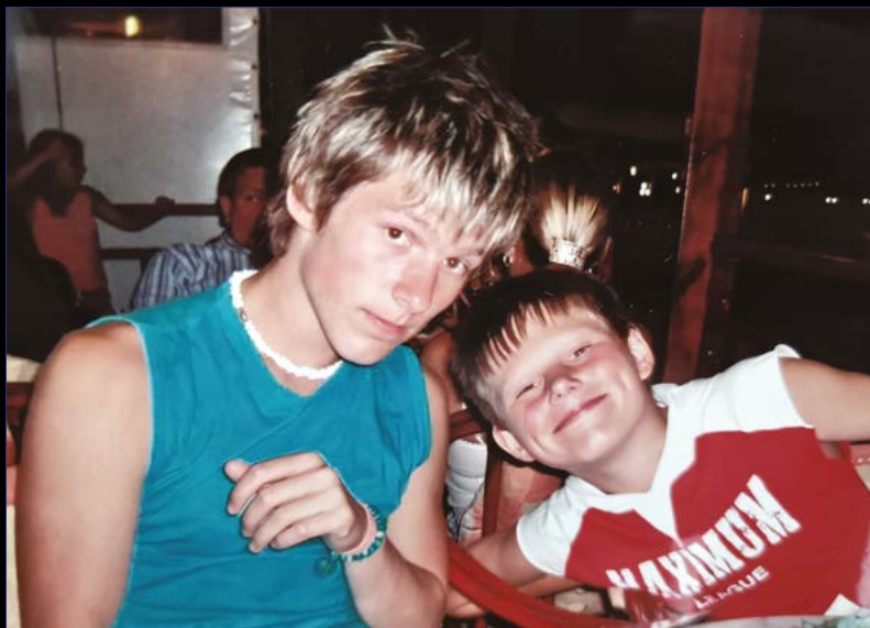
Momentka s bráchou.