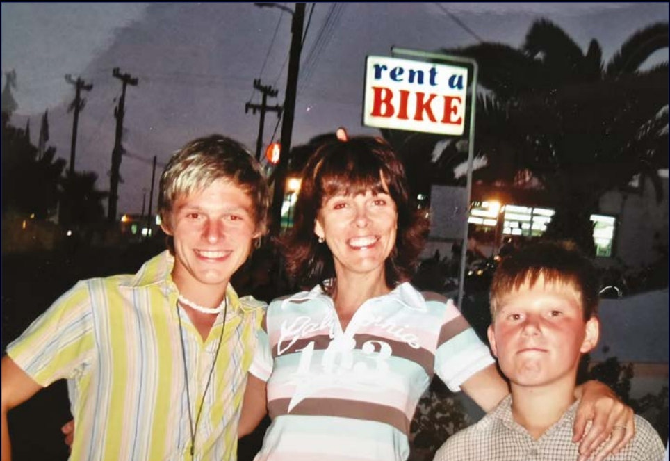
Já, mamka a brácha na dovolené.