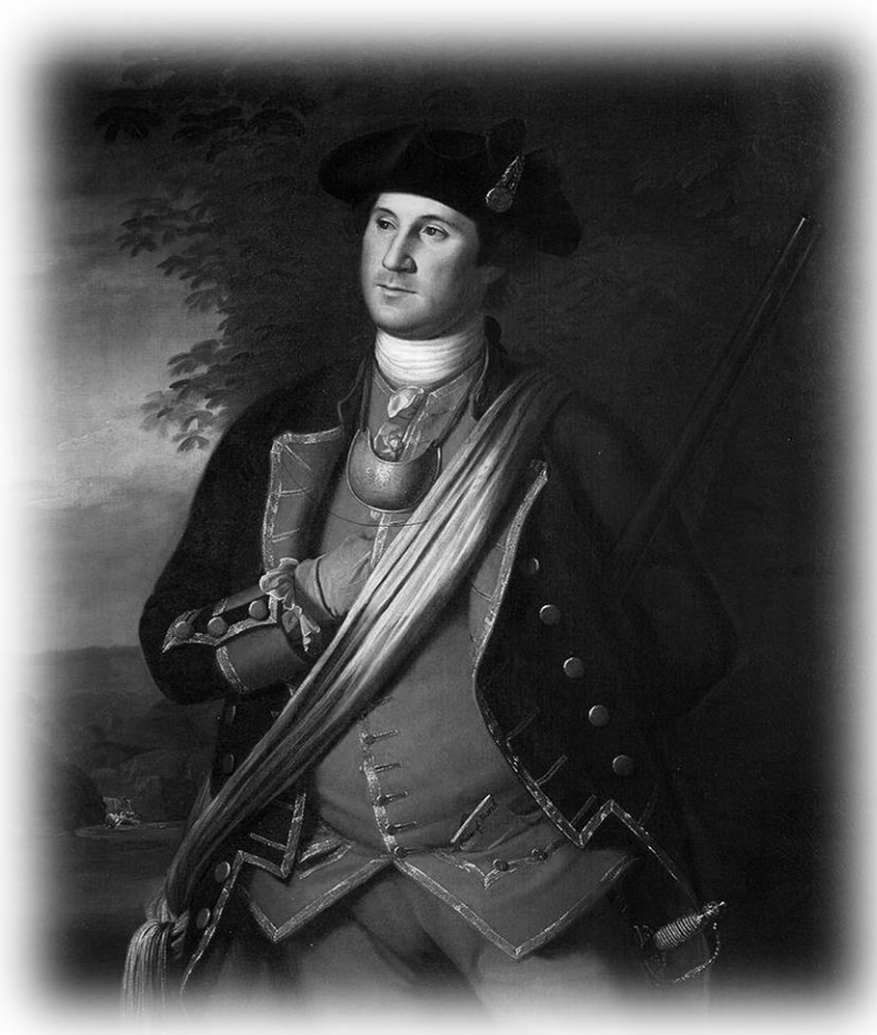
George Washington 1772

Anglická pevnost nebo spíše palisádová ohrada s jedinou budovou uprostřed byla dokončena třetího června a Washington ji pojmenoval Fort Necessity. Palisády byly dva metry vysoké a uvnitř stál provizorní muniční sklad. Do devátého připochoval virginský regiment a hned po něm oddíl