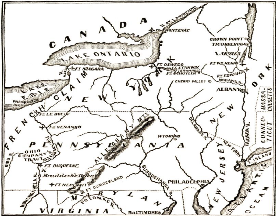
MAP OF THE SCENE OF OPERATIONS.