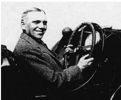
Známy a úspěšný závodník za volantem vozu