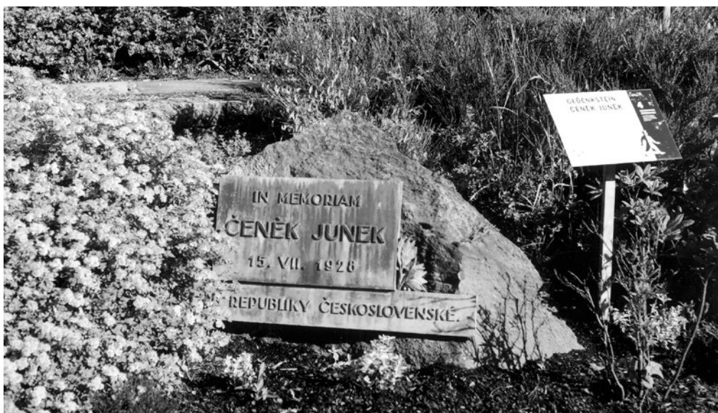
V areálu německého okruhu Nürburgring stojí trvalá vzpomínka na velkého českého závodníka