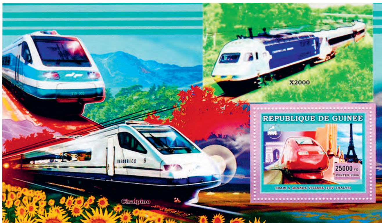
Známkový aršík s vlaky HST

Je zajímavé, že v kolébce železnic, v Anglii, byla vydána první známka s železniční tematikou až v roce 1980. Nejvíce zobrazovanou lokomotivou na poštovních známkách je beze sporu lokomotiva Georga Stephensona „Raketa“. Do známkové tvorby se dostávají většinou velmi zajímavá témata a železnice k nim určitě patří. Proto jsou v této knize uvedeny poštovní známky a aršíky týkající se rychlých vlaků. Možná to bude někoho inspirovat k novému koníčku: sběru poštovních známek s tématem železnice. V rámci Odborového sdružení železničářů působí svaz FISAIC, což je oblast zájmové činnosti, a mezi nimi je také skupina železničních filatelistů.