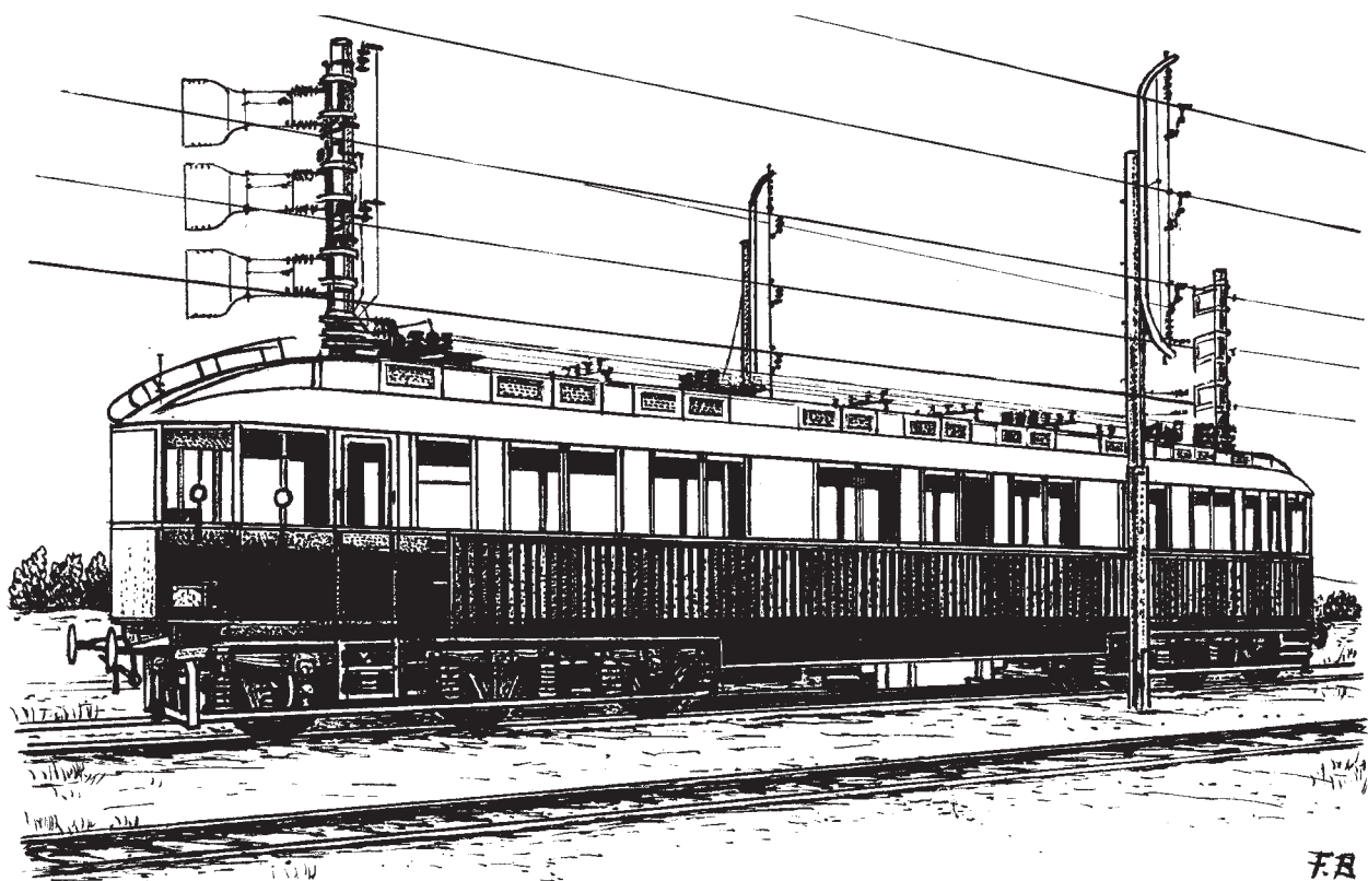
Elektrický vůz Siemens