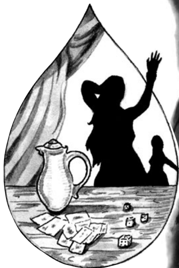
Karty, víno, hosty, ženy

Psal se rok 1606. Bylo to v úterý 29. listopadu, před svatým Ondřejem, když mi přišel rozkaz dostavit se na Staroměstskou radnici. Bylo také řečeno, ať napřed pošlu pacholka – ten měl