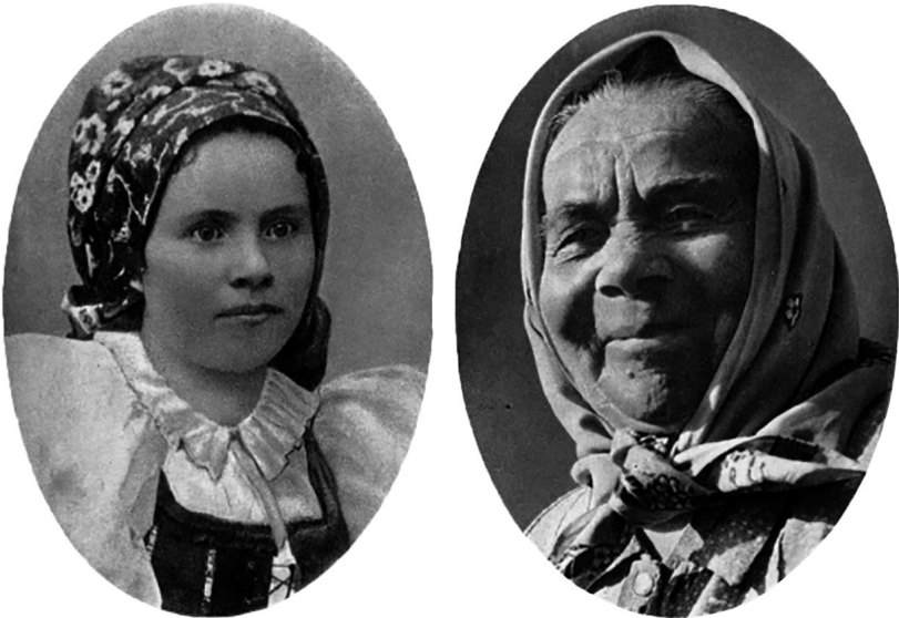
Matka Klementa Gottwalda zamlada a ve stáří.