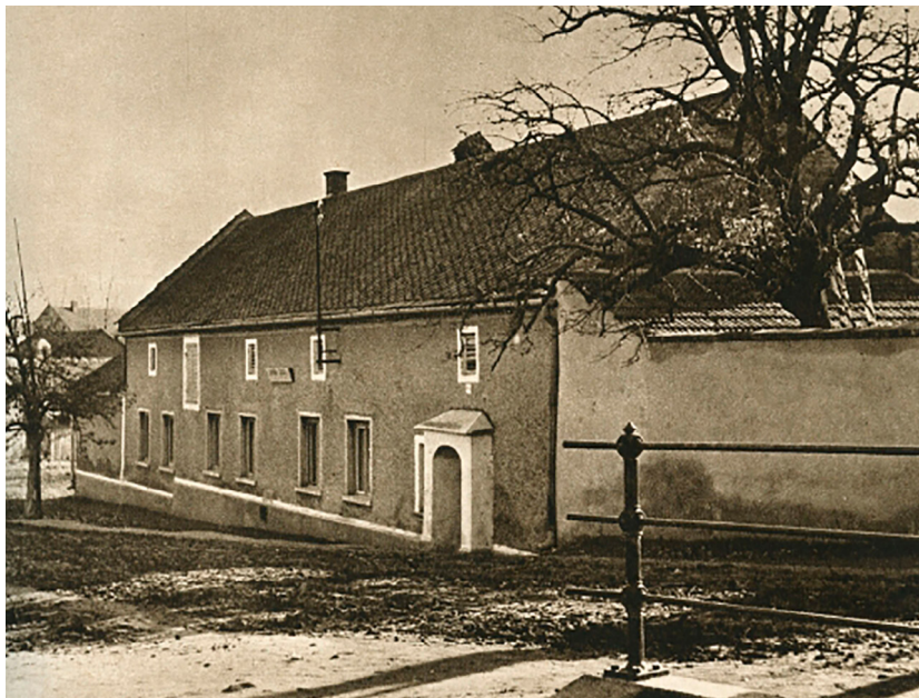
Rodný dům Klementa Gottwalda v Dědicích.

Dětství tak můžeme chápat jako dobu vytváření základů našeho jáství, kdy jsme velice citliví na všechny vnější podněty, jež formují budoucí osobnost každého z nás a spoluutvářejí i náš vnitřní duševní svět. Dětství je alfou a omegou naší budoucnosti, našeho chování i činů v dospělosti, ačkoli to nemusí platit vždycky. Poměry, v nichž vyrůstáme nás však přesto do značné míry formují. To je jen těžko zpochybnitelná premisa, kterou vám potvrdí každý zkušenější psycholog.