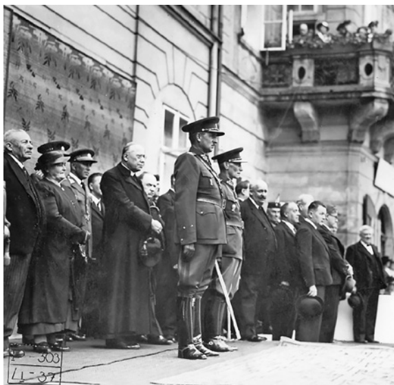
Královéhradecký biskup Mořic Pícha se 2. července 1937 účastní oslavy výročí dvacet let bitvy u Zborova (VHA).

existovala široká škála názorů a postojů od ztotožnění se s monarchií až po požadavek samostatného národního státu.