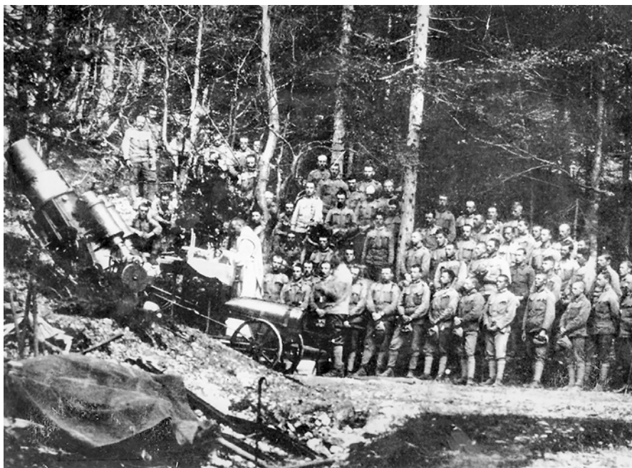
Rakouská polní mše sloužená za první světové války vedle těžkého moždíře.

Všechnu tuto práci matriční zastával jen polní kurát. Bylo by praktické a účelné tuto práci svěřiti několika úředníkům bez rozhledu v této věci? Bylo by účelné odstraniti vše to, co udržovalo náš zdravý organismus národní? A to můžeme s pýchou říci, že všude polní kněz jediný to byl, který klesající mysl zoufalého vojína Čecha udržoval zpříma a před lhostejností uchránil.