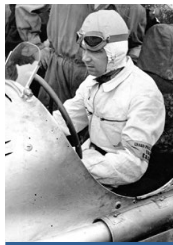
Grand Prix Francie, 1. července 1934: Rudolf Caracciola za volantem svého W 25 krátce před startem

Jeho rychlý vzestup ve dvacátých letech byl spojen s K a S modely vozů s hvězdou, až po SSKL z roku 1931, který byl něžně nazývaný „Bílý slon“. Po úspěšném intermezzu u Alfya Romea v roce 1932 se pak stal synonymem vzestupu a úspěchů stříbrných šípů v druhé polovině třicátých let. V roce 1931 vyhrál jako první cizinec Mille Miglia. Téhož roku se Caracciola opět stal evropským mistrem závodů do vrchu. Roku 1932 měli s přítelem Luisem Chironem soukromý tým Scuderia C.C., ve kterém jezdili na Alfě 8C.