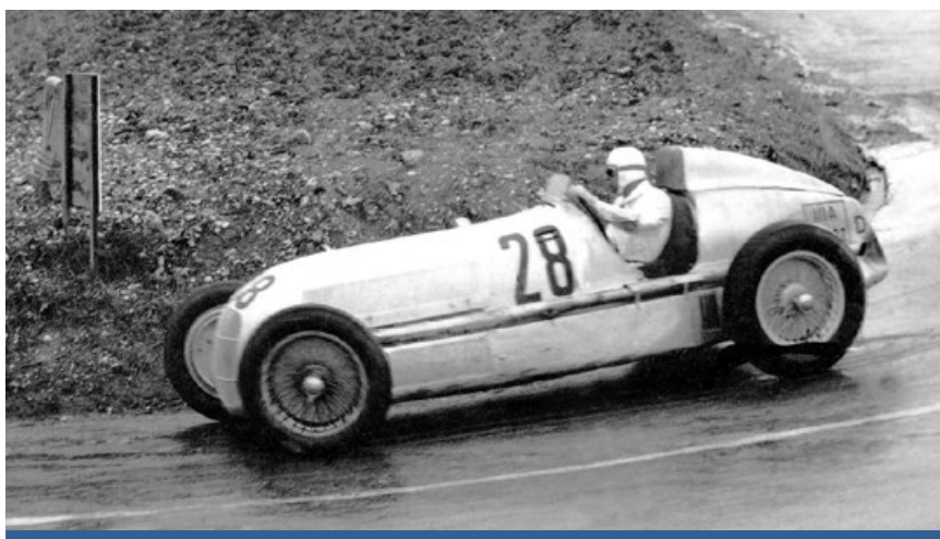
Coppa Acerbo, Pescara, 15. srpna 1934: Rudolf Caracciola se startovním číslem 28 v závodním voze Mercedes W 25

mercedes. Nikde nebylo ani živáčka, první Rudiho zkouška po třináctiměsíční vynucené pauze se měla odehrát beze svědků. Rudi to tak chtěl, na této zkoušce závisela jeho smlouva, celá jeho budoucnost. AVUS byl pro tuto příležitost díky dvěma rovinkám a dvěma zatáčkám zvolen velmi vhodně. Znamenalo to jen dvakrát brzdit a dvakrát akcelarovat. Vydrží zraněná noha? Ranní ticho přetrhl ryk kompresoru. Vůz zmizel jižním směrem. Stopky počítaly, tikaly – a naměřily skvělé časy. Neubauer byl nadšen, „jeho“ Rudi je zpátky. Starý dobrý Rudolf Caracciola! Po několika kolech Caracciola raději zastavil v boxech. Neubauer mu hned gratuloval a ujistil svého pilota, že angažmá v týmu je jasné! Rudi pak chtěl vylézt z kokpitu, ale nepodařilo se mu to, museli mu pomoci mechanici a vytáhnout ho. Neubauer opět začal pochybovat. Když s ním toto udělalo pět kol, jak zvládne celý závod? Vydrží to ohromné zatížení? Ale německé noviny se už předháněly, kdo přinese dříve a více zpráv o tom, že Caracciola je zpět za volantem.