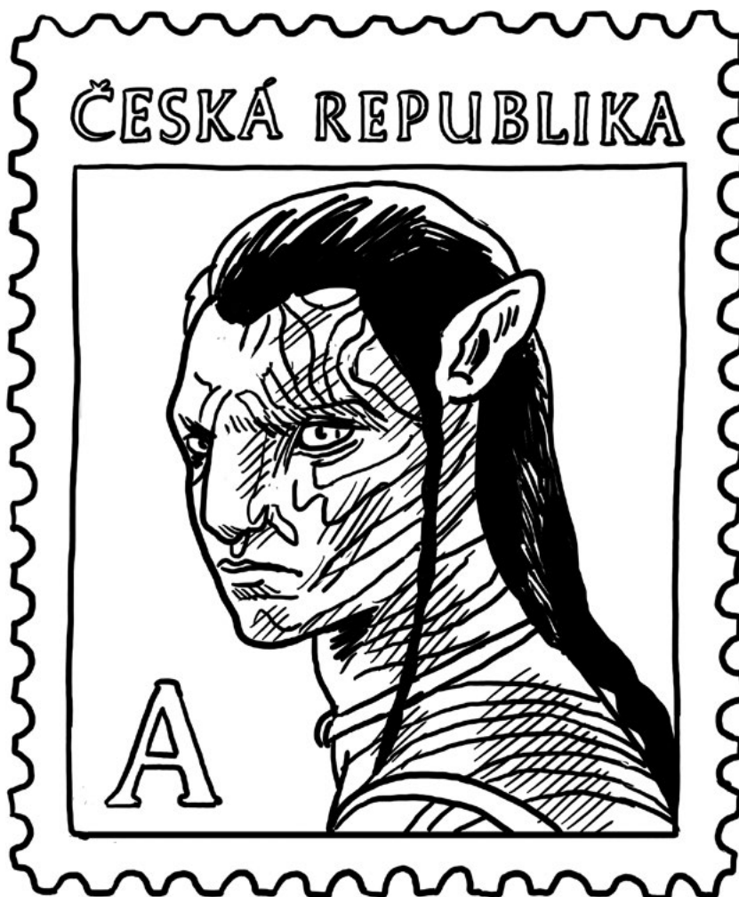
Meziplanetární mise objevila známky existence Avatarů na poště v Praze 4-Nuslích.