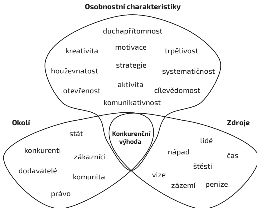
Obr. 1.3 Předpoklady k podnikání a konkurenční výhoda

odlišuje od podniků, které na trhu poskytují stejné či obdobné produkty a služby. Konkurenční výhoda je tedy výsledkem mixu osobnostních charakteristik, zdrojů, které máme k dispozici, a vnějších podmínek, ve kterých chceme uspět; znázorňuje ji obr. 1.3.