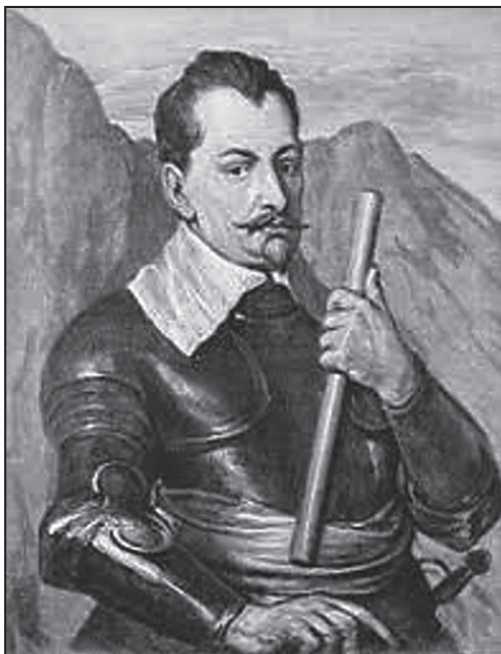
ALBRECHT Z VALDŠTEJNA A JEHO ERB

letí předbíhající dílo bylo rozvráceno. V Jičíně a Frýdlantě zůstalo po svém plánovači reforem a architektu jen několik stavitelských skvostů, dodnes stojí dlouhé rovné aleje vzrostlých topolů a kdysi perfektní cesty, vedoucí odnikud nikam. V Praze němou slávu připomíná skvělý Valdštejnský palác. A to je tak asi všechno.