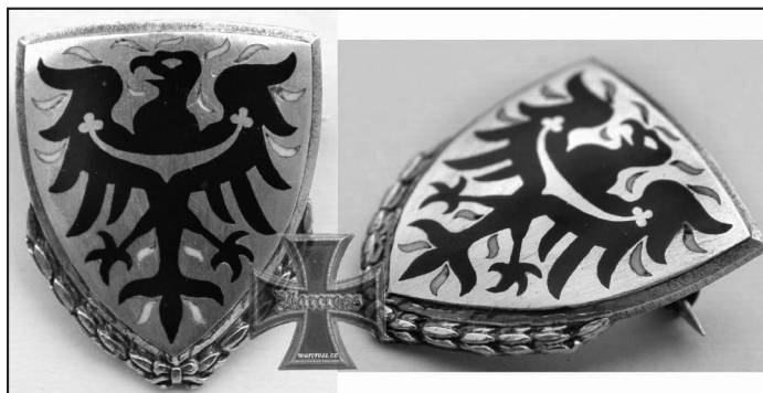
SYMBOL VYZNAMENÁNÍ PROTEKTORÁTU