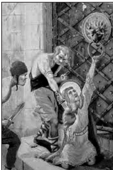
VRAŽDA VÁCLAVA BOLESLAVEM