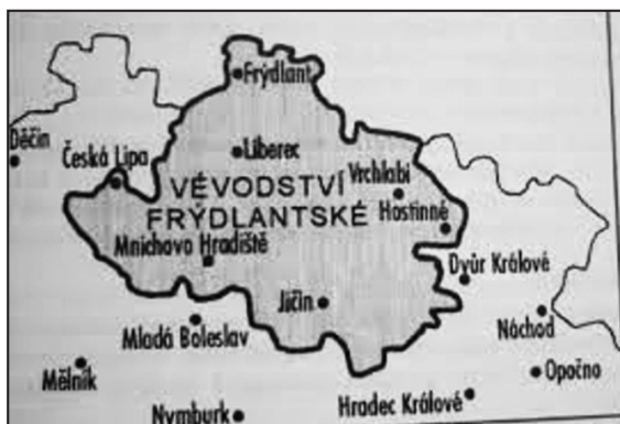
MAPA KNÍŽECTVÍ ALBRECHTA Z VALDŠTEJNA