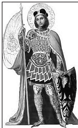
SYMBOL SVATÝ VÁCLAV