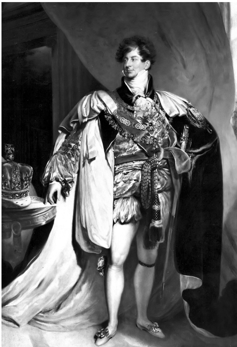
Britský regent Jiří, budoucí král Jiří IV.