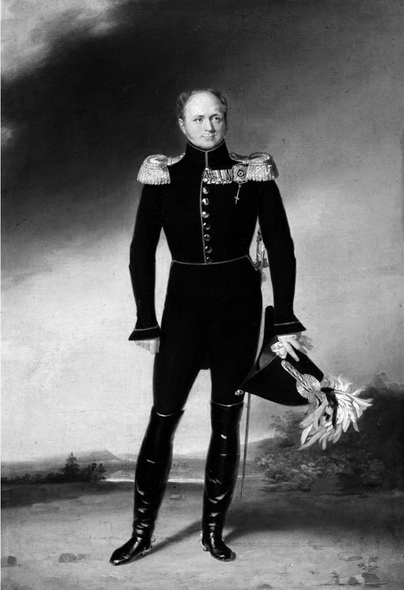
Ruský car Alexandr I.