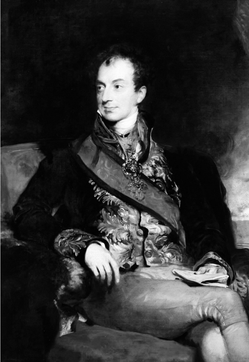
Klemens Václav Lothar, kníže Metternich – rakouský kancléř